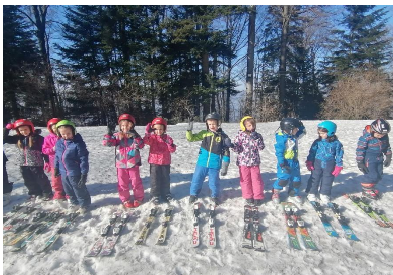
Slika 20. Djeca rane i predškolske dobi na zimovanju

priliku da provedu dan na otvorenom na svježem zraku, priliku da ostanu sa svojim prijateljima u istom smještaju, što omogućuje da iskuse vrijednosti povezane sa životom u zajednici. Zimovanje djeci pruža prednost boravka u povoljnim klimatskim uvjetima, omogućavajući niz aktivnosti koje ispunjavaju njihove biološke i fizičke potrebe za kretanjem.