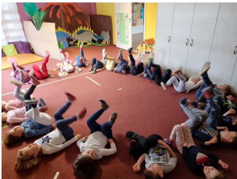
Slika 8. Pripremni dio aktivnosti tjelesnog odgoja: opće pripreme vježbe

oslanjajući se na reakcije djece. Na kraju pripremnog dijela aktivnosti, djeca vraćaju opremu koju su koristila na odgovarajuće mjesto, ako im nije potrebna za sljedeći dio aktivnosti.