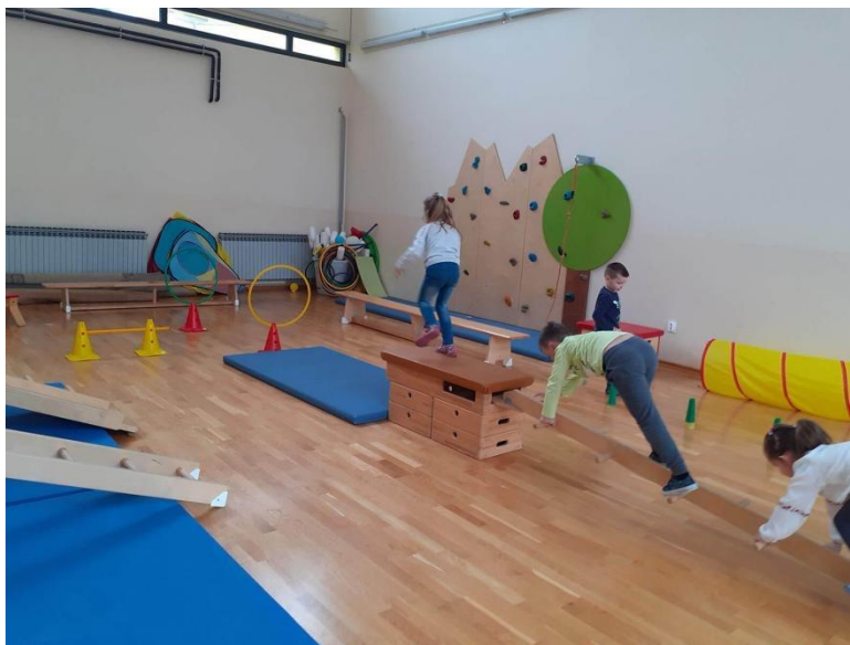
Slika 9. Glavni "A" dio aktivnosti tjelesnog odgoja: poligon

U ovom dijelu aktivnosti izvođenje motoričkih zadataka obično zahtijeva upotrebu raznovrsne sportske i druge opreme. Važno je uključiti svu djecu u pripremu vježbačkog prostora kako bi bila aktivna tijekom cijele aktivnosti, osjećala se korisno i važno te zadržala koncentraciju i kontinuitet u radu. Potrebno je pažljivo planirati raspored radnih mjesta na vježbačkom prostoru kako bi svako dijete imalo dovoljno prostora. Kada se postavi prvo radno mjesto ili motorički zadatak, odgojitelj ga kratko opiše i demonstrira ili odabere dijete da pokaže izvođenje zadatka uz odgojiteljevo verbalno opisivanje. Nakon toga djeca započinju s vježbanjem, dok odgojitelj prati njihov napredak i postavlja sljedeće radno mjesto. Osim ispravljanja grešaka i pružanja dodatnih uputa, odgojitelj motivira, pohvaljuje i ohrabruje djecu. Posebno je važno poticati djecu da prođu kroz sva radna mjesta i osigurati svakom djetetu dovoljno vremena i prilike da usavrši svaki predviđeni motorički zadatak. Po završetku ovog dijela aktivnosti, djeca trebaju pospremiti svu korištenu opremu na odgovarajuće mjesto, osim ako ta oprema neće biti potrebna u sljedećem dijelu aktivnosti.