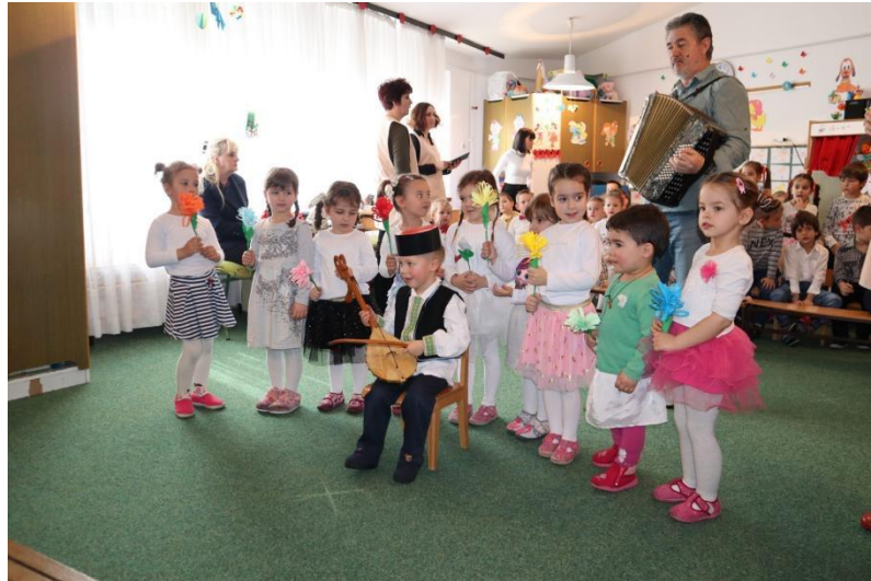
Slika 17. Priredba djece rane i predškolske dobi