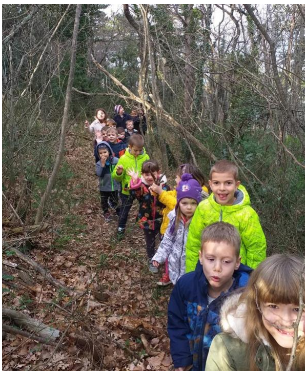
Slika 18. Šetnja šumom s djecom rane i predškolske dobi

Tijekom šetnje je bitno održavati interakciju s djecom, usmjeravajući njihovu pozornost prema cilju promatranja. Poželjno je da se djeca ne vraćaju istim putem u vrtić, a prilikom povratka trebaju svoju odjeću i obuću pospremiti, oprati se i pripremiti za sljedeće aktivnosti. Trajanje šetnje ovisi o čimbenicima kao što su dob djeteta, svrha šetnje i prevladavajući vremenski uvjeti. Mlađa djeca mogu sudjelovati u šetnjama u trajanju oko petnaest minuta, dok ona u srednjim dobnim skupinama mogu sudjelovati u šetnjama do dvadeset minuta. Starije dobne skupine mogle bi produljiti svoje šetnje na otprilike trideset minuta. U slučajevima kada u vrtiću nedostaje dovoljno prostora za slobodnu igru i boravak djece na otvorenom, šetnje bi trebale biti neizostavan dio rada i programa vrtića.