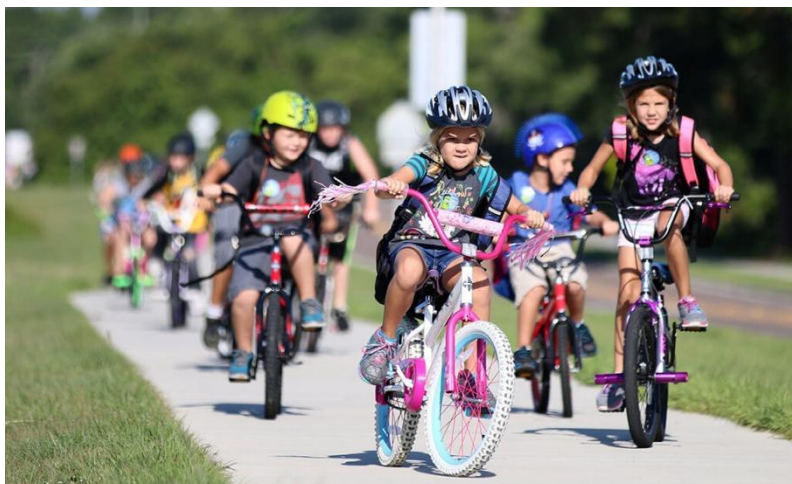
Slika 4. Tematsko vježbanje djece rane i predškolske dobi

Tematsko vježbanje podrazumijeva unaprijed planiranu aktivnost koju voditelj određuje i provodi s djecom. To obično uključuje jednostavan motorički zadatak koji može opisati voditelj, a varira od nekonvencionalnih aktivnosti kao što je trčanje za balonima do standardnih aktivnosti kao što je vožnja bicikla. Na prirodu zadatka utječu djetetova dob, interesi i sposobnost da ga izvrše, što određuje trajanje aktivnosti. Za mlađu djecu tematske vježbe obično traju od pet do sedam minuta, dok za stariju djecu može trajati od 20 do 30 minuta. Kombinirajući nekoliko tematskih zadataka za mlađu skupinu, postupno ih se uvodi u "sat" igre (Neljak, 2009).