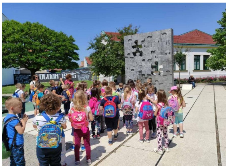
Slika 19. Djeca rane i predškolske dobi na izletu

Uz obavještanje roditelja, potrebno je u suradnji s njima odrediti koliko će i koji roditelji uz odgojitelje pratiti djecu na izletu. Važno je stvoriti pozitivnu i ugodnu atmosferu među djecom razgovorom o nadolazećem izletu. Tijekom samog izleta važno je pridržavati se unaprijed utvrđenog plana i programa, krenuti na izlet, ali i vratiti se u dogovoreno vrijeme.