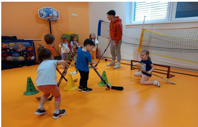
Slika 15. Integrirani sportski program

Integrirani sportski programi obično se odvijaju unutar redovitog programa ustanova ranog odgoja, poznatih kao "sportski vrtići". Specijalizirani sportski programi provode se nakon redovnog programa te se opisuju kao kraći, specijalizirani programi voditelja osposobljenih za rad u sportu.