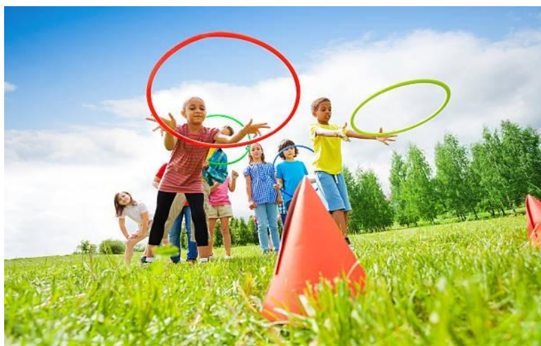
Slika 10. Glavni "B" dio aktivnosti tjelesnog odgoja: štafetna igra

Zajedno s djecom, odgojitelj dogovara što će donijeti od opreme i kako će je postaviti na vježbačkom prostoru. Kada su radna mjesta postavljena, odgojitelj kratko opiše planirani sadržaj i po potrebi ga demonstrira kako bi djeca stekla jasnu predodžbu o strukturi motoričkog sadržaja koji će izvoditi. U glavnom "B" dijelu aktivnosti obično se provode sadržaji visokog intenziteta. Odgojitelj treba biti fokusiran kako bi maksimalno iskoristio odgojne mogućnosti ovakvog sadržaja, posebno kinezioloških igara. Ako je potrebno, važno je podsjetiti djecu na dogovorena pravila, pojasniti ih ili zaustaviti igru i dati dodatne upute, uz ohrabivanje i motiviranje djece. Glavni "B" dio završava kada djeca pospreme svu opremu koju su koristila, a koja im neće trebati za nastavak aktivnosti.