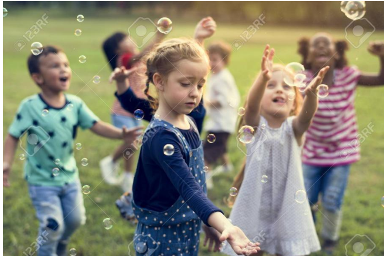
Slika 6. Igra „Lov na mjehuriće”