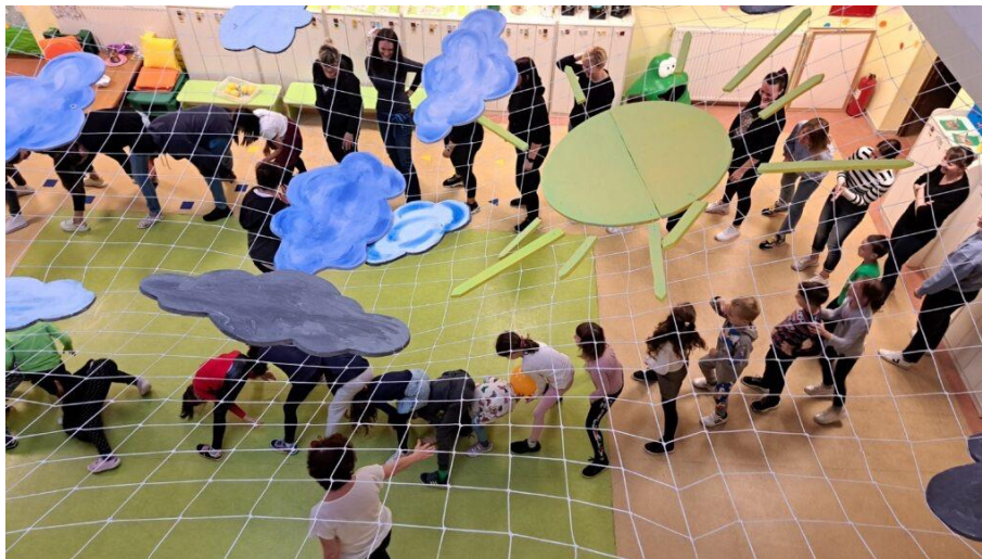
Slika 14. Tjelesno vježbanje s roditeljima: kineziološka radionica

suvremene tehnologije u tjelesne aktivnosti te implementaciju vježbanja u svakodnevni život obitelji. Preporučuje se provođenje ovih aktivnosti najmanje tri puta tijekom jedne pedagoške godine. Odgojitelji redovito pružaju informacije roditeljima o dobrobitima tjelesne aktivnosti, naglašavaju važnost zajedničkog vremena roditelja i djece te potiču tjelesno vježbanje kao ključni faktor za optimalan rast, razvoj i očuvanje zdravlja. Aktivnosti tjelesnog vježbanja s roditeljima mogu se organizirati kao kineziološke radionice za djecu i roditelje, završni događaji nakon određenih razdoblja, tijekom roditeljskih sastanaka, putem promotivnih letaka ili slikovnica te na slične kreativne načine.