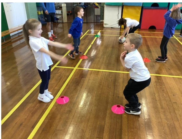
Slika 7. Uvodni dio aktivnosti tjelesnog odgoja: hvatalica u parovima

Uvodni dio započinje znakom od strane odgojitelja za okupljanjem na određenom mjestu unutar vježbačkog prostora. Okupljanje se organizira na mjestu koje odgojitelj smatra najpogodnijim za koncentraciju djece na nadolazeće zadatke. Radi sigurnosti djece, nužno je ponovno provjeriti jesu li svi primjereno odjeveni i obučeni, jesu li cipele ispravno vezane ili nose papuče, jesu li djeca skinula nakit, jesu li dugačke kose pričvršćene i slično. Aktivnost tjelesnog odgoja započinje službenim sportskim pozdravom, koji bi uvijek trebao biti isti i lako prepoznatljiv djeci. Planirani sadržaj treba kratko opisati i po potrebi demonstrirati kako bi djeca razumjela motoričke zadatke koje će izvoditi. Tijekom izvođenja aktivnosti, odgojitelj treba biti smješten na poziciji koja omogućuje pregled cijelog prostora za vježbanje kako bi mogao pravodobno reagirati na sve situacije, kao što su usmjeravanje djece, korigiranje pogrešaka, dodatna pojašnjenja po potrebi, pohvale tijekom rada, poticanje, motiviranje, upućivanje, pružanje pomoći kad je potrebno, ohrabrivanje i slično. Nakon što djeca završe sa sadržajima, pospremaju svu opremu koju su koristili na odgovarajuće mjesto, s obzirom da im neće biti potrebna u sljedećem dijelu aktivnosti.