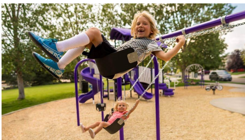
Slika 3. Spontano vježbanje djece rane i predškolske dobi

Spontano vježbanje je neplanirana tjelesna aktivnost koju pokreću sama djeca bez vodstva instruktora. Djeca se dobrovoljno uključuju u ovu aktivnost, započinju je, ali i prekidaju na temelju svojih interesa i drugih čimbenika. Uloga voditelja tijekom spontanog vježbanja prvenstveno je pružiti sigurnost djeci. Korisno je poticati spontano vježbanje više puta dnevno jer pridonosi poboljšanju biotičkih motoričkih znanja i vještina djece (Neljak, 2009).