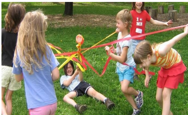
Slika 12. Poticajno tjelesno vježbanje: igra na livadi pomoću elastika