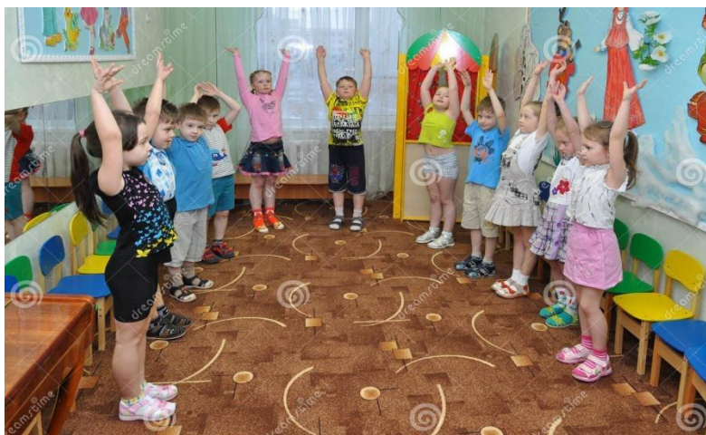
Slika 5. Jutarnje vježbanje djece rane i predškolske dobi

opcija, prostorija mora biti dobro prozračena, s otvorenim prozorima koji osiguravaju cirkulaciju svježeg i čistog zraka (Neljak, 2009).