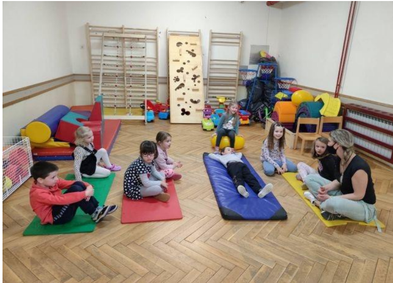
Slika 11. Završni dio aktivnosti tjelesnog odgoja: odgojitelj razgovara s djecom