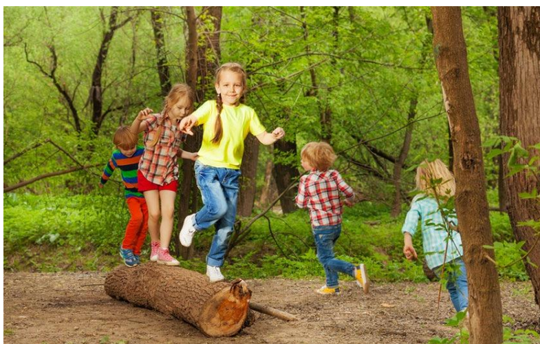
Slika 1. Djeca rane i predškolske dobi svladavaju prepreke u prirodi

Prema Findaku (1995) razdoblje rane i predškolske životne dobi predstavlja povoljnu fazu za poticanje cjelovitog kinantropološkog razvoja i pospešivanje stjecanja bitnih motoričkih znanja kod djece. To uključuje njegovanje njihove sposobnosti da se učinkovito snalaze u prostoru, svladavaju prepreke, podnose otpor i manipuliraju objektima. Ova ključna faza obuhvaća cjelokupni djetetov motorički razvoj, manifestirajući se kao najintenzivnija i najpotpunija faza. Rano i predškolsko razdoblje predstavlja važnu prekretnicu za cjelovit napredak dječjih motoričkih sposobnosti.