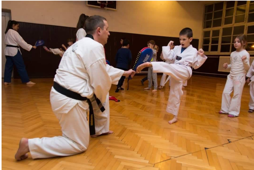
Slika 16. Specijalizirani sportski program: taekwondo