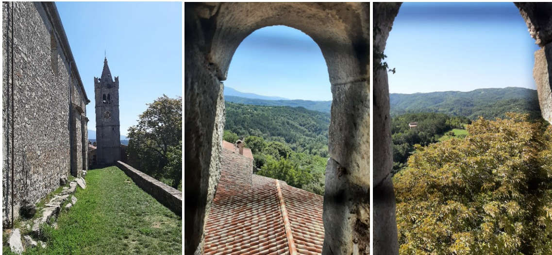
Slika 5., 6. i 7. Humski zvonik i njegov pogled na okolicu.

napad bio osvetnička namjera, u kojoj se trebalo osvetiti za smrt jednog njihovog člana skupine. 71