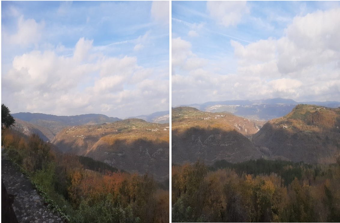
Slika 14. i 15. Slika iz Sovinjaka s pogledom prema kanjonu rijeke Mirne.