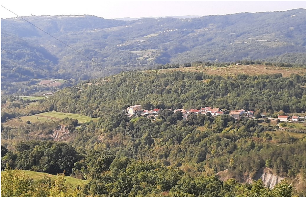
Slika 31. Pogled na selo Račice iz obližnjeg sela Račički Brijeg.