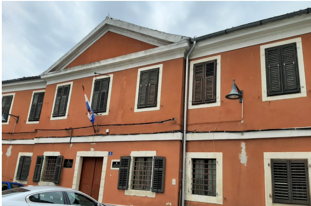
Slika 34. Zgrada nekadašnje palače Rašporskog kapetana u Buzetu.

kapetana 1788. završetak obnove 1784. župne crkve, na što su građani bili posebice ponosni. Ujedno, obnovljeni su i ostali objekti i javna dobra. 117