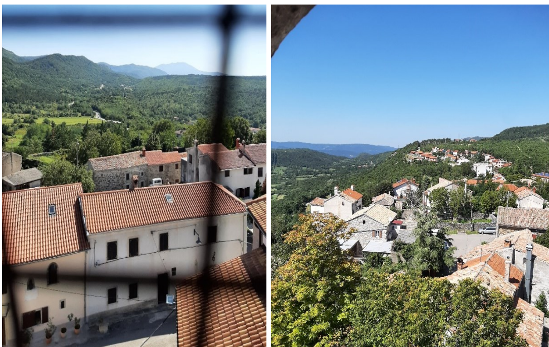
Slika 20. i 21. Pogled s ročkog zvonika na južnu i zapadnu stranu.