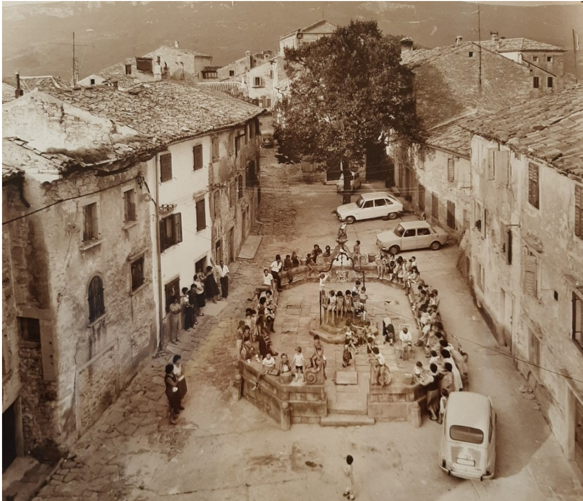
Slika 37. Vela šterna slikana 1981.

Posljednji, 162., rašporski kapetan koji je dočekaio raspad Mletačke Republike bio kapetan Gasparo Dolfin (1796.-1797.). 121 Padom Mletačke Republike 1797. istarski poluotok potpast će pod vlast jednog vladara. Kuća Habsburg nakratko će proširiti svoje posjede po Istri, do Napoleonovog kratkog dolaska i odlaska. Austrija će nakon Napoleonove vladavine ponovno zagospodariti cijelim poluotokom, što će označiti novo razdoblje istarske povijesti.