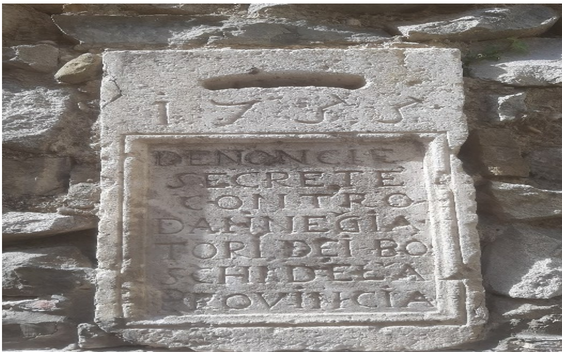
Slika 33. Kameni sanduk zvan „lavlja usta“, gdje su ljudi ubacivali pisma onih ljudi za koje oni smatraju da su oštetili Republiku. Na sandučić je isklesana godina 1755. i sadrži talijanski natpis koji preveden glasi ovako: Tajne prijave protiv oštećivača (kradljivca) državnih šuma.

stablo za ogrjev, no strogi zakoni o šumama nisu marili za sirotog seljaka. 115 Stoga je Republika dala da se na svaku državnu zgradu uzida takozvana lavlja usta, „bocca di leon“. Lavlja usta izgledala su poput modernog poštanskog sandučića u koji su stanovnici koji su željeli biti anonimni, ubacivali papiriće s imenima seljaka koji su posjekli stablo i time „naškodili“ republici ili komuni. No, šume za Mletačku Republiku bile od velike važnosti te su ih na svakakve načine željeli zaštititi od nepropisne siječe. 116