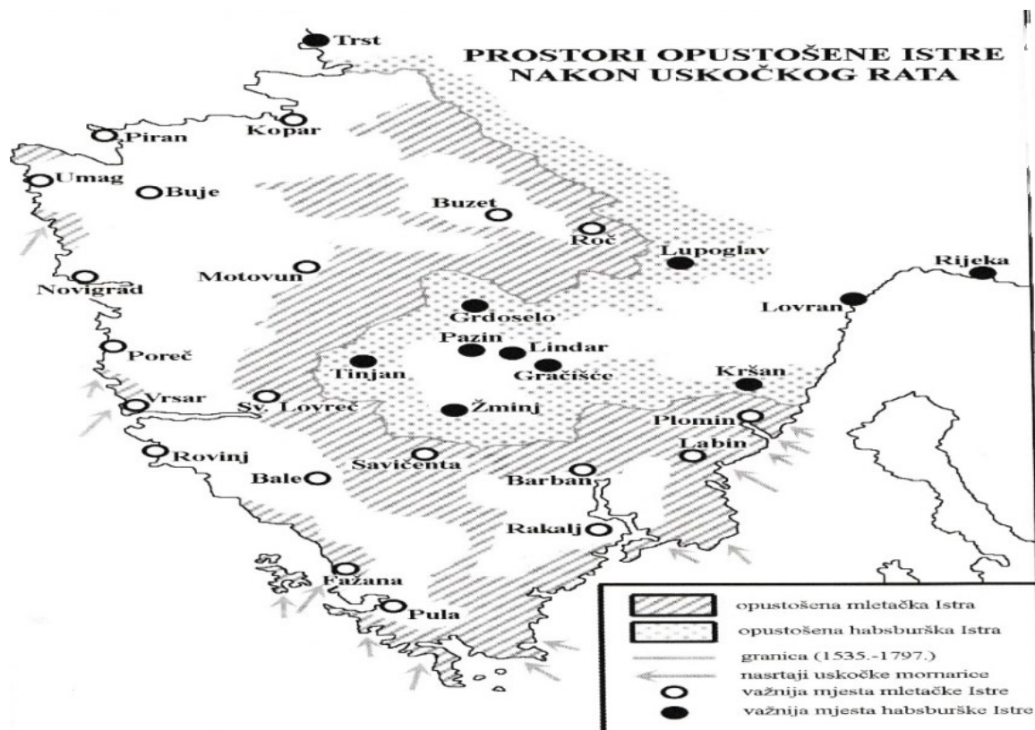
Slika 4. Područja zahvaćena sukobima u Uskočkom ratu.

Sukobi koji su se vodili na istarskom poluotoku nisu nalikovali tradicionalnom, strateškom i taktičkom ratovanju, koje se rabilo u 16. stoljeću. Ratovanje u Istri svodilo se na puke prepade i juriše s ciljem što više pokrasti, spaliti i uništiti neprijateljsku imovinu. Kako su si zaraćene strane sve više uništavale posjede, došlo je i do otimanja ljudi te se za njih tražio otkup za velike iznose novca. 66 Jedino klasično ratovanje gdje su se sastale i sukobile dvije vojske vodilo se u Furlaniji oko tvrđave Gradiške. 67