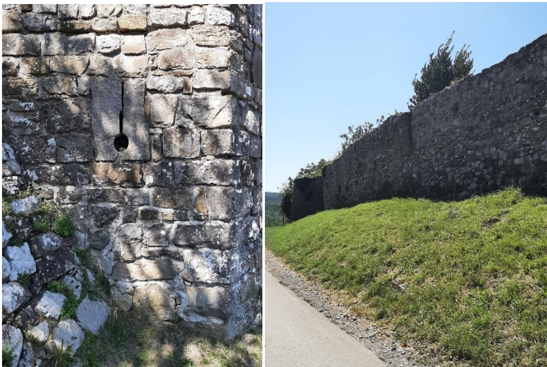
Slika 18. i 19. Otvor za pušku i ostaci zidina koje okružuju Roč.