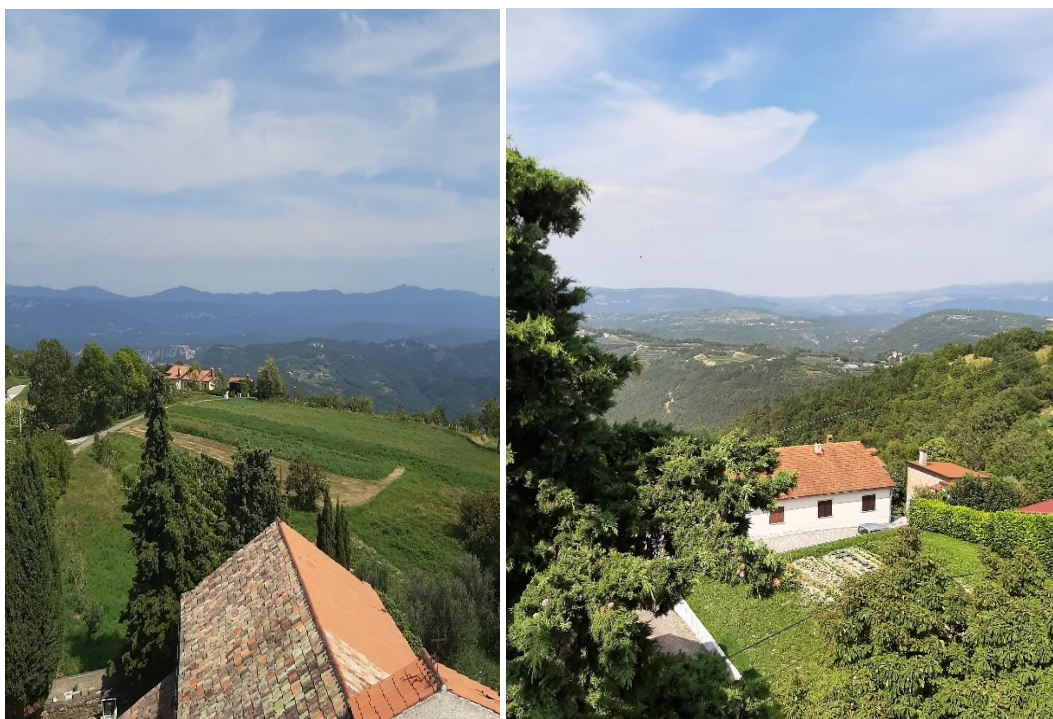
Slika 10. i 11. Pogled iz zvonika na Vrhu na sjevernu i zapadnu stranu.

Selo Vrh veliko je naselje smješteno između brda Draguč i sela Sovinjak. Nekoliko je puta bilo napadnuto tijekom Uskočkog rata, no nije pretrpjelo strašna uništavanja. Vrh je prvi put bio napadnut 3. prosinca 1615., kada je u okolici uspješno pokradena stoka seljacima, pogotovo u većem selu Račice. Drugi put, Vrh je napadnut 8. travnja 1616., a njegova je okolica bila spaljena. Vrlo brzo, već u svibnju, seljaci iz Vrha sudjelovali su u pohodu na pazinska sela Kaščergu, Kršiklu, Previž i Borut te su se tako osvetili vojvodinim seljacima koji su spalili sela oko Vrha. Prema izvješćima Bernarda Tiepola, selo su 1617. morali čuvati plaćenici i črna vojska od upada uskoka. Očekujući napade uskoka, Tiepolo je u ožujku 1617. dao zapovijed stanovnicima Vrha da izgrade obrambene utvrde jer se iščekivao još jači udar uskoka. Na svu sreću napad nikad nije bio izveden. 84