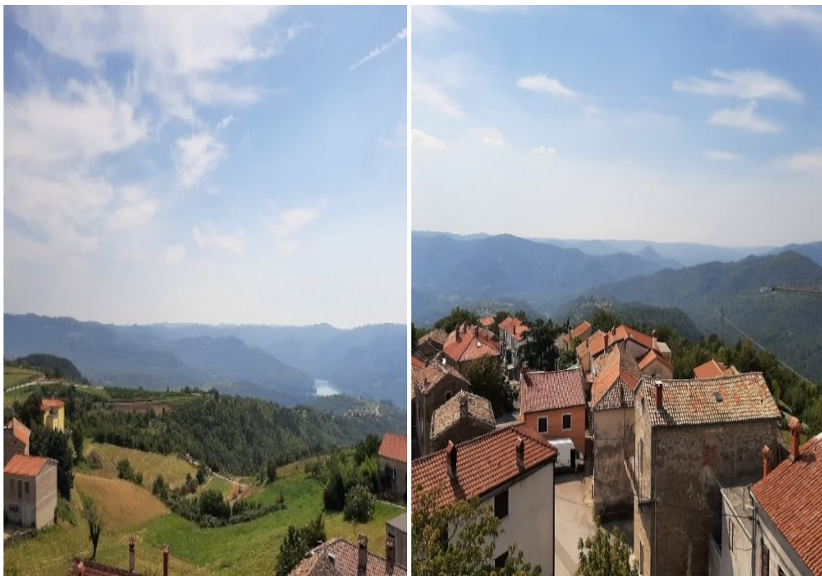
Slika 12. i 13. Pogled iz zvonika na Vrhu na istočnu i južnu stranu.

Selo Sovinjak vrlo je malo stradalo u Uskočkom ratu. U pismima poslanim Senatu od rašporskog kapetana Tiepolo saznajemo da je u selu bila smještena črna vojska i plaćenici koji su branili selo. Tiepolo, od straha da će doći do napada, prisiljavao je stanovnike da izgrade obrambene utvrde oko sela kojima bi se vrlo lako obranili od napada. Uistinu, Sovinjak je i bio napadnut, ali bez uspjeha. Uskoci su uspješno odbačeni i posramljeni. Već iduće godine, 1618., uskoci su bili nedaleko Sovinjaka i imali su u planu napasti ga i spaliti. Na sreću do napada nikada nije došlo. Dobrom uhodničkom informacijom saznale su se namjere uskoka i Tiepolo je poslao laku konjicu, zbog koje uskoci nisu imali nikakve šanse.