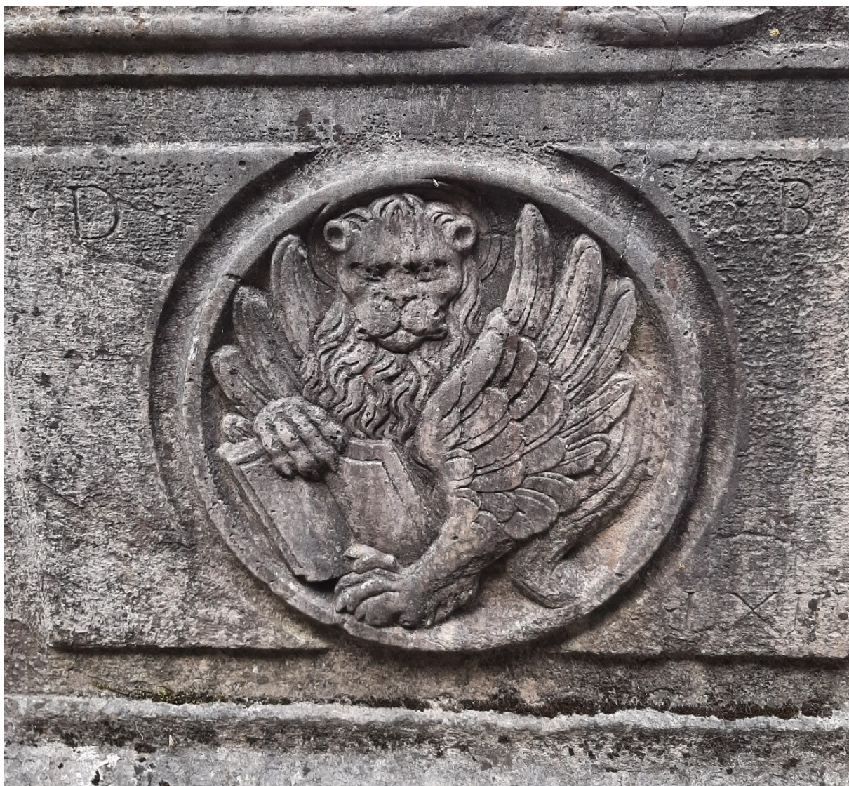
Slika 38. Uklesani krilati lav, u kružnom profiliranom obrubu s inicijalima kapetana Daniela Badoera i godinom obnove 1563.