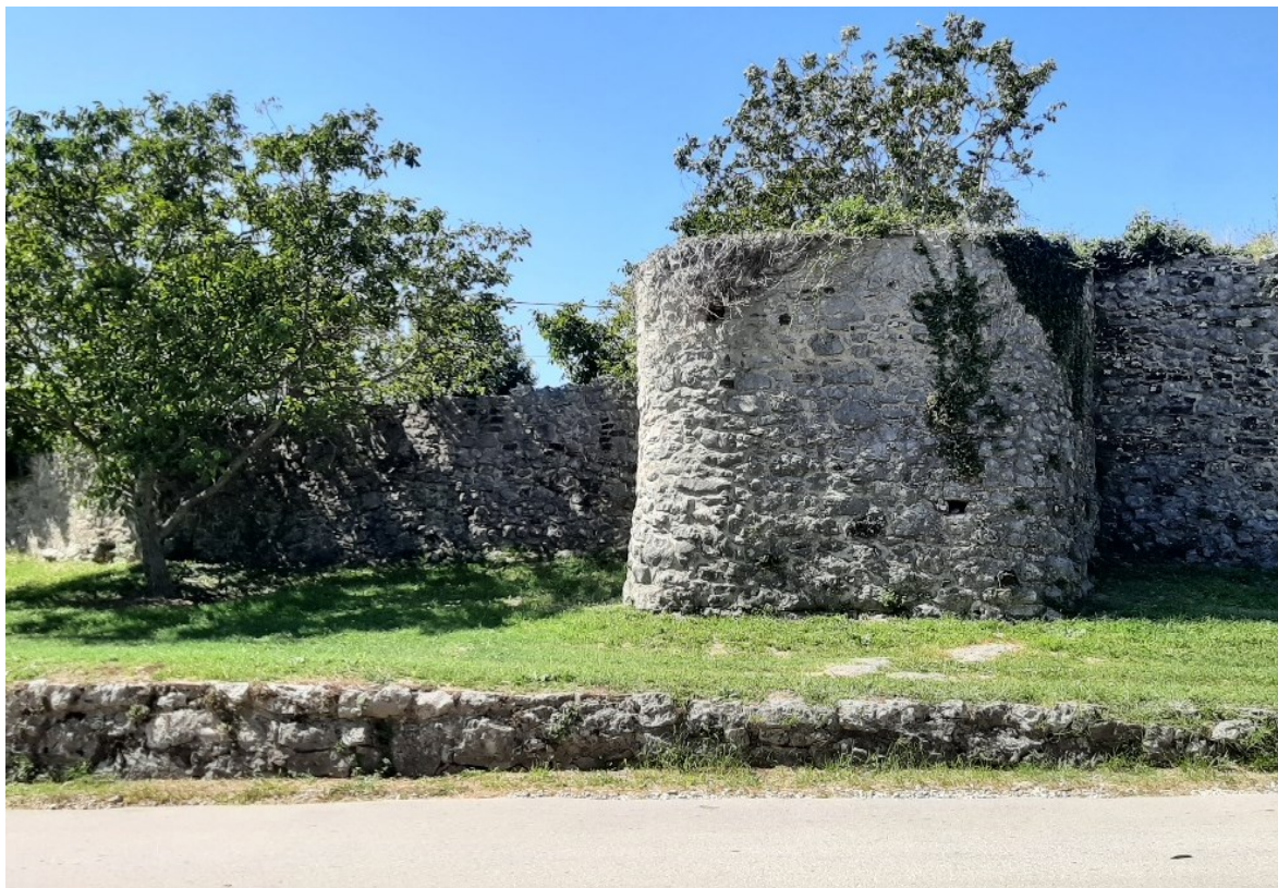
Slika 17. Ostatak nekada obrambene kule; nekada je kaštel Roč okruživalo njih devet.

Poslije Buzeta, drugi najvažniji kaštel bio je Roč. 85 Bilo je to jedno od središta u kojemu je bila redovito smještena mletačka vojna postrojba, u kaštelu koji je posjedovao jedne od najboljih obrambenih zidova na sjevernom djelu poluotoka. 86 Osvajanjem Roča 1412. od strane Venecije, zapovjedbno je stanovnicima da sruše zidine. Vrlo brzo, već 1421. Senat je uvidio veliku pogrešku te zapovjedio da se ponovno podignu zidine oko Roča, zbog osmanskih i austrijskih upada. Oko Roča sagrađene su nove zidine s devet obrambenih kula (danas postoje samo četiri) s puškarnicama te dvojica gradska vrata. Nalazio se istočno od Buzeta i predstavljao jaku crtu obrane za daljnje napredovanje prema zapadu. 87