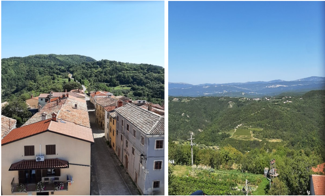
Slika 27. i 28. Pogled iz dragučskog zvonika na istočnu i sjevernu stranu.