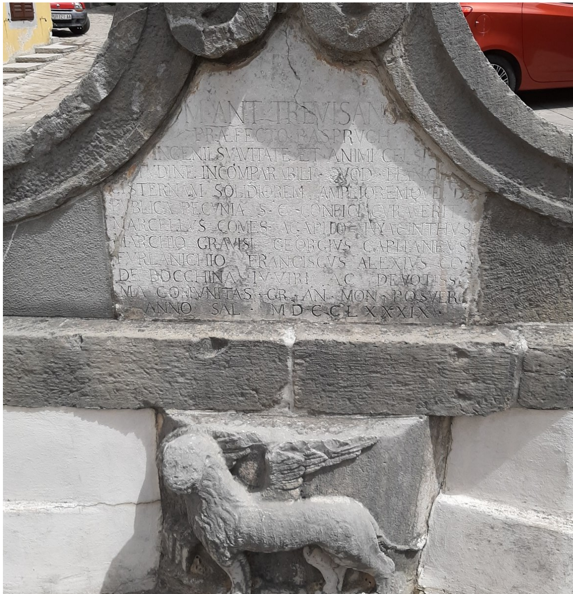
Slika 36. Vela šterna s natpisom završetka izgradnje šterne 1789. u vrijeme kapetana Marcantonija Trevisana (1787. – 1789.).