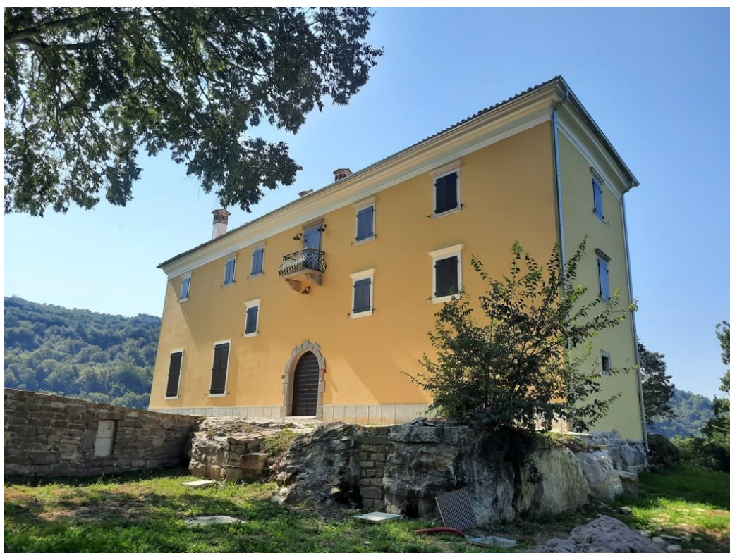
Slika 32. Kaštel u Račicama nekada u vlasništvu obitelji Walderstein.