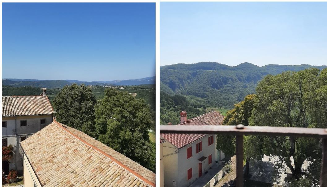
Slika 29. i 30. Pogled iz dragučskog zvonika na zapadnu i južnu stranu.