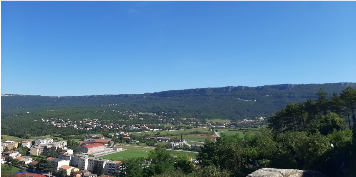
Slika 8. Pogled iz Staroga grada na zapad i planinski lanac Čićariju, odakle se mogao vidjeti napad uskoka na obližnja sela.