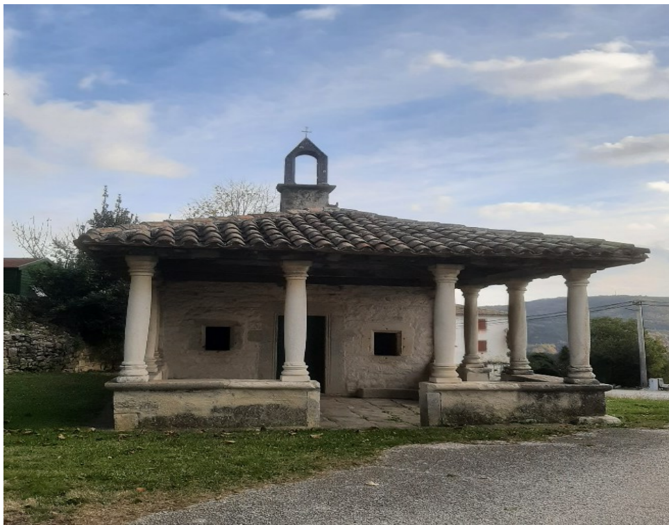
Slika 16. Crkvica Sv. Roka (izgrađena početkom XVI. stoljeća).