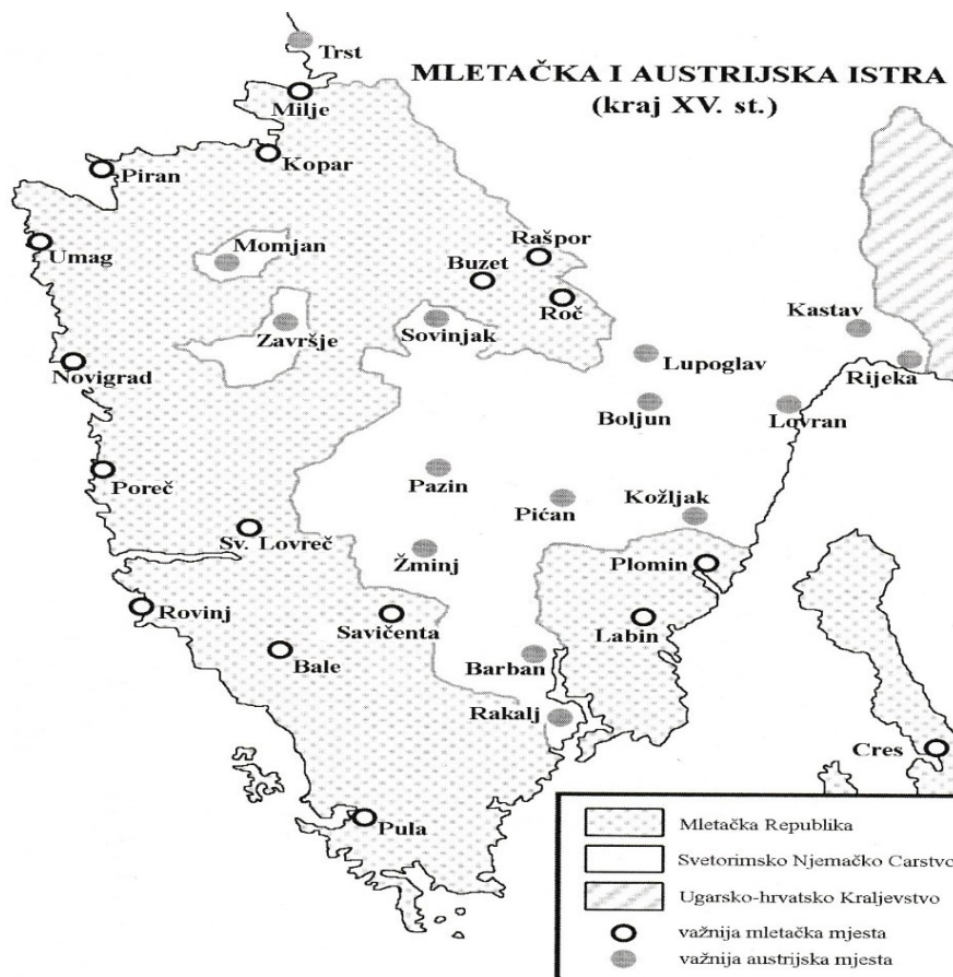
Slika 1. Mletačka i austrijska Istra krajem 15. stoljeća.

Nažalost, rat Cambraiske lige vodio se i na teritoriju Istre. Ratovanje u Istri bilo je gerilskoga tipa, gdje su sukobe vodili seljaci istog govornog jezika, etničke pripadnosti i tradicije. Jedina razlika između tih zaraćenih ljudi bila je bandiera (zastava): na jednoj je bio mletački lav svetog Marka, a na drugoj habsburški dvoglati orao. Seljaci koji su se borili pod mletačkom zastavom nazivali su se Benečani ili Markolini , a seljaci pod habsburškim zastavom nazivali su se Kraljevci ili Arciducali . 34