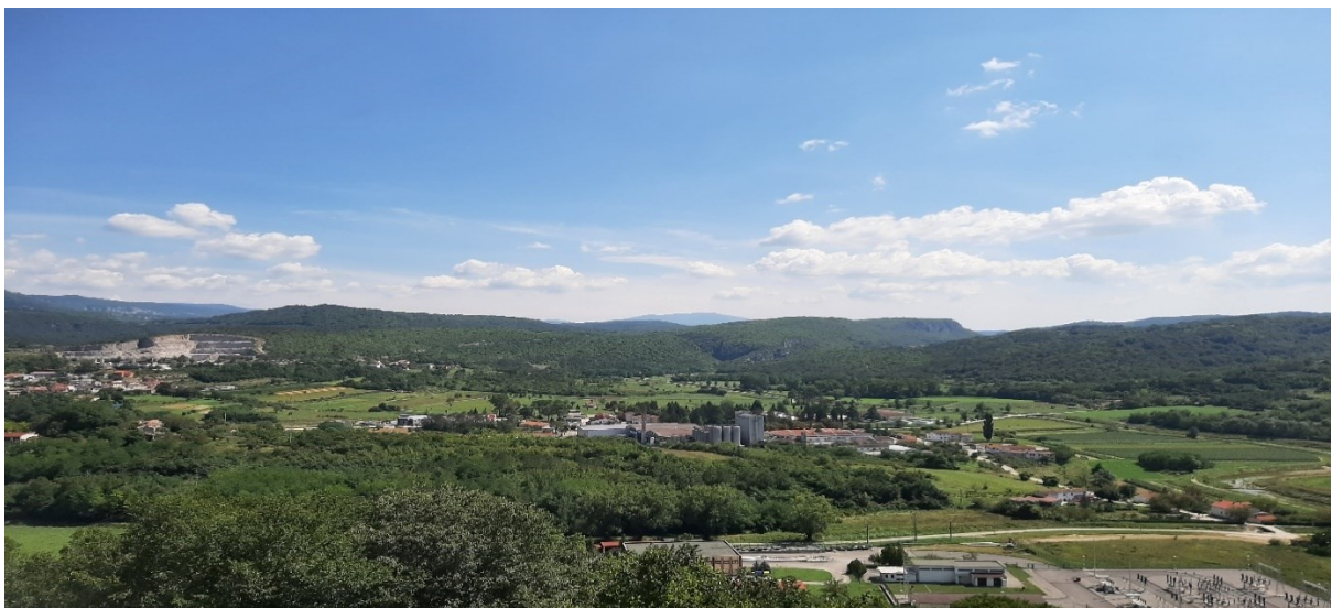
Slika 9. Pogled iz Staroga grada na istok, gdje teče rijeka Mirna.