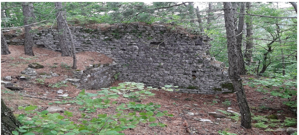
Slika 2. i 3. Ostaci utvrde Rašpor na Ćićariji.