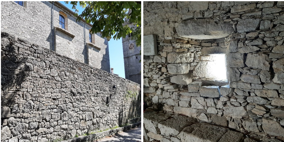
Slika 24. i 25. Humske zidine i otvor za pušku.

Napadi na kaštel Hum zabilježeni su još 1606., gdje je njegova okolica bila potpuno spaljena i pokradena. 88 Dana 11. travnja 1616. uskočkim naletima Hum biva opljačkan i spaljen. 89 Nakon završetka Uskočkog rata, Hum se obnavlja i polako se vraća život. Nažalost, zbog porušene infrastrukture i zaraslih njiva, glad je i dalje prisutna. 90