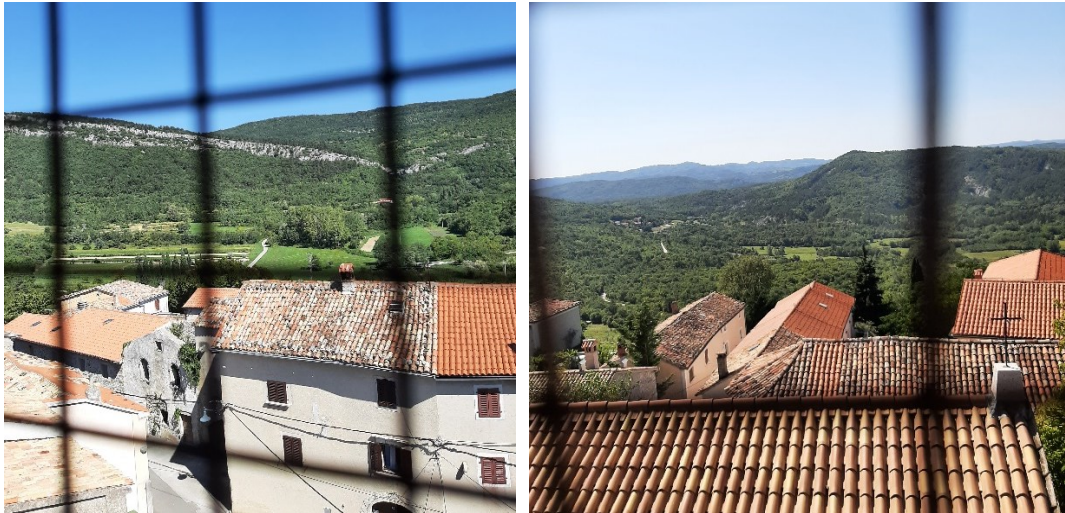
Slika 22. i 23. Pogled s ročnog zvonika na sjevernu i istočnu stranu.

Napadi na kaštel Hum zabilježeni su još 1606., gdje je njegova okolica bila potpuno spaljena i pokradena. 88 Dana 11. travnja 1616. uskočkim naletima Hum biva opljačkan i spaljen. 89 Nakon završetka Uskočkog rata, Hum se obnavlja i polako se vraća život. Nažalost, zbog porušene infrastrukture i zaraslih njiva, glad je i dalje prisutna. 90