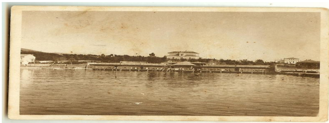
Slika br. 3 – Prvo kupalište u Selcu