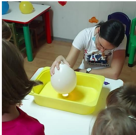
Slika 4. Pokus s balonom, vodom i svijećom ( https://djecjivrticmedenjak.hr/mjesečno-izvjesce-listopad-2021/ ).

Postupak: U jednu ravnu posudu postavi se svijeća te se upali. Jedan napuhani balon bez vode potrebno je pažljivo približiti svijeći. Toplina iz plamena svijeće, brzo zagrijava gumu balona, te balon puca. Drugi balon puni se vodom, te ga se približava pažljivo svijeći. Djeca mogu promatrati što se događa, te zajedno mogu raspraviti što se dogodilo. Na slici 4 prikazan je postupak izvođenja pokusa.