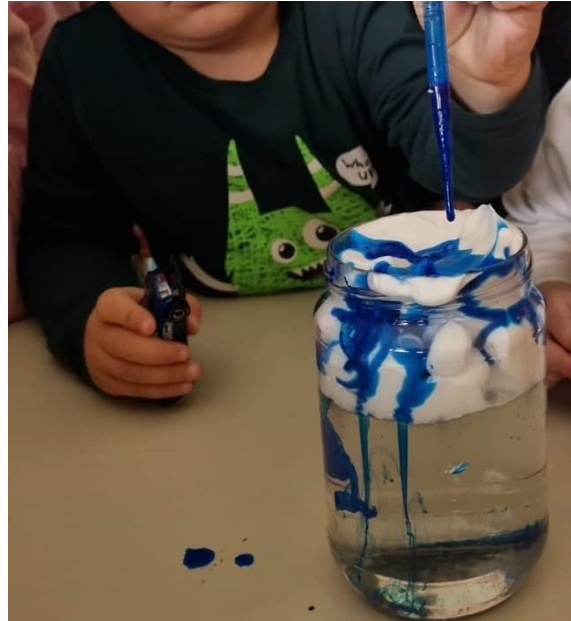
Slika 5. „Kako nastaje kiša?“ ( https://www.djecji-vrtici-sb.hr/wp-content/uploads/2023/12/FB_IMG_1702907865410.jpg , preuzeto 22.8.2024.).