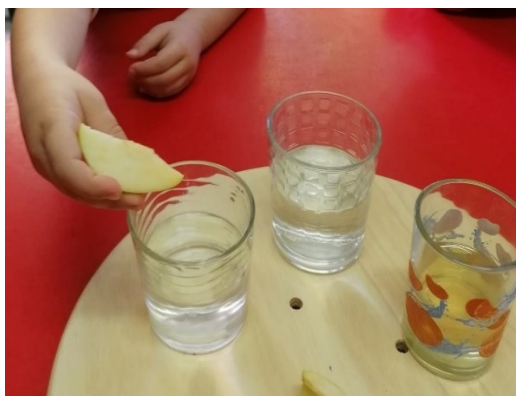
Slika 3. Pokus s jabukom ( https://djecjivrticmedenjak.hr/mjesecno-izvjesce-listopad-2021/ preuzeto 22.8.2024.).

Objašnjenje: Uzorak jabuke koji je bio izložen zraku brzo je potamnio zbog oksidacije. Oksidacija je kemijski proces pri kojem kisik reagira s atomima. Oksidacija je gubitak elektrona u elementu ili molekuli do koje dolazi pri kontaktu s kisikom iz okoline. Do toga dolazi zato jer se unutar jabuke nalazi enzim koji se naziva polifenoloksidaza (PPO) ili fenolaza. Smeđa boja koju jabuka poprima je rezultat pretvaranja fenola u melanin pri utjecaju kisika.