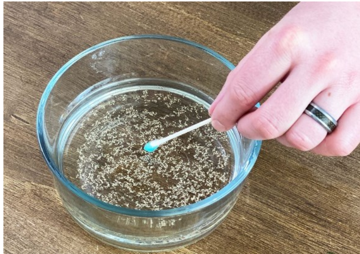
Slika 6. Raspršeni papar

deterdženta povezuju se s molekulama vode što razbija površinsku napetost (Crystal Chatterton, 2023). Na slici 6. prikazan je postupak izvođenja pokusa.