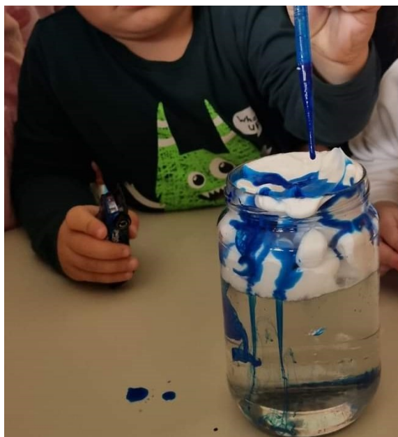
Slika 5. „Kako nastaje kiša?“ ( https://www.djecji-vrtici-sb.hr/wp-content/uploads/2023/12/FB_IMG_1702907865410.jpg , preuzeto 22.8.2024.).