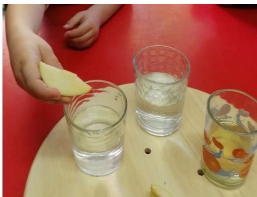
Slika 3. Pokus s jabukom.

Objašnjenje: Uzorak jabuke koji je bio izložen zraku brzo je potamnio zbog oksidacije. Oksidacija je kemijski proces pri kojem kisik reagira s atomima. Oksidacija je gubitak elektrona u elementu ili molekuli do koje dolazi pri kontaktu s kisikom iz okoline. Do toga dolazi zato jer se unutar jabuke nalazi enzim koji se naziva polifenoloksidaza (PPO) ili fenolaza. Smeđa boja koju jabuka poprima je rezultat pretvaranja fenola u melanin pri utjecaju kisika.