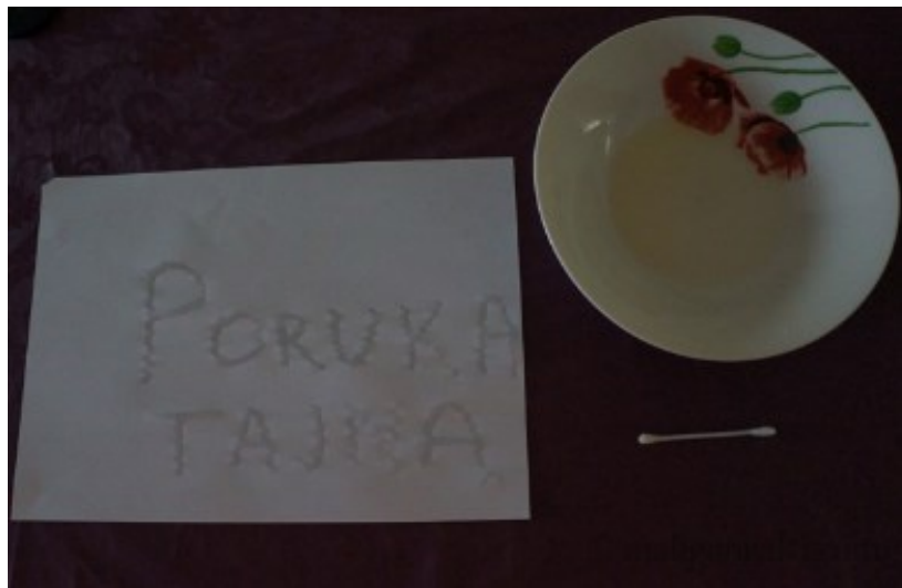
Slika 8. Pokus s nevidljivom tintom ( http://www.maligenijalci.com/nevidljiva-tinta-od-limunovog-soka/ ), preuzeto 22.8.2024.).

Objašnjenje: Limunov sok sadrži kiseline koje kemijski mijenjaju celulozu, glavni sastojak papira. Zbog toga papir koji dođe u kontakt s njim gori na nižim temperaturama nego inače, pa je toplina svijeće dovoljna da ga zagrije te da se prikaže napisana poruka. Na slici 8. prikazan je postupak izvođenja pokusa.