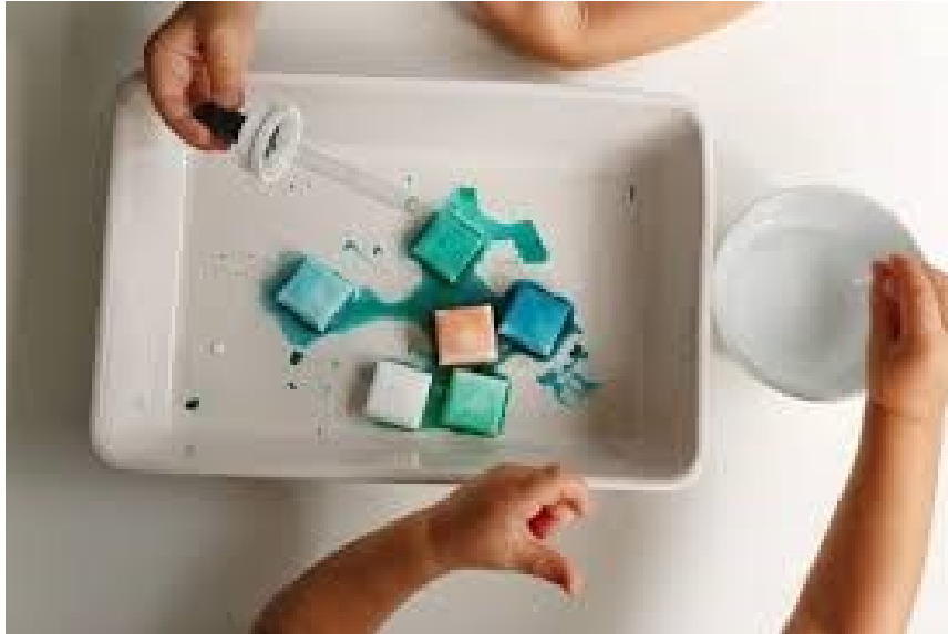
Slika 7. Pokus s pjenušavim kockicama leda

kockice leda mogu se staviti u pladanj ili na neku drugu vanjsku površinu gdje će se provoditi pokus. Pomoću pipete ili bočice sa štrcaljkom dodaje se ocat na ledene kockice. Na slici 7. prikazan je postupak izvođenja pokusa.