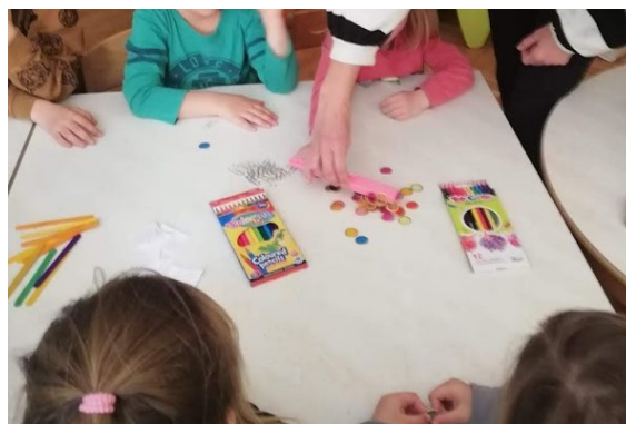
Slika 1. „Magnetična radionica“ u dječjem vrtiću

Nositelj projekta je Fizikalno društvo - Split, a voditeljica projekta bila je doc. dr. sc. Ivana Weber s odjela za fiziku Prirodoslovno-matematičkog fakulteta sa Sveučilišta u Splitu. Projekt RaSTEM osmišljen je kako bi promicao znanost, obrazovanje i odgoj u STEM području, s naglaskom na djecu i mlade, ali i širu populaciju. Projekt uključuje aktivnosti za sve dobne skupine, od vrtićke do studentske dobi, te njihove roditelje, skrbnike, odgojitelje, nastavnike. Projekt se realizirao u šest osnovnih aktivnosti, a jedna od njih je „RaSTEM u vrtiću“. Jedan od važnijih ciljeva projekta je postavljanje kvalitetnog temelja na kojem bi se gradila daljnja suradnja stručnjaka, znanstvenika, sveučilišnih nastavnika s odgojiteljima i učiteljima osnovnih i srednjih škola. U vrtiću su se odvijale aktivnosti na teme magnetizma (kao što je prikazano na slici 1), optike, astronomskih promatranja, širenja znanja o Sunčevom sustavu. Birane su aktivnosti koje će kod djece pobuditi maštu, kreativnost, izazvati ugodnu reakciju te želju za daljnjim istraživanjem. Nekoliko radionica održano je na Prirodoslovno-matematičkom fakultetu u Splitu.