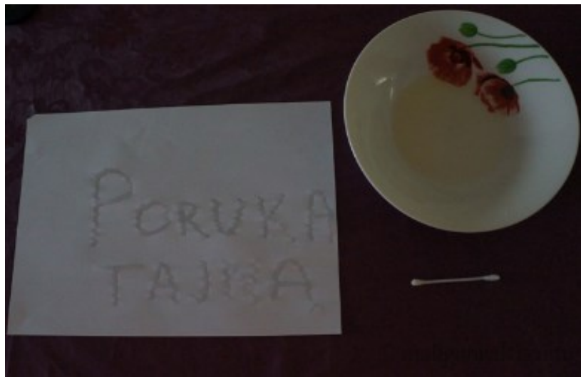
Slika 8. Pokus s nevidljivom tintom ( http://www.maligenijalci.com/nevidljiva-tinta-od-limunovog-soka/ ), preuzeto 22.8.2024.).

Objašnjenje: Limunov sok sadrži kiseline koje kemijski mijenjaju celulozu, glavni sastojak papira. Zbog toga papir koji dođe u kontakt s njim gori na nižim temperaturama nego inače, pa je toplina svijeće dovoljna da ga zagrije te da se prikaže napisana poruka. Na slici 8. prikazan je postupak izvođenja pokusa.