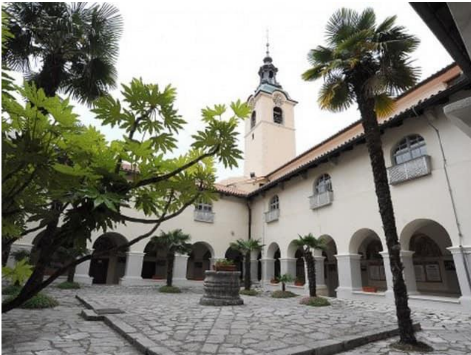
Slika 11: Svetište Majke Božje Trsatske