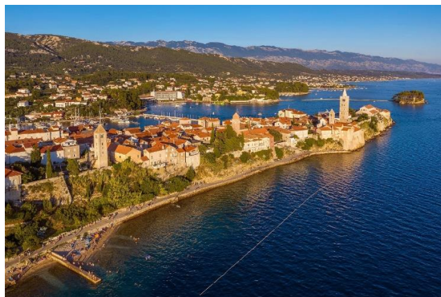
Slika 4: Otok Rab