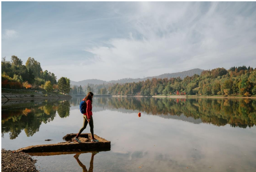
Slika 2: Jezero Bajer