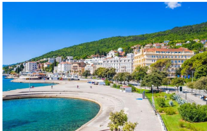
Slika 3: Opatija Rivijera