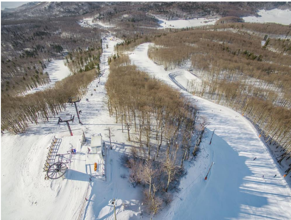
Slika 7: Platak