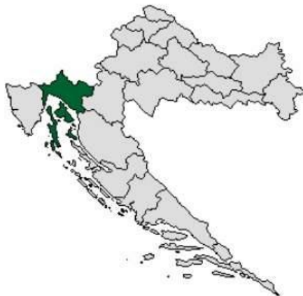
Slika 1: Položaj Primorsko-goranske županije