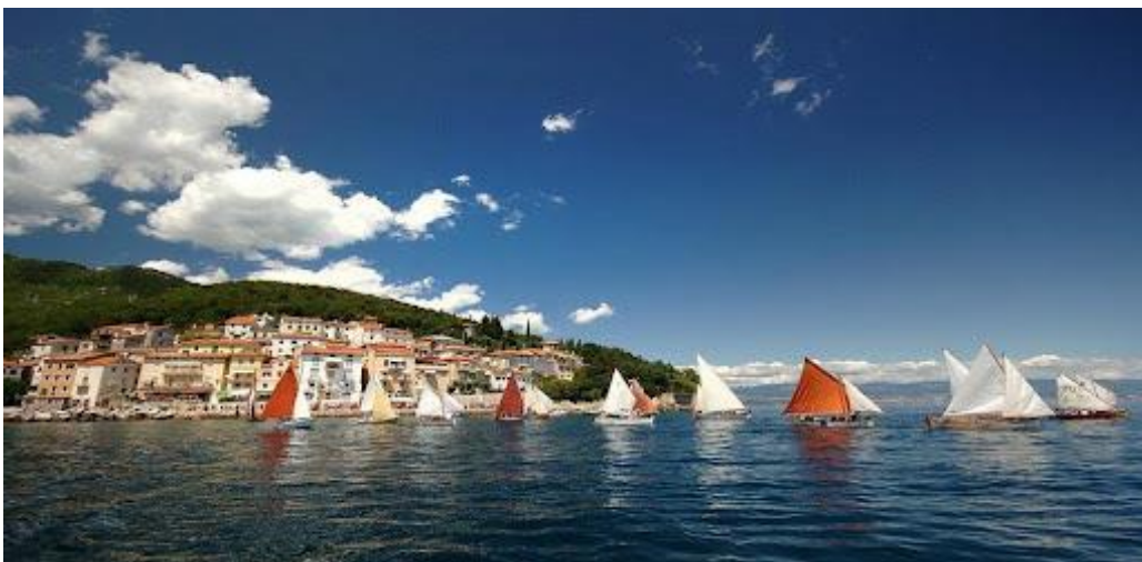
Slika 9: Smotra i regata tradicijskih barki na jedra – Mošćenička Draga