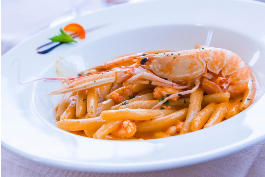
Slika 10: Kvarnerski škampi