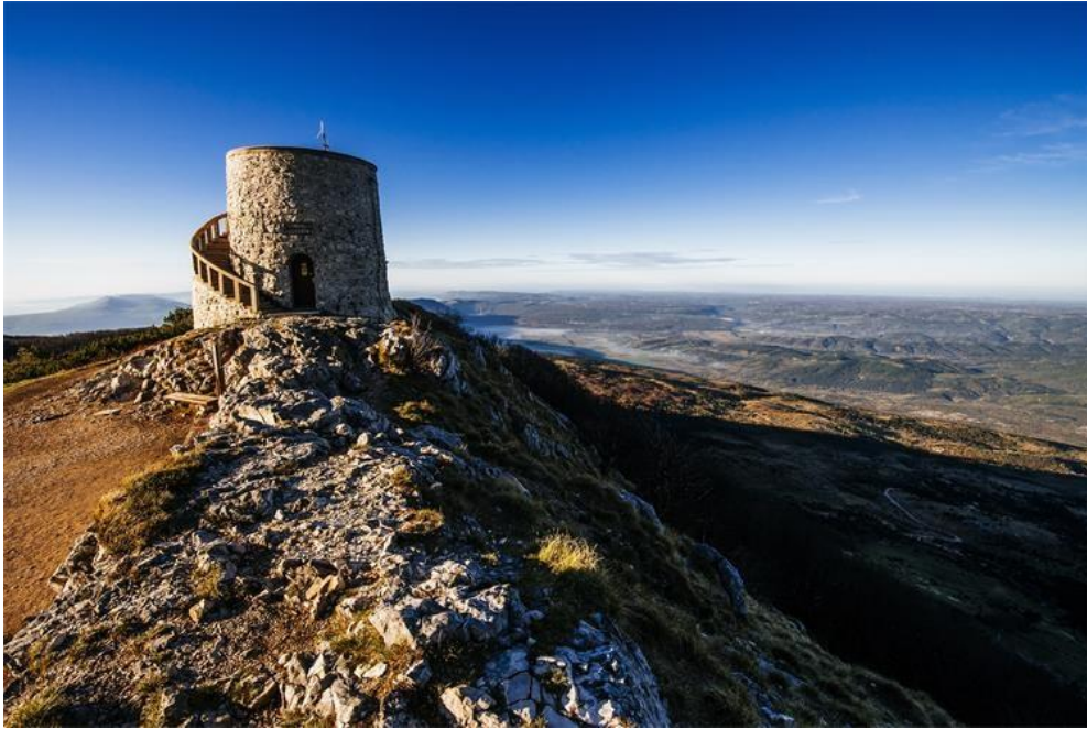
Slika 6: Park prirode Učka