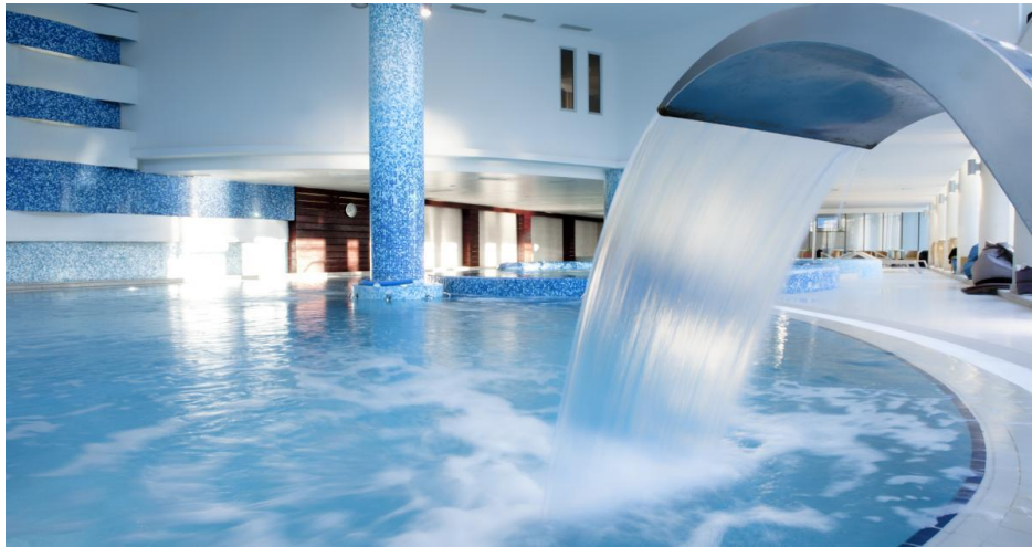
Slika 8: Thalassoterapia Opatija