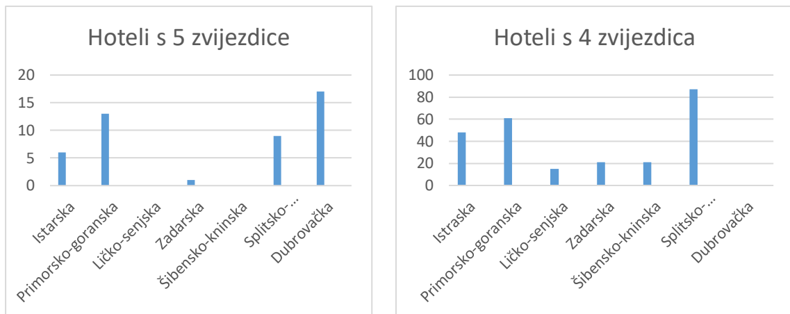
Grafikon 1. Zastupljenost hotela sa 4 i 5 zvjezdica u primorskim županijama 2021. godine.