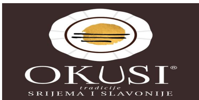
Slika 3. Simbol projekta "Okusi Srijema i Slavonije"