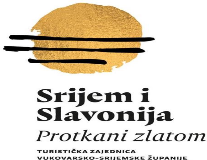
Slika 4. Logo Turističke zajednice Vukovarsko - srijemske županije