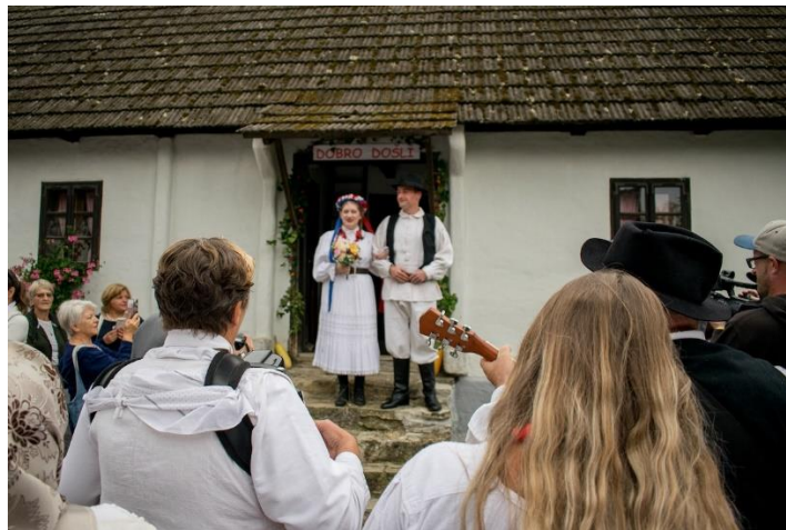
Slika 10. Zagorska svadba Kumrovec

Kulturno-turistička manifestacija „Zagorska svadba“ započela je 1981. s ciljem očuvanja i predstavljanja tradicionalnih svadbenih običaja i folklorne baštine Hrvatskog zagorja. Sama svadbena ceremonija odvija se prema starinskim običajima koji uključuju prošnju mladenke, zaruke, mačkure, jutarnjicu te svadbenu slavlje uz tradicionalna zagorska jela. 57 Glavna svrha manifestacije je podizanje svijesti o važnosti očuvanja kulturne i povijesne baštine, kao i poticanje pojedinaca i udruga na istraživanje te oživljavanje lokalnih narodnih običaja. Svake godine bilježi se sve veći interes posjetitelja, koji kroz manifestaciju imaju priliku svjedočiti i doživjeti stare, već pomalo zaboravljene svadbene običaje.