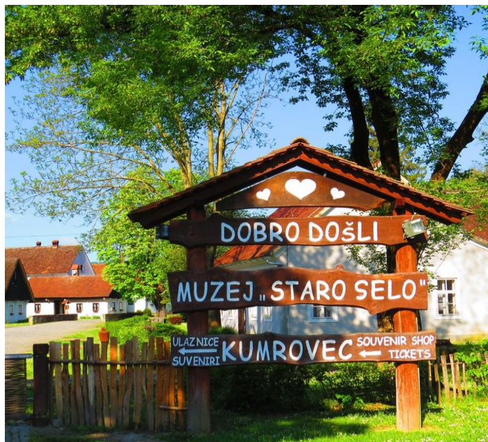
Slika 6. Muzej Staro selo Kumrovec

Kada se govori o razvoju Muzeja Staro selo tada se govori o davnoj 1947., kada su narodi iz svih bivših krajeva Jugoslavije htjeli posjetiti Kumrovec radi razgledavanja rodne kuće Josipa Broza Tita. U to vrijeme predstavila se ideja da se jezgra Kumrovca obuhvati mjerama spomeničke zaštite te je te godine Urbanistički institut NR Hrvatske izradio osebujan plan prostora i u tu je svrhu prof. Marijana Gušić, koja je tada bila direktorica Etnografskog muzeja u Zagrebu, napisala studiju o Kumrovcu. 47 Tada se mogao primijetiti nagli razvoj Kumrovca.