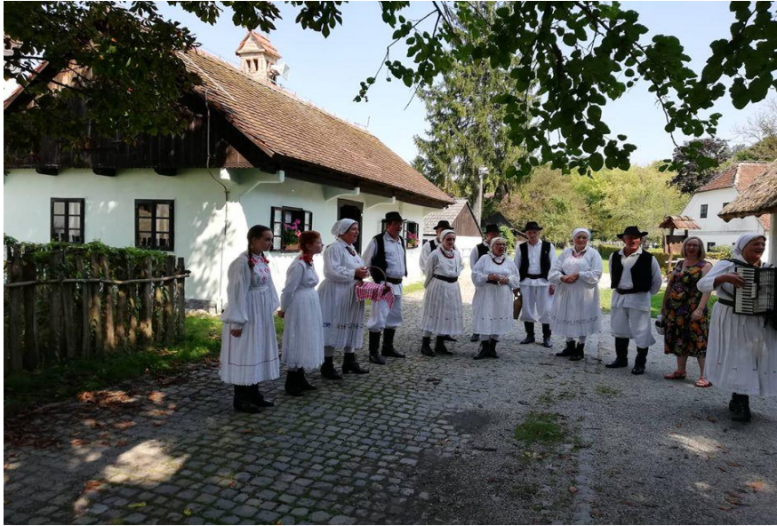
Slika 13. Etno udruga Zipka