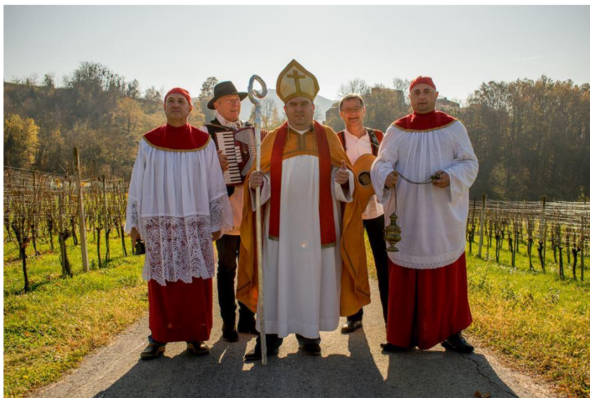
Slika 8. Martinje v Kumrovcu

kao simboličan dio programa. Organizatori događanja su Turistička zajednica područja Kumrovec, Desinić, Zagorska Sela te Udruga Grozd Kumrovec.