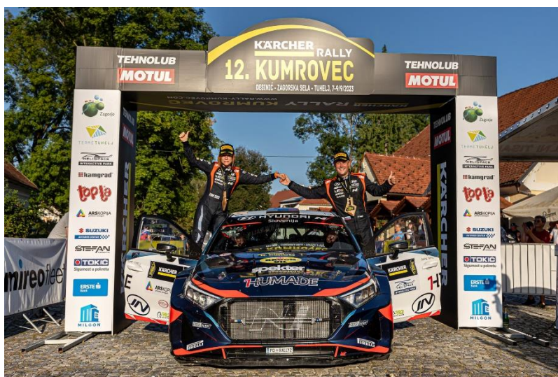
Slika 12. „Rally Kumrovec“

Kroz natjecanja koja se održavaju na zahtjevnim i slikovitim stazama, manifestacija omogućuje posjetiteljima da dožive jedinstvene pejzaže Hrvatskog zagorja. S obzirom na sve veći broj gledatelja i sudionika, rally pridonosi povećanju turističke posjećenosti te potiče lokalni sektor ugostiteljstva i usluga. Jedan od ključnih elemenata turističkog značaja Rallyja Kumrovec jest njegova sposobnost da privuče značajan broj posjetitelja koji dolaze ne samo zbog sportskih natjecanja, već i zbog prilike da istraže kulturne i povijesne atrakcije ovog područja.