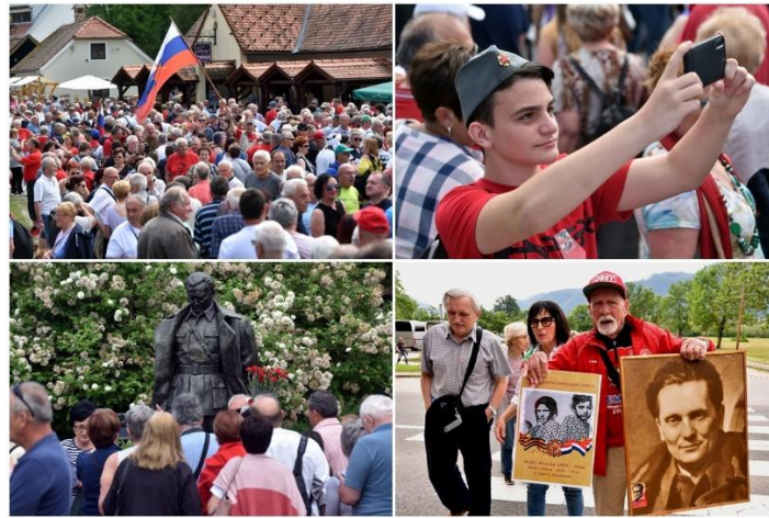
Slika 9. Dan mladosti – radosti Kumrovec

Iako Dan mladosti nije dio službenog kalendara praznika u modernoj Hrvatskoj, i dalje se neslužbeno obilježava u Kumrovcu.