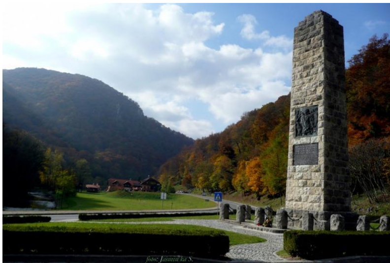
Slika 4. Spomenik hrvatskoj himni

Na ulasku u Općinu Kumrovec, na cesti pravca Kumrovec-Klanjec, nalazi se spomenik hrvatskoj himni pod nazivom Lijepa naša, jedan od najznačajnijih spomenika u Hrvatskom zagorju. 44 Spomenik je smješten u zaštićenom krajoliku koji se zove Zelenjak i koji je okružen zelenilom i šumama klanca rijeke Sutle, poznatim ruševinama Cesargrada te kapelom Majke Božje Risvičke. Spomenik je visok 13,2 metara i na njega je uzidana spomen ploča s početnim stihovima himne.