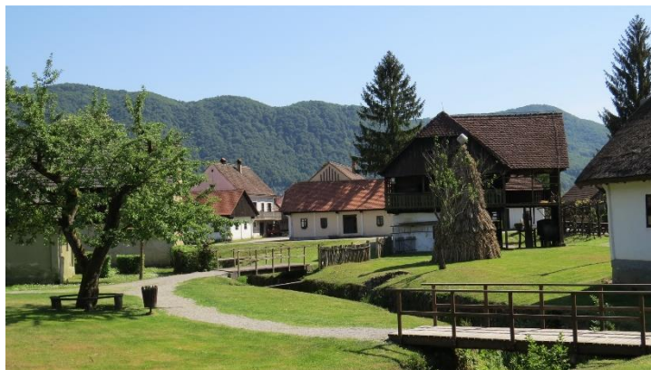
Slika 7. Muzej „Staro selo“ Kumrovec

zaposlene da se obrate Ministarstvu prosvjete i kulture Republike Hrvatske, s prijedlogom za razrješenje statusa Starog sela, njegovog daljeg rada i razvoja. Na održanoj sjednici Muzejskog savjeta 9. listopada 1990., članovi su Savjeta jednoglasno odlučili da se muzejski kompleks zajedno s obližnjom kurijom Erdödy izdvoji iz Spomen – parka Kumrovec kao samostalna muzejska jedinica te da se njezino financiranje odvija na republičkoj razini. Vlada Republike Hrvatske nekoliko mjeseci kasnije donijela je odluku o financiranju Starog sela i kurije Erdödy.