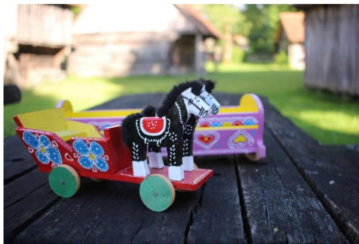
Slika 2. Umijeće izrade tradicijskih drvenih igračaka