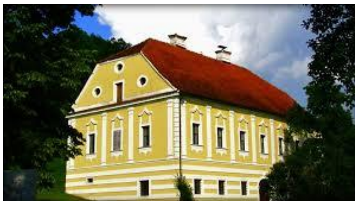
Slika 5. Kurija Erdödy u Razvoru

Na padini ispod Razvora smještena je kurija obitelji Erdödy, izgrađena oko 1780. u stilu kasnog baroka. Ova plemićka obitelj, osim svojih posjeda u Varaždinu, posjedovala je i Novi Dvor Klanječki, kao i ovaj manji dvorac - kuriju. U prizemlju kurije nalazila se prostrana kuhinja s krušnom peći i prostorom za pripremu hrane, dok je u stražnjem dijelu bio vinski podrum s bačvastim svodom. Drvene stubbe vodile su na kat, gdje se iz prostranog hodnika ulazilo u dječje sobe. Kroz masivna dvokrilna vrata dolazilo se u središnju sobu, dok su manji saloni s obje strane služili za blagovanje i odmor. Danas je kurija obnovljena i preuređena u Vilu Mlinarić. 45 U ovoj kuriji svoje najranije djetinjstvo provela je grofica Sidonija Erdödy Rubido, najistaknutija pjevačica svog vremena u 19. stoljeću. Sidonija je bila poznata kao prva hrvatska operna primadona i gorljiva pristaša Ilirskog preporoda. Posebice je značajna jer je prva javno izvodila pjesme na hrvatskom jeziku, uključujući „Još Hrvatska ni propala“ i ariju Ljubice iz prve hrvatske opere „Ljubav i zloba“.