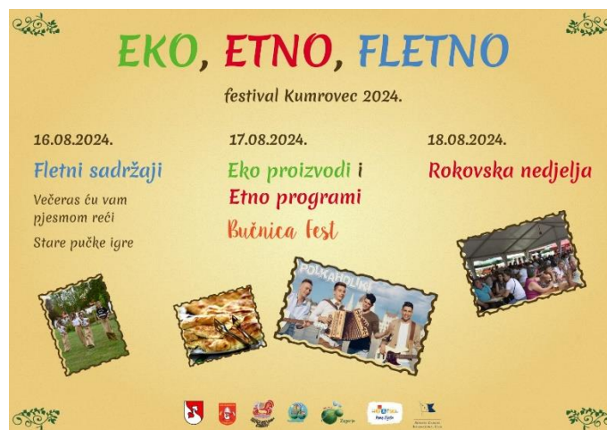
Slika 11. „Eko, etno, fletno Kumrovec“