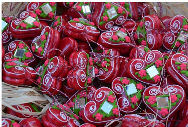
Slika 3. Licitarska srca

vijenci, konji i gljive. Često su omiljen ukras za božićnu jelku, a neki se čak i darivaju bližnjima za vrijeme posebnih prigoda. Osim Kumrovca, Marija Bistrica je jedno od glavnih lokaliteta gdje se može posjetiti etno-zbirka licitarskog obrta u kojoj turisti mogu vidjeti povijest izrade licitara te se upoznati s alatima koji su se koristili, kao i rječnikom i tehnikama.