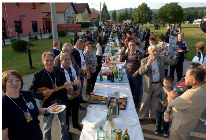
Slika 15. Najduži stol u Velikoj

Oko stola postavljeni su štandovi i kućice koje predstavljaju obiteljska poljoprivredna gospodarstva, vinare i proizvođače domaćih proizvoda. Svaki izlagač nudi degustaciju svojih proizvoda i objašnjava proces proizvodnje, a događaj je često popraćen bogatim kulturno-zabavnim programom, uključujući folklorne nastupe, glazbu uživo i druge prigodne sadržaje. „Najduži stol u Hrvata“ postao je pravi sinonim za slavonsku gostoljubivost i dobru zabavu, privlačeći veliki broj posjetitelja i sudionika svake godine. 59