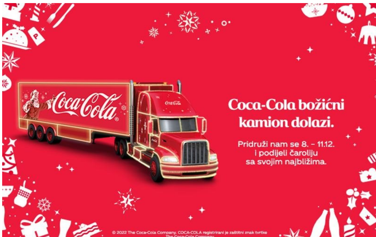
Slika 2. Coca-Cola božićni kamion

Kroz IMK, Coca-Cola je uskladila svoje aktivnosti tako da događaj na svakom stajalištu turneje privuče tisuće posjetitelja, dok su online kampanje dodatno pojačale doseg i angažman. Ovaj primjer pokazuje kako događaj koristi IMK kako bi se predstavio široj publici i stvorio dugotrajnu vezu s potrošačima. Na slici 2. prikazano je kako se različiti komunikacijski kanali koriste za promociju, oglašavanje i pozivanje ljudi da se pridruže dolasku Coca-Cola kamiona.