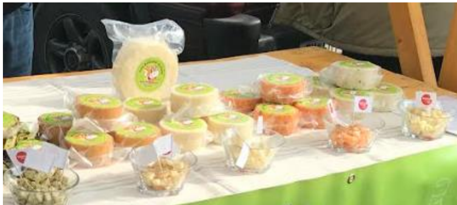
Slika 31. Domaći mliječni proizvodi