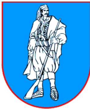
Slika 4. Zastava Općine Bebrine