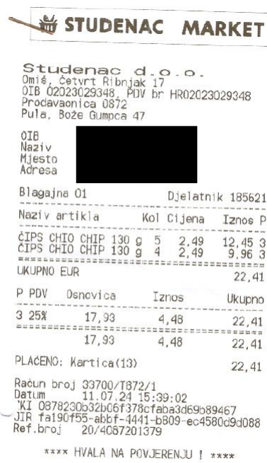
Slika 4. Račun dobavljača za grickalice priznate kao trošak reprezentacije