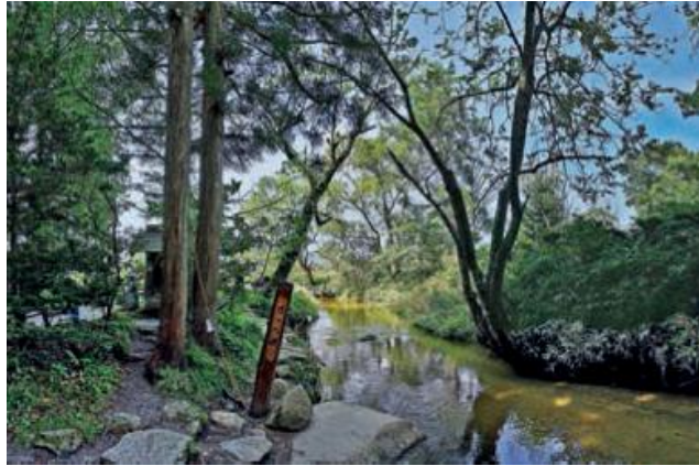
Slika 9 prikaz rijeke iza hrama Jogen-ji koji je navodno bio kappin dom