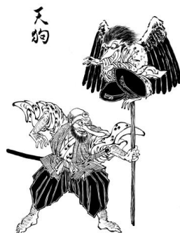
Slika 7 prikaz daitengu i kotengu

Gledajući tengu iz perspektive reinkarniranih zlih svećenika ili redovnika koji odstupaju od budističkih principa, može se reći, kako Foster (2015: 133) navodi, da „istovremeno, možemo zamisliti kako bi tengu mogli postati snažni simboli autsajdera, predstavljajući pobunjenički, anti-autoritativni duh“. U tom kontekstu, autor sugerira, tengu prikazuju sve one koji se suprotstavljaju uvriježenim normama i autoritetima te upravo taj njihov anti-autoritativni duh prikazuje zašto im se pripisuju tajne borilačke vještine. Drugim riječima, kroz borilačke vještine tengu simboliziraju moć i samodostatnost onih koji odbijaju slijediti tradicionalne putove, u ovom slučaju principe budizma, i preferiraju vlastite koji su često obilježeni skrivenim metodama. Navedeno se pronalazi u priči o tengu i velikom ratniku japanske povijesti Minamoto no Yoshitsune. Autor objašnjava da je Yoshitsune bio mlađi brat Minamoto no Yoritomoa, vođe Genji snaga koje su pobijedile u Genpei ratu (1180.–1185.), velikog građanskog sukoba koji je doveo do osnivanja vlade Kamakure. Nadalje, Yoshitsune kao Genji general bio je poznat po svojim vojnim vještinama kojeg su ga tengui naučili dok je kao dijete živio u hramu Kurama (današnjem Kyotu). Ranije spomenuti odnos između tengu i Yoshitsune pronalazi se u priči u kojoj Foster (2015:134) navodi: