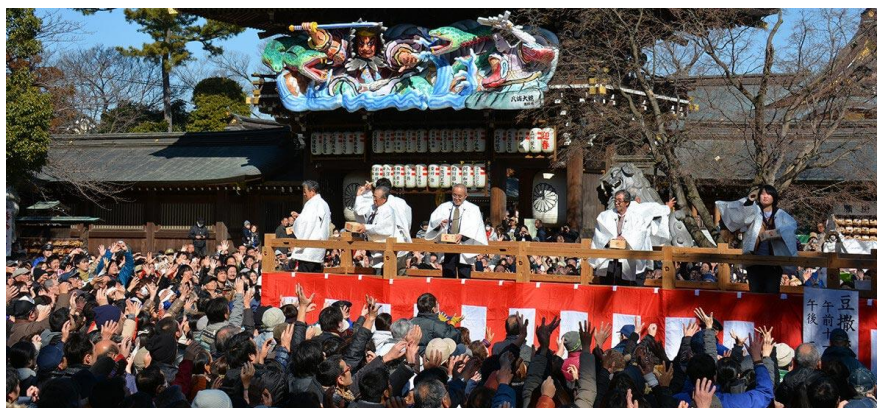
Slika 4 Setsubun

Tokuda (2018: 5) tvrdi da su se oniji u setsubunu počeli pojavljivati tijekom razdoblja Muromachi (1336.–1573. g.). U to vrijeme počeo se izvoditi obred pročišćenja koji odražava šintoistički koncept ritualnog pročišćavanja te koji se povezuje s ranije objašnjenim Tsuina ritualom, a uključuje protjerivanje zlih duhova, odnosno onija , i sprječavanje zla za nadolazeću godinu. Foster (2015: 125) pojašnjava kako se kroz običaj bacanja graha oko kuće ili kroz prozor uz uzvik „drži zle duhove vani, unesi sreću unutra!“ (jap. Oni wa soto, fuku wa uchi! , 鬼は外、福は内!) prikazuje simbolično pročišćavanje zla, dok se priroda ponovno budi. Primjer toga, može se vidjeti u hramu Rozan smještenog u Kyotu gdje autor pojašnjava da se izvodi slična ritualna prezentacija u kojoj oniji raznih boja izvode ples zastrašivanja te na kraju odlaze poraženi. Nakon onijevog odlaska, svećenici hrama bacaju grah posjetiteljima.