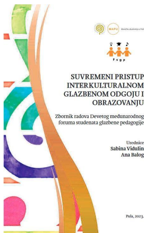
Prilog 1. Naslovnica zbornika Suvremeni pristup interkulturalnom glazbenom odgoju i obrazovanju .

Ovomu završnom radu prethodio je članak Metodički postupci obrade hrvatskih i tradicijskih pjesama na nastavi Glazbene kulture objavljen u zborniku radova studenata Suvremeni pristup interkulturalnom glazbenom odgoju i obrazovanju koji su uredile Sabina Vidulin i Ana Balog, a koji je izdalo Sveučilište Jurja Dobrile u Puli 2023. godine. Taj je objavljeni rad recenziralo dvoje stručnjaka. Tijekom oblikovanja i pisanja rada autorica se bavila problematikom kako glazbu približiti učenicima, a u procesu izrade rada bilo je potrebno produbiti znanje o samoj metodici i njezinim pravcima poučavanja, što je dovelo do proučavanja novih informacija povezanih s tim područjem. Također, kreativno je razmišljanje bilo ključno tijekom cijeloga procesa jer je iznimno važno učenicima prikazati određeno gradivo na njima što zanimljiviji način, uz naglasak na edukativni ishod. Osim samoga istraživačkog procesa, koji uključuje prikupljanje glazbenih i izvanglazbenih znanja, unaprijeđena je i kompetencija izlaganja i diskutiranja o temi s kolegama studentima i njihovim mentorima na stranome jeziku.