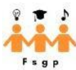
Slika 1. Logotip Foruma studenata

Činjenicu da su Forum studenti izuzetno dobro prihvatili potvrđuje i Himna studenata nastala u doba pandemije uzrokovane bolešću COVID-19 kada je sve bilo izazovnije, no studenti su zajedničkim snagama osmislili i snimili videospot u kojemu su i sami sudjelovali te u kojemu su prikazane neke od ljepota i posebnosti Pule. Između ostaloga, Forum studenata ima i svoj logotip ( Slika 1. ).