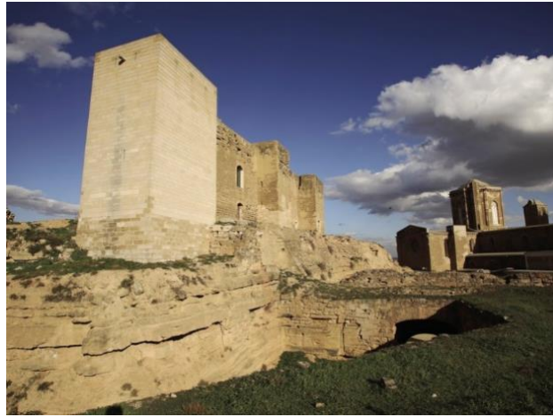
Slika 7. „La Seu Vella“

ružičastu boju. Unutra se nalazi muzej u kojemu se može naučiti o prošlosti i umjetnosti katedrale. 15