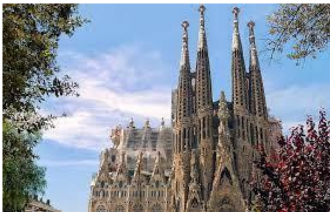
Slika 3. Sagrada Familia