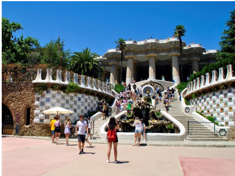
Slika 5. Park Güell

baštinu kojom će se ovaj rad baviti, a koja je također jedna nezaobilazna atrakcija jest Park Güell. Može se reći kako je ovaj park harmonija prirode i arhitekture. Ovaj park je prvotno trebao postati elitno naselje za imućnije obitelji Barcelone. Imao je dobru obrambenu poziciju s lijepim pogledom na more te na samu Barcelonu. Izgradnja je počela 1900. godine i trajala je sve do 1914. kada se morala zaustaviti zbog toga što nije bilo dovoljno kupaca za parcele. Od planiranih 40 kuća, izgrađene su samo dvije kuće. U jednoj kući je živio Eusebi Güell, čovjek koji je i došao na ideju da se izgradi stambeno naselje, a u drugoj je živio Antoni Gaudí, arhitekt. Danas je Gaudíjeva kuća pretvorena u muzej koji je posvećen njegovom radu i životu. 12 Park je proglašen UNESCO-om svjetskom baštinom te prema službenim stranicama parka, 2021. je ovaj park posjetilo oko 1.5 milijuna turista.