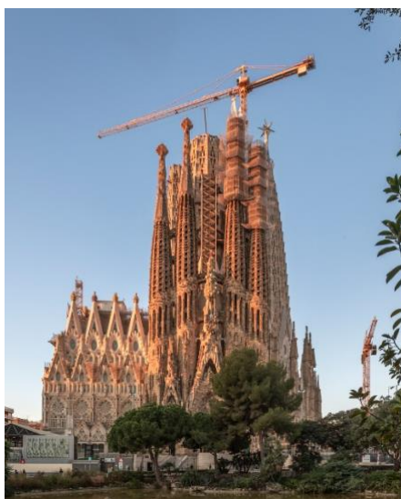
Slika 4. Bazilika La Sagrada Familia

La Sagrada Familia, bazilika čija je gradnja započela 1882. godine traje još i danas. Predviđa se da bi njena gradnja trebala završiti 2026. godine. Baziliku je dizajnirao Francisco de Paula del Villar, a 1883. Antoni Gaudi, poznati španjolski arhitekt preuzima ovaj projekt te mu se posvećuje sve do svoje smrti. Kroz godine, bazilika je promijenila mnogo arhitekata, proživjela vandalizam 1936. godine tijekom španjolskog građanskog rata, no njena izgradnja se ipak bliži kraju. Poznata je po svojim vitrajima, tornjevima, skulpturama te iznimno detaljnim fasadama. 11 Može se reći da ova bazilika predstavlja arhitekturu, umjetnost i kulturu Barcelone te je radi toga proglašena UNESCO-vo svjetskom baštinom. Prema podacima sa službene stranice La Sagrada Familia, ovu je baziliku u 2022. godini posjetilo sveukupno 3,781,845 turista. Treba se uzeti u obzir da je to godina kada je i dalje bila aktualna pandemija COVID-19 te su brojke i više nego odlične.