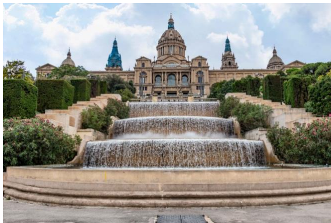
Slika 11. Muzej Nacionalne umjetnosti

Muzej Nacionalne umjetnosti Katalonije, smješten u impresivnom Palau Nacional na Montjuïcu u Barceloni, predstavlja ključnu instituciju za katalonsku umjetnost. Njegove zbirke obuhvaćaju slike, skulpture, crteže, tapiserije i numizmatiku te pružaju pregled katalonske umjetnosti od srednjovjekovlja do modernog doba. Muzej Nacionalne umjetnosti Katalonije privlači brojne turiste zbog svoje bogate zbirke koja nudi sveobuhvatan uvid u katalonsku umjetnost kroz stoljeća. Njegova lokacija na Montjuïcu također pruža posjetiteljima spektakularan pogled na Barcelonu, što dodatno doprinosi njegovoj atraktivnosti kao turističke destinacije. Muzej je nezaobilazna postaja za ljubitelje umjetnosti i kulture koji žele upoznati bogatu povijest i kulturnu baštinu Katalonije.