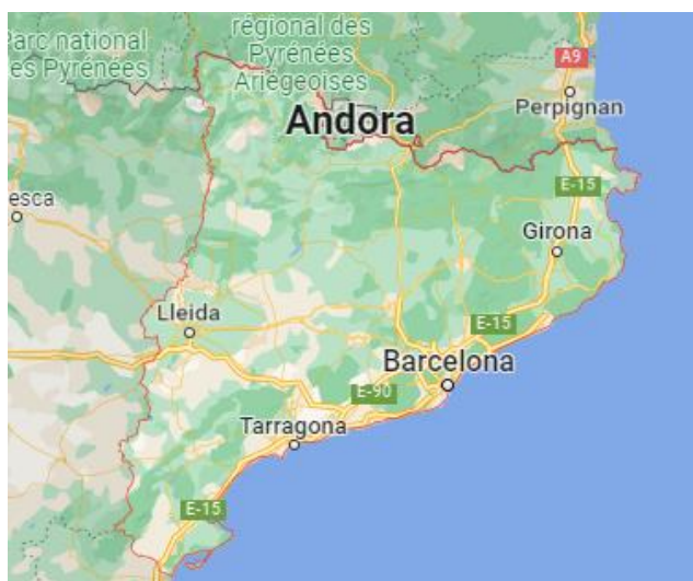
Slika 1. Položaj Katalonije na karti

Katalonija je smještena na sjeveroistočnom dijelu Španjolske. Graniči s Androm i Francuskom na sjeveru od koje je dijeli planinski lanac Pireneji, a na jugu graniči s drugom Španjolskom zajednicom, Valencijom. Na istoku graniči sa Sredozemnim morem, a na zapadu s Aragonijom.