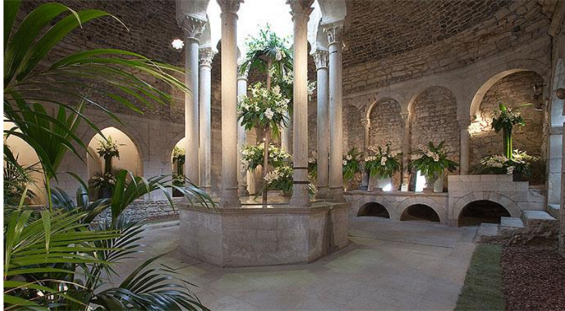
Slika 6. „BanysArabs“

„BanysArabs“ u prijevodu Arapske kupke koje datiraju još iz 12. stoljeća. To su bile javne kupke. Ove kupke za grad Gironu predstavljaju veliku važnost iz razloga što se na taj način pokazuje multikulturalna prošlost grada te kakav je utjecaj islamska kultura imala u ovome gradu. U današnje vrijeme ove kupke su izgubile svoju prvotnu svrhu koje je bila kupanje no i dalje je moguće istraživati i razgledavati prostorije. 13