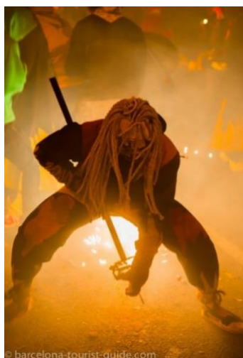
Slika 9. „Vrag „ koji priprema vatreno oružje

Festival se sastoji od nekoliko događaja. Jedan od najpoznatijih je „Correfoc“, događaj kojeg izvodi grupa ljudi obučeni u kostime vragova. Izvodi se u kasnim noćnim satima po ulicama, a sudionici, poznati kao „vragovi“, gađaju promatrače iskrama vatre, stvarajući spektakularnu i uzbuđljivu atmosferu. Ovaj događaj posebno privlači turiste zbog svoje jedinstvenosti i uzbuđljivog karaktera te predstavlja značajan element kulturne ponude Barcelone.