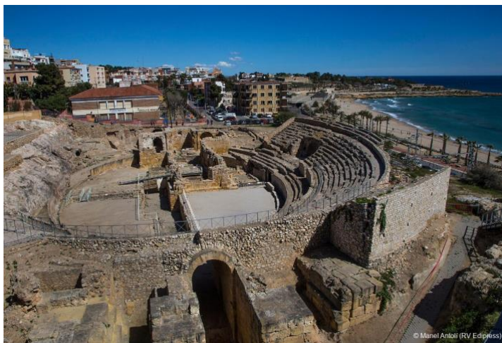
Slika 8. Amfiteatar u Tarragoni