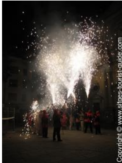
Slika 10. Festival Sv. Ivana

veseljem. Osim što se u Barceloni slavi s vatrometima i logorskim vatrom, mnogi turisti i mještani obilježavaju ovaj dan kupanjem u moru u kasnim noćnim satima, što dodatno obogaćuje turističku ponudu i privlači posjetitelje iz cijelog svijeta.