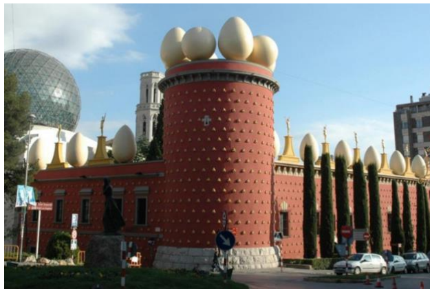
Slika 12. Dali Theatre-Museum

Nedaleko od Barcelone, u Figueresu, nalazi se Dali Theatre-Museum. Ovaj jedinstveni muzej nije samo dom za najveću zbirku radova Salvadora Dalija, već i ekstravagantnu arhitekturu koju je sam umjetnik dizajnirao. Dali Theatre-Museum je jedna od najpopularnijih turističkih atrakcija u Kataloniji. Njegova jedinstvena kombinacija umjetničkih djela i neobične arhitekture privlači posjetitelje iz cijelog svijeta. Muzej omogućuje turistima dublje razumijevanje Dalijeve umjetnosti i stila te doprinosi promociji Figueresa kao kulturne destinacije.