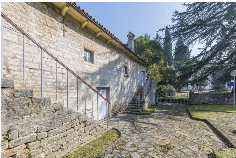
Slika 12. Vila Pava

luke, a njezina posebnost su dva vanjska stubišta koja vode izravno iz dvorišta u prostorije na katu. 62