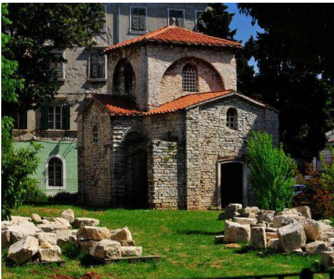
Slika 6. Bazilika svete Marije Formose