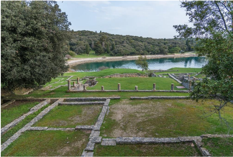
Slika 15. Rimska vila u uvali Verige

Ova vila pripada i Ruti rimskih careva koja je certificirana od strane Vijeća Europe i Europskog Instituta kulturnih ruta. 64