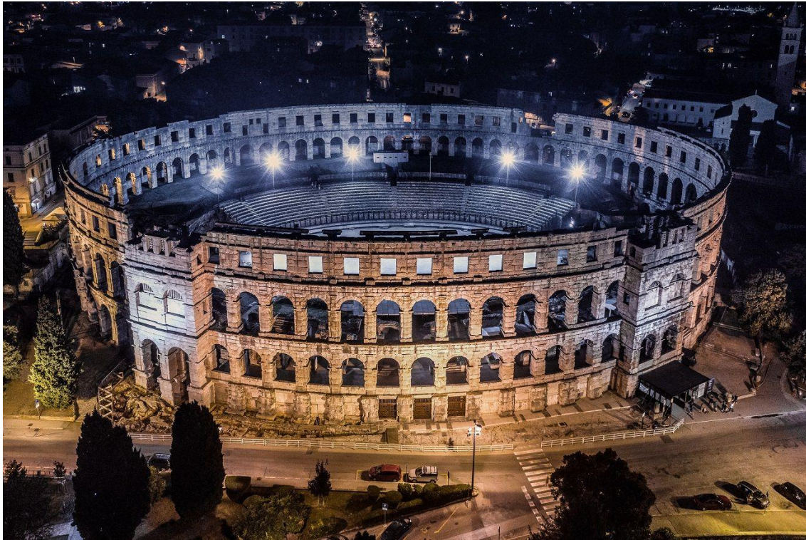
Slika 2. Rimski amfiteatar u Puli (Pula Info, (2024) Dostupno na: https://www.pulainfo.hr/where/arena-amphitheater/ (07.05.2024.))

Središnji trg potječe iz doba antike i predstavlja rimski forum. Nalazi se na zapadnom dijelu grada. i Oko trga smještene su najvažnije građevine vjerske, upravne i sudske namjene. U prošlosti su se na Forumu mogla pronaći tri hrama: hram Kaptolinske trijade, hram božice Rome i hram božice Dijane. Tijekom srednjeg vijeka Forum je nastavio biti središnji komunalni trg, dok su se oblik i veličina prostora mijenjali kroz stoljeća. I u suvremeno doba Forum predstavlja najznačajniji trg u Puli, na kojem se nalazi i Komunalna palača, sjedište gradske vlasti. 32