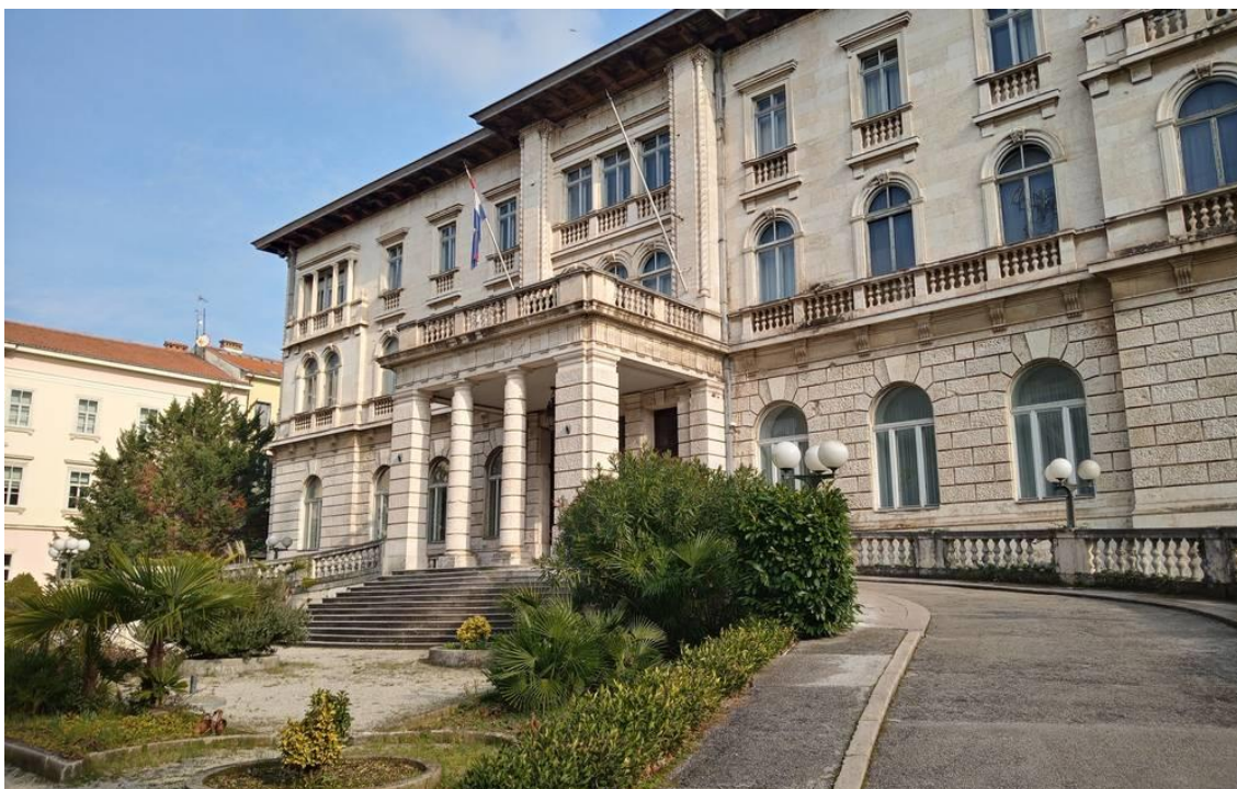
Slika 9. Dom hrvatskih branitelja

posjetitelje i domaćin je brojnih kulturnih programa, izložbi, svečanih večera, koncerata i predavanja. 45