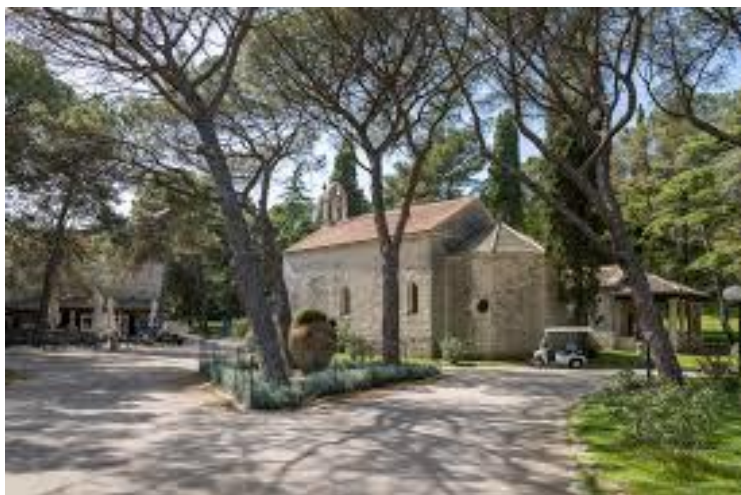
Slika 13. Crkva sv. Germana