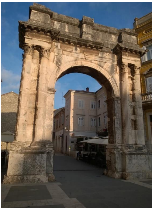
Slika 4. Slavoluk Sergijevaca

bedemom srušena u 19. stoljeću kao posljedica procesa urbanizacije i proširenja grada na područje izvan zidina. 34