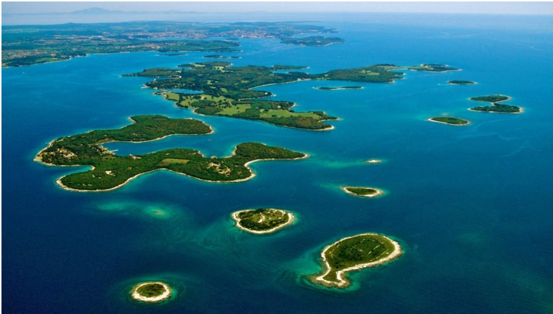
Slika 10. Brijuni (Nacionalni park Brijuni (2024) Dostupno na: https://www.np-brijuni.hr/en/brijuni/general-information/brijuni-in-figures (07.05.2024.))