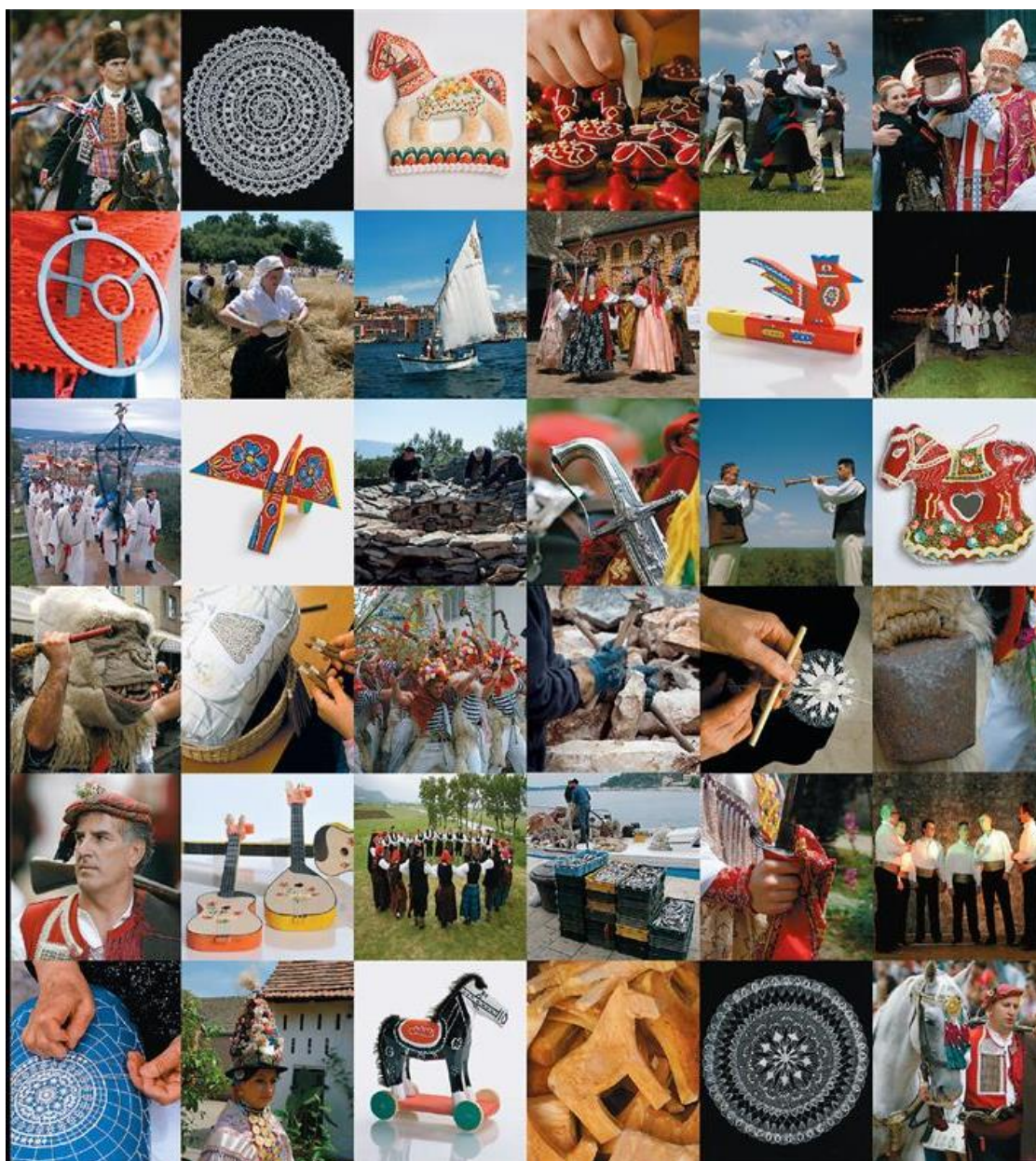
Slika 16. Nematerijalna kulturna baština Republike Hrvatske na UNESCO-ovoj listi (Ministarstvo kulture i medija Republike Hrvatske)

Također, na UNESCO-ovom Popisu svjetske baštine nalaze se i sljedeća nepokretna kulturna dobra s područja Republike Hrvatske i to kako slijedi: