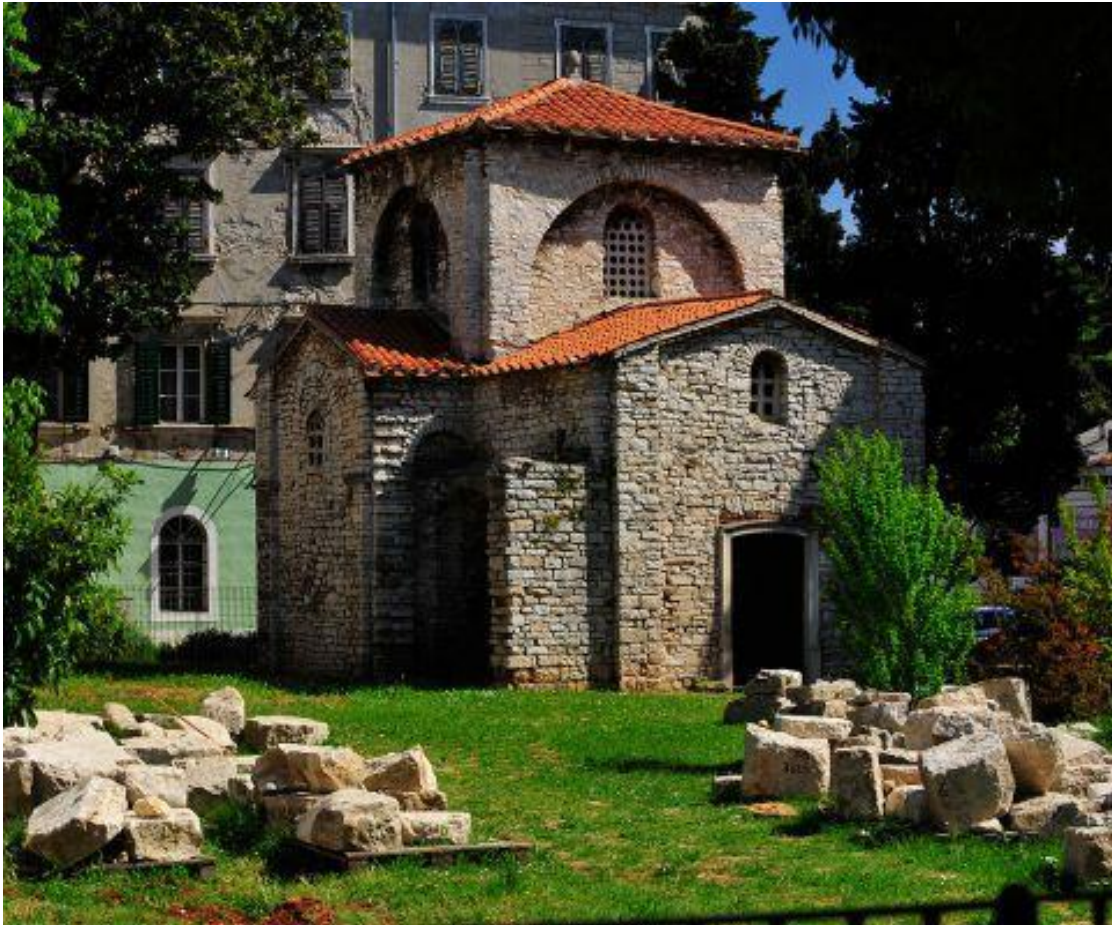
Slika 6. Bazilika svete Marije Formose (Istra.hr (2024) Dostupno na: https://www.istra.hr/hr/dozivljaji/kultura/ranokrscanski-spomenici/sv-marija-formoza (07.05.2024))