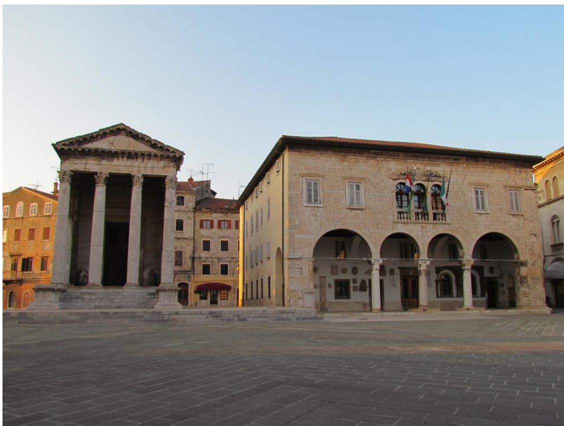
Slika 3. Forum u Puli (Istra.hr (2024) Dostupno na: https://www.istra.hr/hr/destinacije/pula/dozivate/highlights/augustov-hram-i-forum (07.05.2024.))

posveta ovog hrama ukazuje da je hram bio posvećen upravo božanstvu samog cara. Nakon antičkog razdoblja, prostor hrama neko se vrijeme koristio kao crkva, a nakon toga, hram je pretvoren u skladište za žito. 33