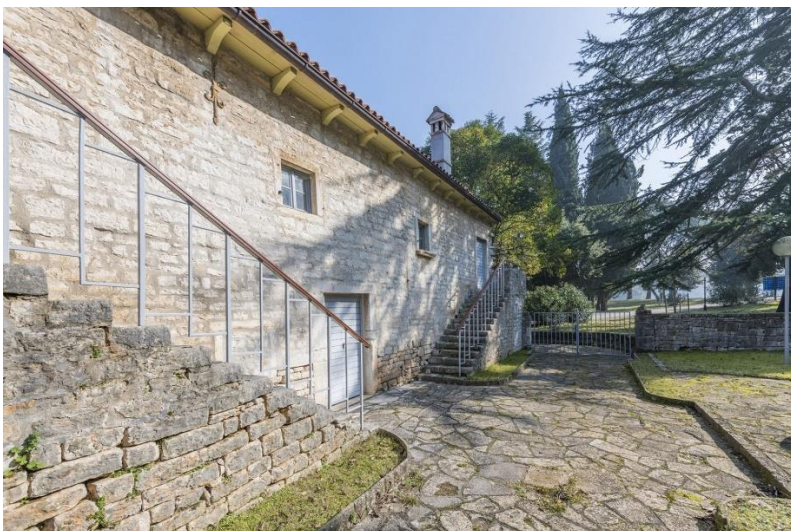
Slika 12. Vila Pava

luke, a njezina posebnost su dva vanjska stubišta koja vode izravno iz dvorišta u prostorije na katu. 62