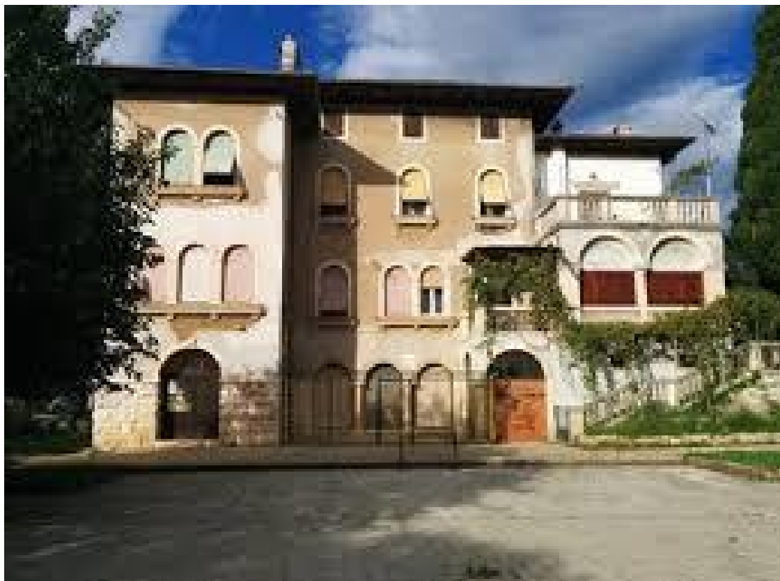
Slika 8. Casa Trap (Waymark (2024) Casa Von Trapp, Dostupno na: https://www.waymarking.com/waymarks/WMMCQX_Casa_Villa_Trapp_The_Von_Trapp_family_home_in_Pula_Croatia (04.05.2024.))

stambenih građevina počeo se graditi vrlo brzo nakon što je Pula proglašena glavnom ratnom lukom u Carevini Austriji, tijekom 19. stoljeća. Njihovom primarnom funkcijom smatra se smještaj, prvenstveno zbog toga što se pojavila potreba za smještanjem značajnog broja viših i nižih časnika koji su u Pulu stigli iz drugih krajeva. 42