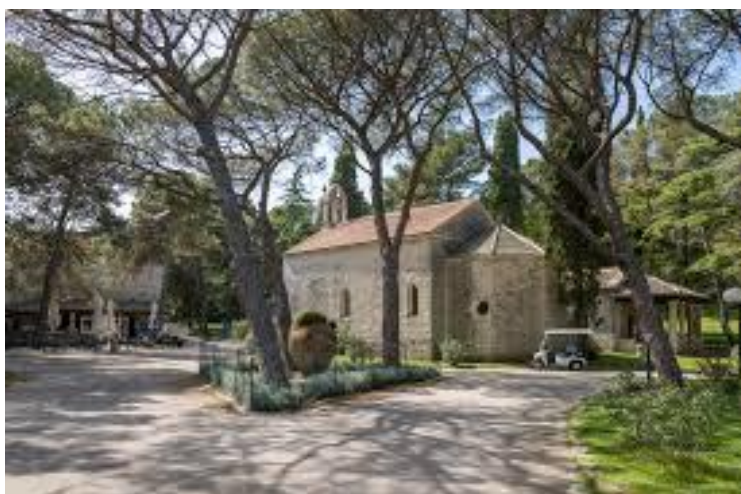
Slika 13. Crkva sv. Germana