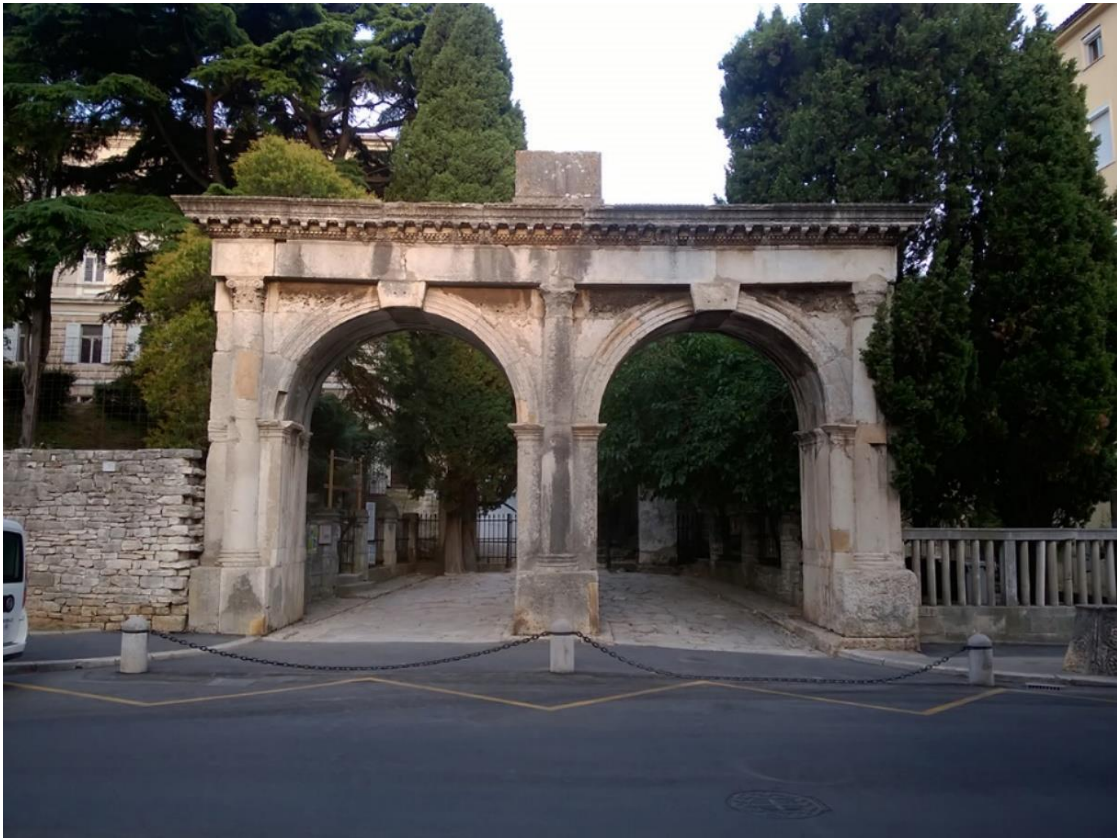
Slika 5. Dvojna vrata (Istra Culture (2024) Dostupno na: https://www.istria-culture.com/dvojna-vrata-i158 (07.05.2024.))

Bazilika svete Marije Formose smatra se najznačajnijom građevinom na pulskom području iz razdoblja Bizantskog Carstva. Sagrađena je u 6. stoljeću, za vrijeme vladavine cara Justinijana. Vrijeme je imalo značajan utjecaj na kompleks građevina, a velika joj je šteta prouzročena i tijekom mletačke vlasti. Strukturom i oblikom podsjeća na ravensku crkvu, dok je unutrašnjost ukrašena sukladno bazilici. 36