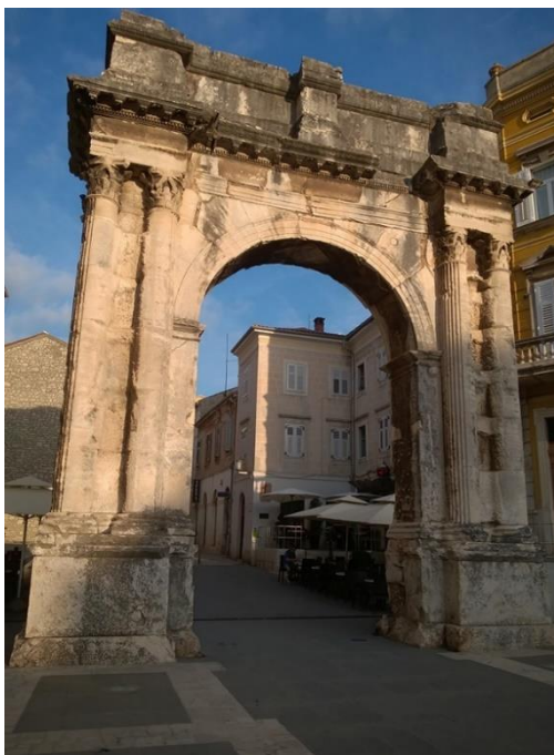
Slika 4. Slavoluk Sergijevaca (Istra Culture (2024) Dostupno na: https://www.istria-culture.com/slavoluk-sergijevaca-i104 (07.05.2024.))

bedenom srušena u 19. stoljeću kao posljedica procesa urbanizacije i proširenja grada na područje izvan zidina. 34