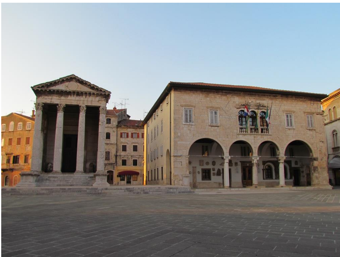
Slika 3. Forum u Puli (Istra.hr (2024) Dostupno na: https://www.istra.hr/hr/destinacije/pula/dozivate/highlights/augustov-hram-i-forum (07.05.2024.))

posveta ovog hrama ukazuje da je hram bio posvećen upravo božanstvu samog cara. Nakon antičkog razdoblja, prostor hrama neko se vrijeme koristio kao crkva, a nakon toga, hram je pretvoren u skladište za žito. 33