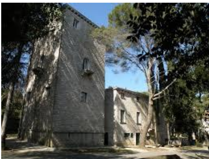
Slika 14. Donžon (Nacionalni park Brijuni (2024) Dostupno na: https://www.np-brijuni.hr/hr/brijuni/kulturno-povijesna-bastina/graditeljska-bastina (05.06.2024.))

Jedan od najraskošnijih kompleksa na području Brijuna je vila izgrađena u uvali Verige, koju karakterizira iznimna uklopljenost u krajolik koji je okružuje. Sama vila sastavljena je od nekoliko građevina koje su imale različite namjene, a bogato su ukrašene mozaicima, freskama te mramorom i štukaturama. Sve građevine koje su pripadale ovoj vili povezane su sustavom koji čine otvorene i zatvorene šetnice dužine više od jednog kilometra uz obalu. 63