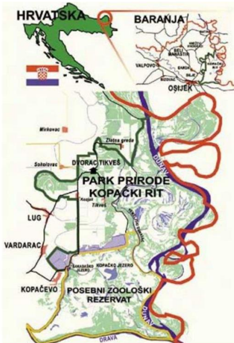
Slika 3. Lokacija Parka prirode Kopački rit