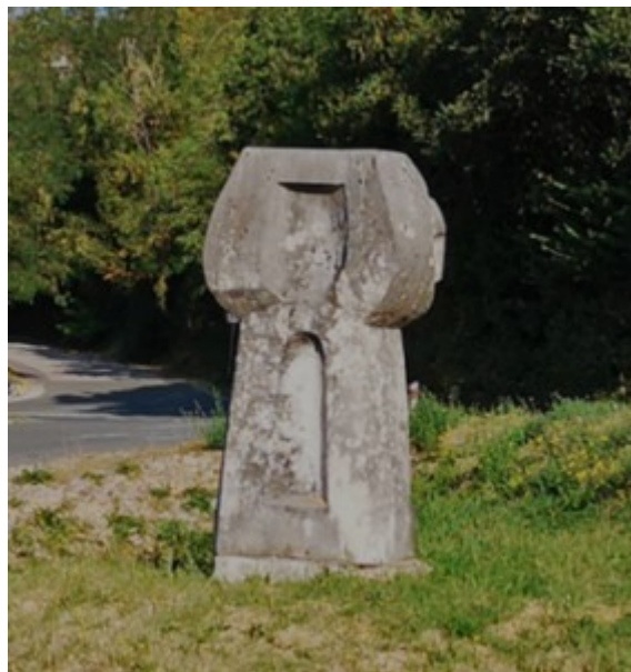
Slika 28. Stup Čakavskog sabora