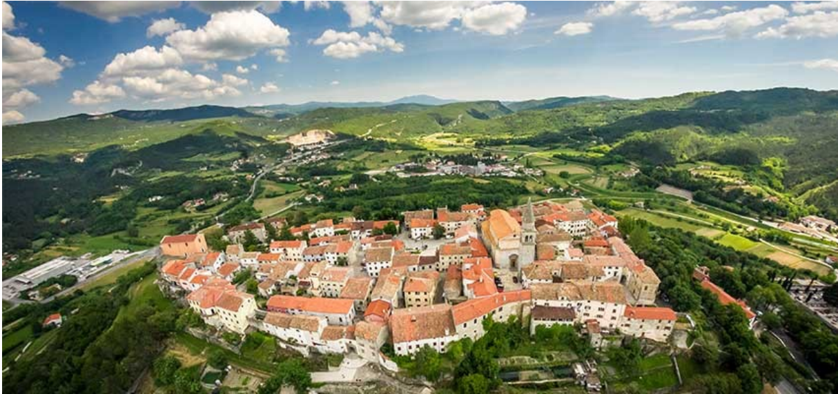
Slika 3. Grad Buzet

manifestacijama, danu grada, brdskim utrckama te kulturno-povijesnoj baštini. U okolici grada nalaze se brojna sela, utvrde, spomenici i crkve koji svjedoče o bogatoj povijesti grada.