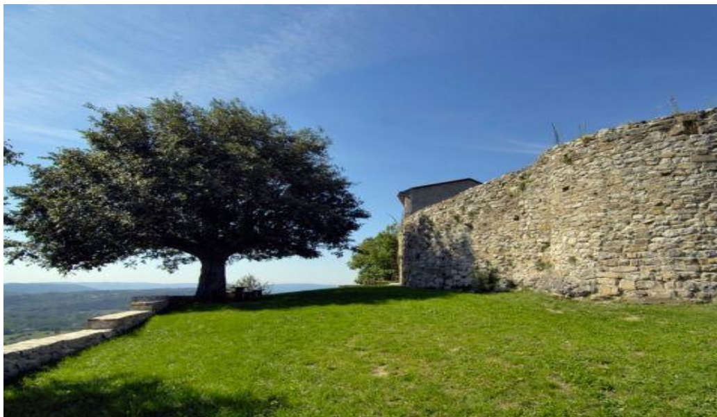
Slika 10. Ročke zidine

Iako je od njega danas ostala samo kula, Roč je nekada imao i kaštel. Prvi se put spominje 1064., kada kralj Henrik daruje Roč markgrofu Odolricusu. U periodu od XII. do XV. stoljeća Roč je bio kaštel koji se nalazio unutar danas jedinih preostalih zidina. Godine 1412., Venecija je osvojila kaštel u Roču, a njegove su zidine opet podignute 1421. od strane Mlečana zbog strateške pozicije na kojoj se Roč i njegove zidine nalaze i zbog opasnosti od Turaka. Da je od velike važnosti pokazuje i činjenica da je bio dijelom i rašporskog kapetanata uz Buzet, Hum, Draguč, Vrh i Sovinjak. 35