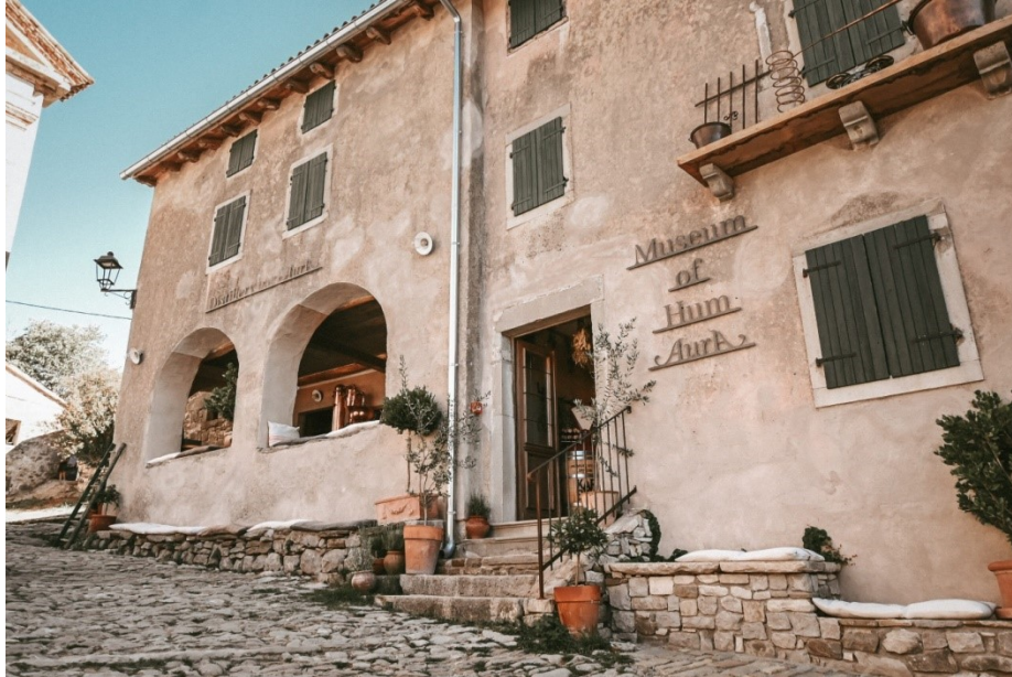
Slika 24. Muzej Huma AurA