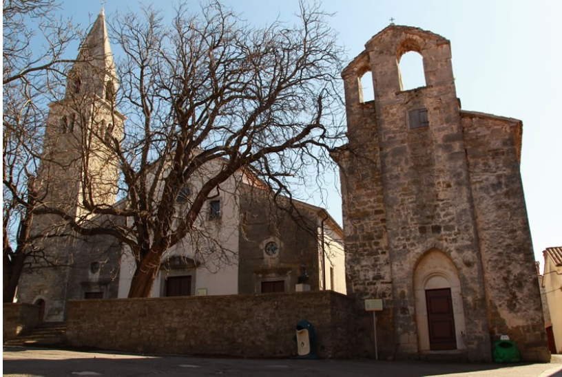
Slika 19. Crkva sv. Antuna u Roču