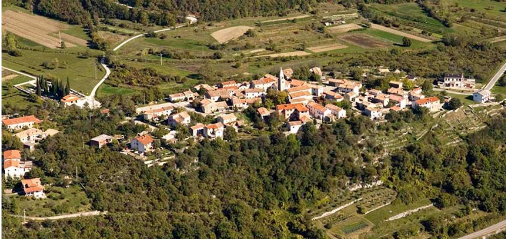
Slika 4. Roč

koje će se predstaviti kasnije u nastavku, a dom je i replike Gutenbergove preše te vidikovca posvećenom kiparu Želimiru Janešu koji se nalazi kod tzv. Malih vratiju.