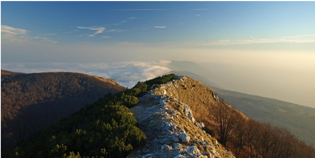
Slika 6. Park prirode Učka

Park Prirode Učka dio je kulturne baštine sjeverne Istre koji obuhvaća planinu Učku i dio planine Ćićarije te veže Istru s kontinentalnim dijelom Hrvatske. Učka je proglašena parkom prirode zbog svojeg reljefa i blizine mora, a to je uvjetovalo također razvoj šumske vegetacije te klime specifične za ovo područje. Ovo je područje također bogato brojnim livadama i staništima na kojima se nalaze brojne biljne i životinjske vrste. Od iznimne je važnosti kao prirodna baština jer je omiljeno izletišta brojnim zaljubljenicima u prirodu i nudi bijeg od stvarnosti, opuštanje i uživanje u miru i prirodi. Do sada je učinjeno mnogo koraka ka stvaranju turističke infrastrukture, od postavljanja putokaza, cestovne signalizacije i slično, no potrebno je i dalje informirati posjetitelje kako se ova baština ne bi degradirala i uništila od strane ljudske ruke. 28