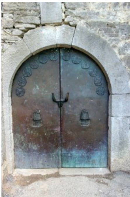
Slika 38. Vrata Huma

malom gradiću / u pohode dođi / na kamenu tvrdu / toplina vri... A na gornjem dijelu vrata nalazi se kalendarij, tj. dvanaest medaljona postavljenih polukružno, po šest na svakom krilu vrata, koji predstavljaju prizore iz seoskog života kroz dvanaest mjeseci. 85