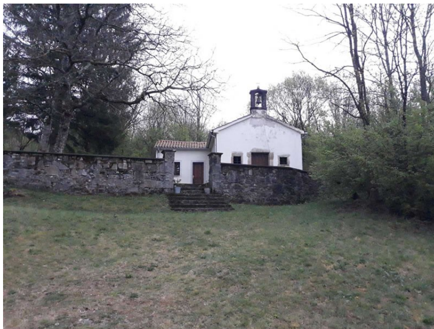
Slika 17. Crkva sv. Nikole u Rašporu