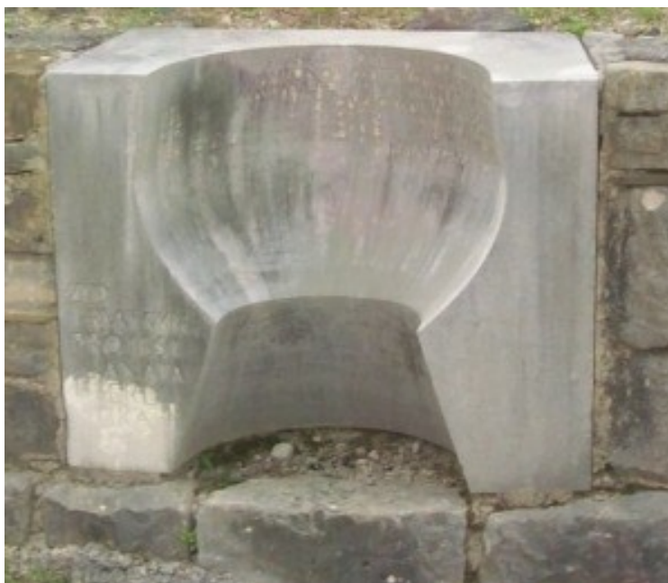
Slika 35. Zid hrvatskih protestanata i heretika

Dominis, Juraj Križanić. To su imena jednih od značajnijih hrvatskih protestanata i heretika. U ovaj je zid ugrađeno sedam kamenih ploča kojima je popločen trg u Motovunu, a zanimljive su po tome jer su na njima citati koji su istrgnuti iz protestantskih djela. 81 No zašto zid? Upravo zbog toga jer se pred zidom izgovaraju posljednje istine i nema mjesta lažima. Zid je zidan od strane domaćeg majstora i danas je on zaštićeno dobro. 82