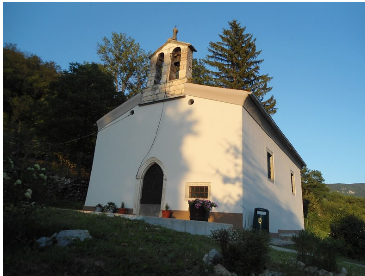
Slika 14. Crkva sv. Ane u Podgaćama

Tu je još i crkva sv. Ane u Podgaćama. Crkva ima jedno zvono na krovu, a unutar crkve nalazi se kip Sv. Ane i Blažene Djevice Marije, Sv. Roka i Sv. Blaža. Misa se u ovoj crkvi služi za blagdan Sv. Ane, 26. srpnja točnije subotu prije ili nakon blagdana. 40