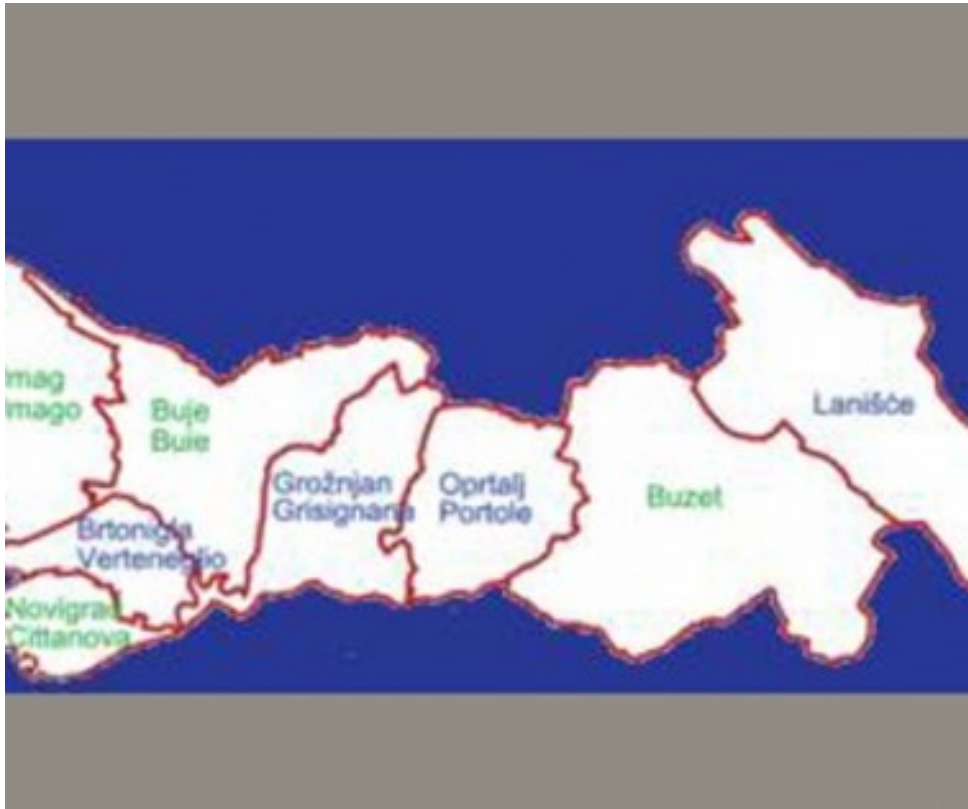
Slika 1. Grafički prikaz sjeverne i sjeverozapadne Istre

U nastavku slijedi grafički prikaz sjeverne i sjeverozapadne Istre.