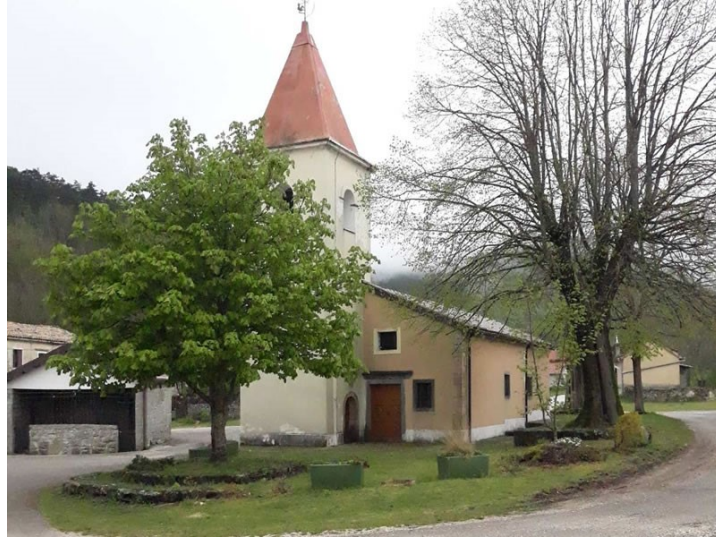
Slika 16. Crkva Blažene Djevice Marije u Račjoj Vasi