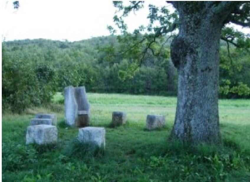
Slika 30. Katedra Klimenta Ohridskog

postavljen je u prirodi, kao i svi drugi spomenici, ali naglašava kako je upravo prvo slavensko učilište bilo smješteno u prirodi, gdje bi učitelj sjedio na katedri, a učenici na ostalim blokovima. 72