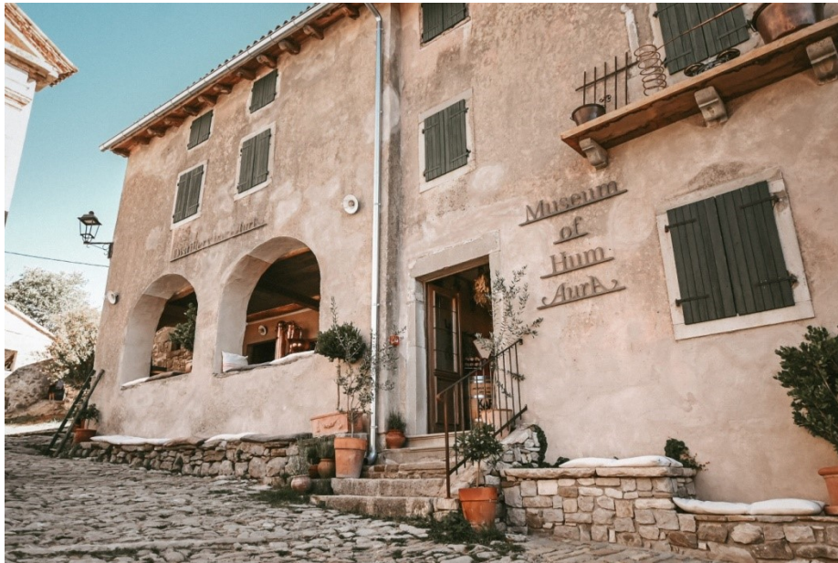
Slika 24. Muzej Huma AurA