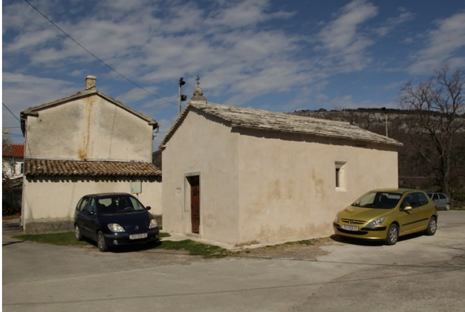
Slika 20. Crkva sv. Roka u Roču