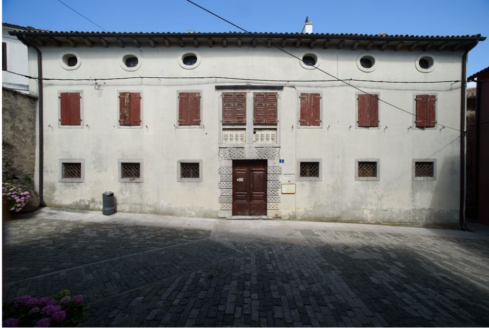
Slika 23. Zavičajni muzej Buzet