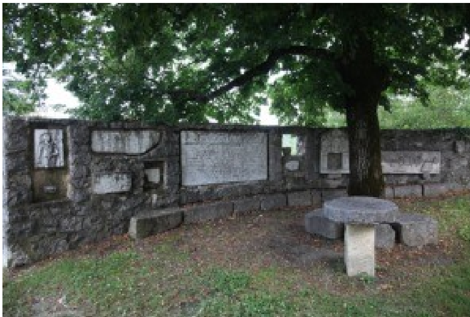
Slika 31. Glagoljski lapidarij