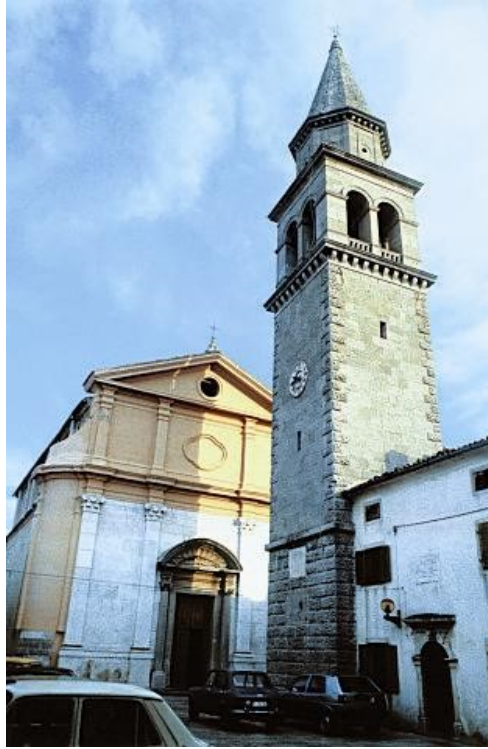
Slika 22. Crkva Uznesenja Blažene Djevice Marije u Buzetu