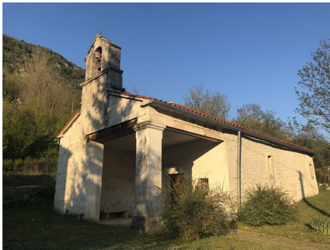
Slika 15. Crkva sv. Križa u Prapoću

Crkva sv. Križa u mjestu Prapoće još je jedan od objekata materijalne kulturne baštine na području Općine Lanišće. Crkva je 1784. pregrađena, no ipak ima ostatke gotičkih elemenata. Na pročelju crkve vidljiva je preslica sa zvonom, dok se unutra nalazi drveni oltar s raspelom i kipovima Blažene Djevice Marije i Sv. Ivana apostola. 41