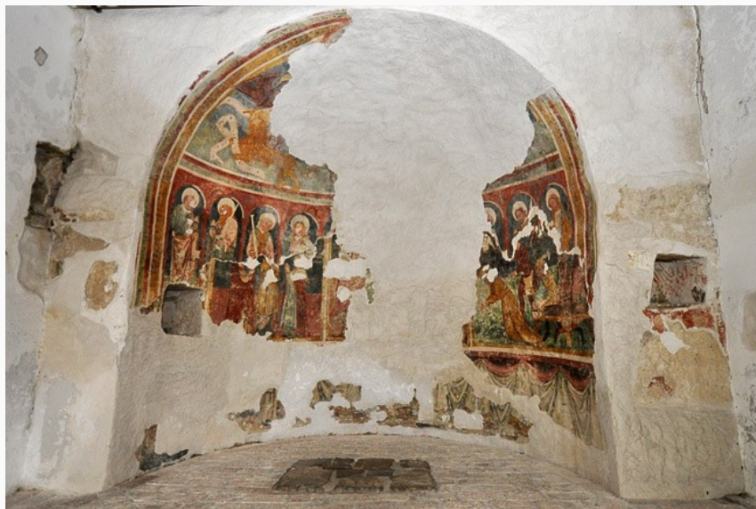
Slika 27. Freske u crkvi sv. Roka u Roču

U vrijeme srednjega vijeka, freske su bile mnogo više od samog ukrasa i slika. One su pričale jedinstvene priče, one biblijske i religiozne. Isto tako, slikari su slikali i scene posljednjeg suda kako bi vjernike podsjetile na to da nije u redu grijешiti. Najpoznatija freska je „Ples mrtvaca“ koja se nalazi u crkvi sv. Marije na Škrilinah kraj Berma i dovršena je od strane Vincenta iz Kastva davne 1474. Brojne se freske nalaze i u crkvama na području sjeverne Istre, a da su važne za lokalnu povijest pokazuju činjenice da se postoje i radionice za oslikavanje fresaka u Roču, rade se edukacije i na manifestaciji MGA Roč i brojnim drugima, što pokazuje da su freske i dan danas važne i kako je važno očuvati toliko bogatu povijesnu tradiciju.. 54