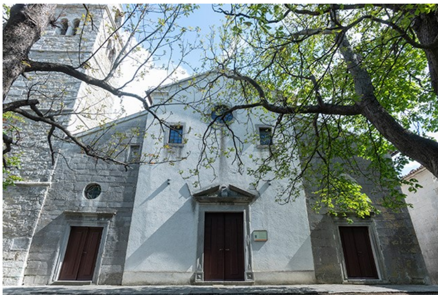
Slika 18. Crkva sv. Bartola u Roču