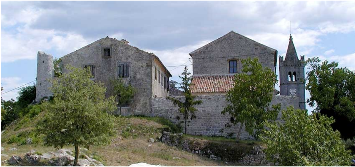
Slika 5. Hum