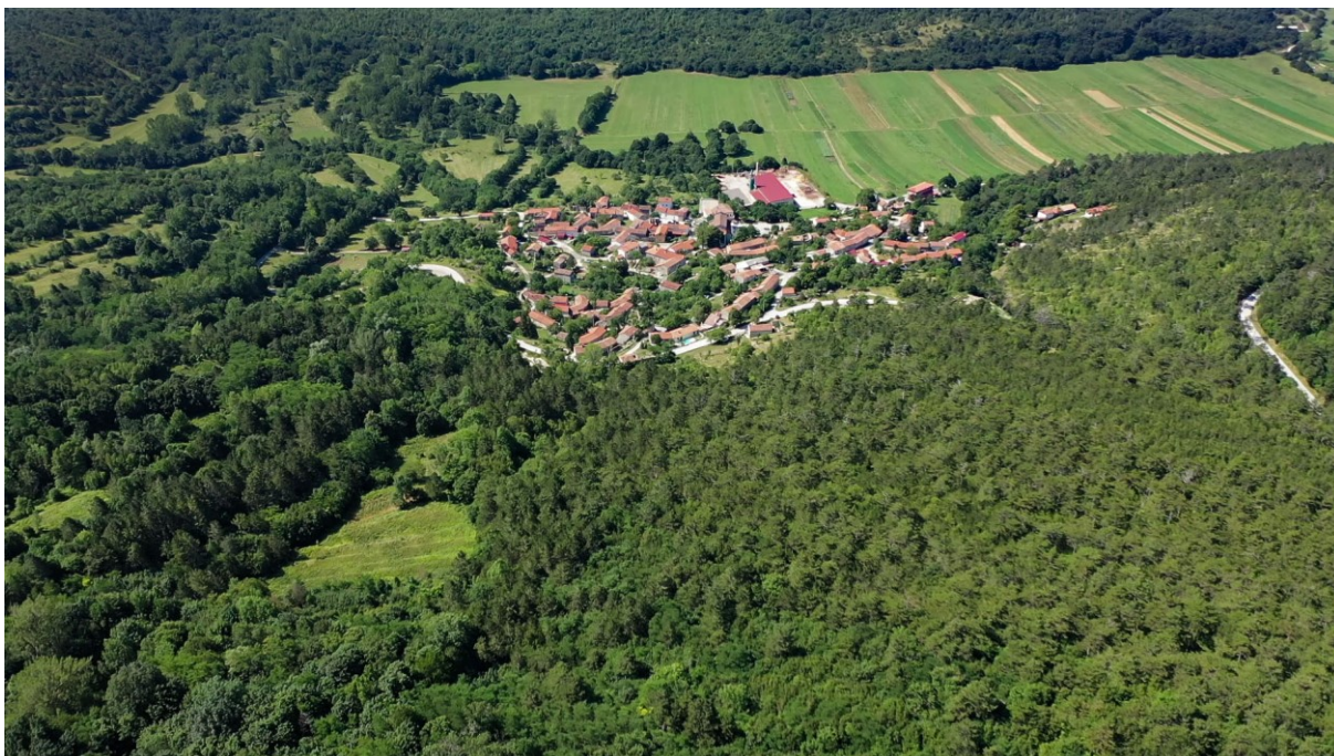
Slika 2. Selo Lanišće