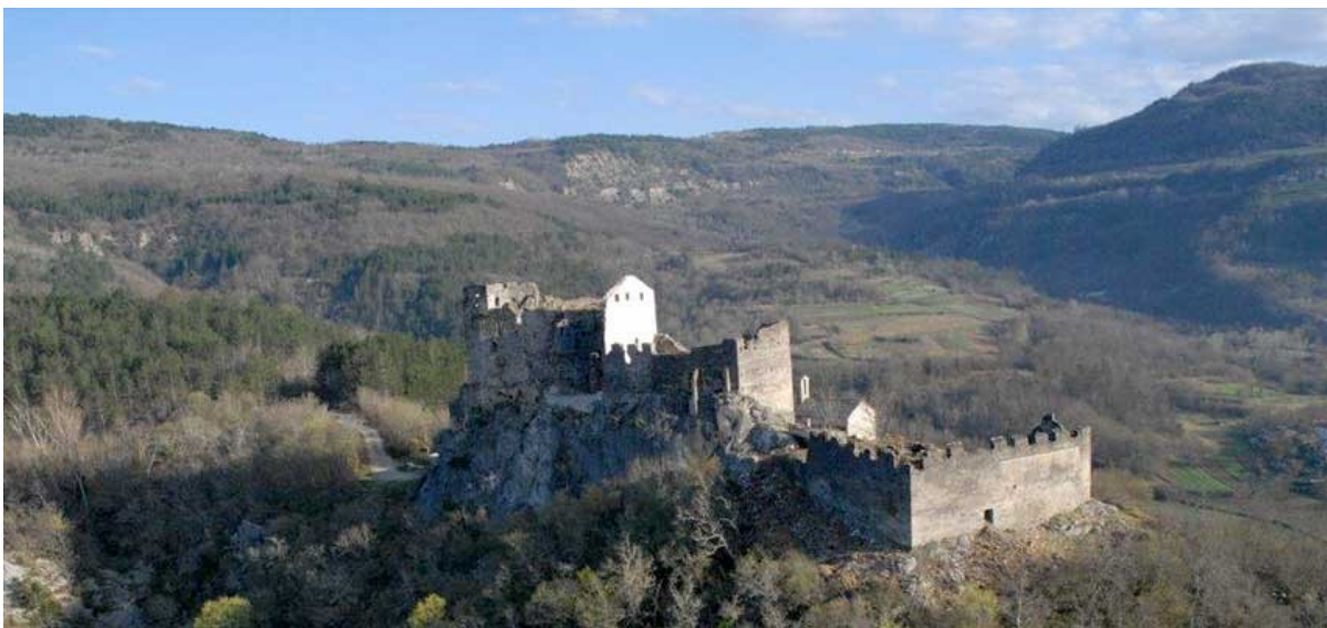
Slika 9. Kaštel Petrapilosa

Osim za promatranje, kaštel je služio i za kontrolu na vojnom području. Kroz povijest izmijenili su se brojni vlasnici te je kaštel opstao do kraja XVIII. stoljeća, iako neki izvori kažu kako je kaštel izgorio u XVII. stoljeću i kasnije se više nije obnavljao. Crkva koja se nalazi u sklopu kaštela ostala je u funkciji također do XVIII. stoljeća, ali su nakon obnove crkve pronađeni ostaci fresaka koji se danas čuvaju u Zavičajnom muzeju u Buzetu. Danas, u kaštelu su postavljeni i interaktivni punktovi koji omogućuju pristup informacijama i otvoren je za posjetitelje. Samo ime kaštela Petrapilosa zapravo označava kosmati grad (pietra = kamen, peloso = bujno, dlakavo), no domaćini ga generalno samo nazivaju kaštelom, a pojavljuje se i u Istarskom razvodu kao Kostel. 34