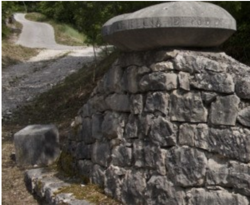
Slika 32. Klanac hrvatskog Lucidara

izvornog lucidara i sastavljen je u obliku 96 pitanja i odgovora gdje učenik postavlja pitanja i učitelj na njih odgovara. 76