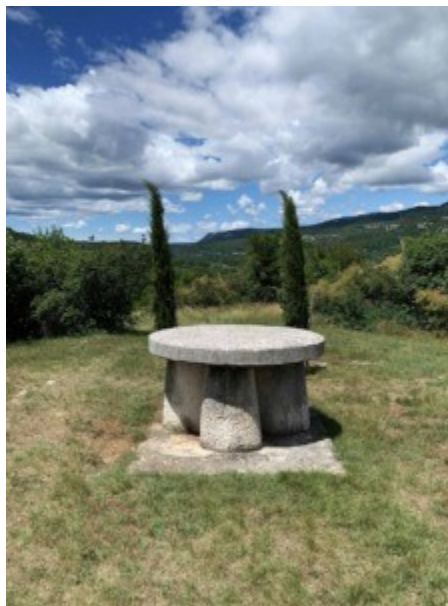
Slika 29. Stol Ćirila i Metoda

Sljedeći spomenik nalazi se u mjestu Forčići i naziv mu je Stol Ćirila i Metoda. Spomenik je u obliku stola i naziv je zapisan latinicom, glagoljicom i ćirilicom, na obodu stola. Simbolično, pored stola posađena su dva čempresa koji simboliziraju braću Ćirila i Metoda, a svečano je otkriven 1978. Stol stoji na tri kamena stupa, tj. na tri kamene noge prema staroj uzrečici „Sve trojno je savršeno.“ Glagoljski tekst ispisan na stolu uklesan je uglatom glagoljicom kakva se koristila i u crkvenim redovima. 70