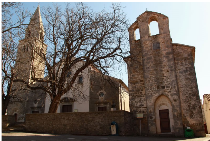
Slika 19. Crkva sv. Antuna u Roču