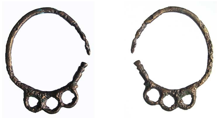
Slika 26. Buzetska naušnica

upisom u Registar kulturnih dobara Republike Hrvatske još 1968. Primjerci same buzetske naušnice dio su postave Zavičajnog muzeja u Buzetu i oni su ti koji su pokrenuli projekt izrade replike naušnica za nošenje. Nema puno informacija o ovom suveniru, no podaci kažu kako je na groblju u Mejici pronađeno čak 18 primjeraka buzetske naušnice te 2 primjerka na Sovinjskom brdu. Analizirajući samu naušnicu, pretpostavlja se kako je pripadala nošnji karakterističnoj za ranosrednjovjekovno autohtono stanovništvo te romanizirano ilirsko-keltsko stanovništvo koje je tada živjelo između alpskog pojasa i jadranskih obala. 53