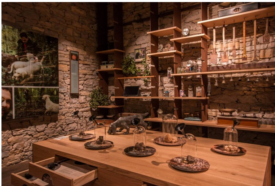
Slika 25. Muzej tartufa obitelji Karlič