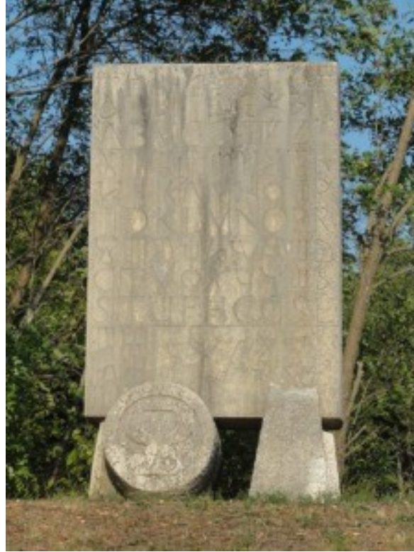
Slika 33. Vidikovac Grgura Ninskog