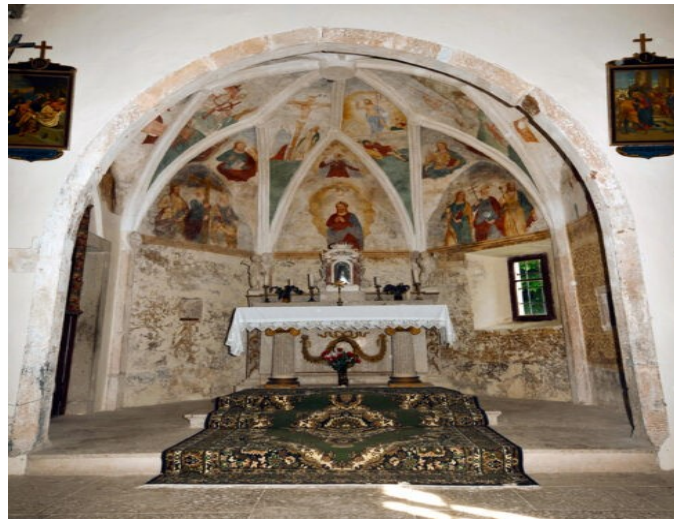
Slika 12. Crkva sv. Mateja u Slumu

Općina Lanišće poznata je po svojim ruralnim naseljima i selima koji odišu duhom prošlosti i to je ono što je čini posebnom. Kulturna baština Općine Lanišće i same Ćićarije bogata je crkvama. Upravo se u mjestu Slum nalazi jedna takva crkva, crkva Sv. Mateja u kojoj se nalaze brojne restaurirane freske. Što se tiče Crkve sv. Mateja u Slumu, upravo prema glagoljskom natpisu na svodu, vidljivo je da crkva datira iz 1555., po čemu su te freske jedne od najmlađih na području Istre. Što se povijesnih razdoblja tiče, likovi su oblikovani po renesansi, no zapravo pripadaju srednjovjekovlju. Te freske predstavljaju svece i proroke i naviještanje, raspeće, uskrsnuće i sv. Jurja koji ubija zmaja. Iznad sadašnjeg oltara vidljiva je freska Boga Oca koji je prikazan s vladarskom jabukom i kako blagoslivlja desnom rukom. U nastavku slijedi slikovni prikaz crkve sv. Mateja i fresaka u toj crkvi. 37