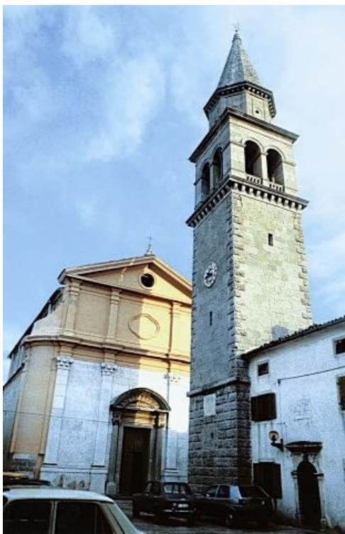
Slika 22. Crkva Uznesenja Blažene Djevice Marije u Buzetu