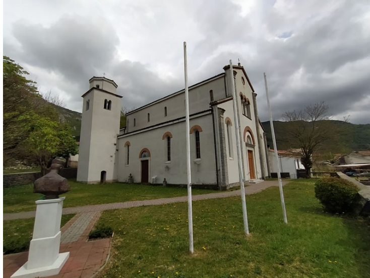
Slika 13. Crkva sv. Kancijana, Kancija i Kancijanile u Lanišću