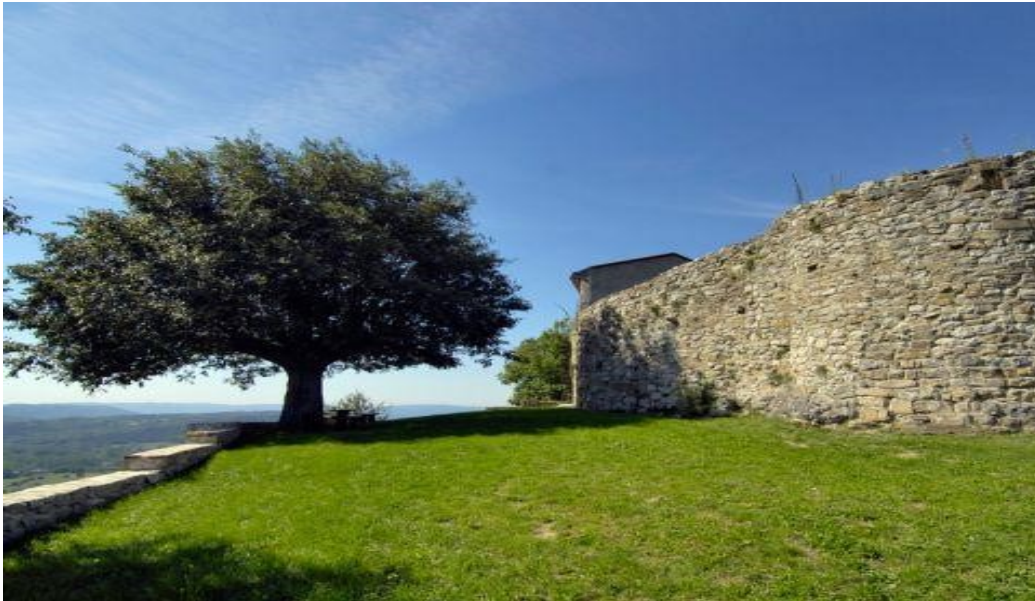
Slika 10. Ročke zidine

Iako je od njega danas ostala samo kula, Roč je nekada imao i kaštel. Prvi se put spominje 1064., kada kralj Henrik daruje Roč markgrofu Odolricusu. U periodu od XII. do XV. stoljeća Roč je bio kaštel koji se nalazio unutar danas jedinih preostalih zidina. Godine 1412., Venecija je osvojila kaštel u Roču, a njegove su zidine opet podignute 1421. od strane Mlečana zbog strateške pozicije na kojoj se Roč i njegove zidine nalaze i zbog opasnosti od Turaka. Da je od velike važnosti pokazuje i činjenica da je bio dijelom i rašporskog kapetanata uz Buzet, Hum, Draguč, Vrh i Sovinjak. 35