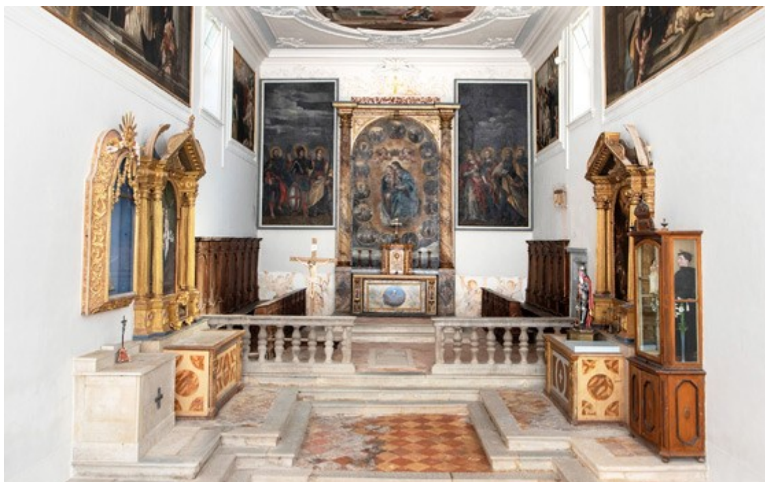
Slika 21. Crkva sv. Jurja u starogradskoj jezgri Buzeta

temelja obnovljena. Krajem XVIII. stoljeća crkva je ponovno preuređena i oslikana medaljonima. 48