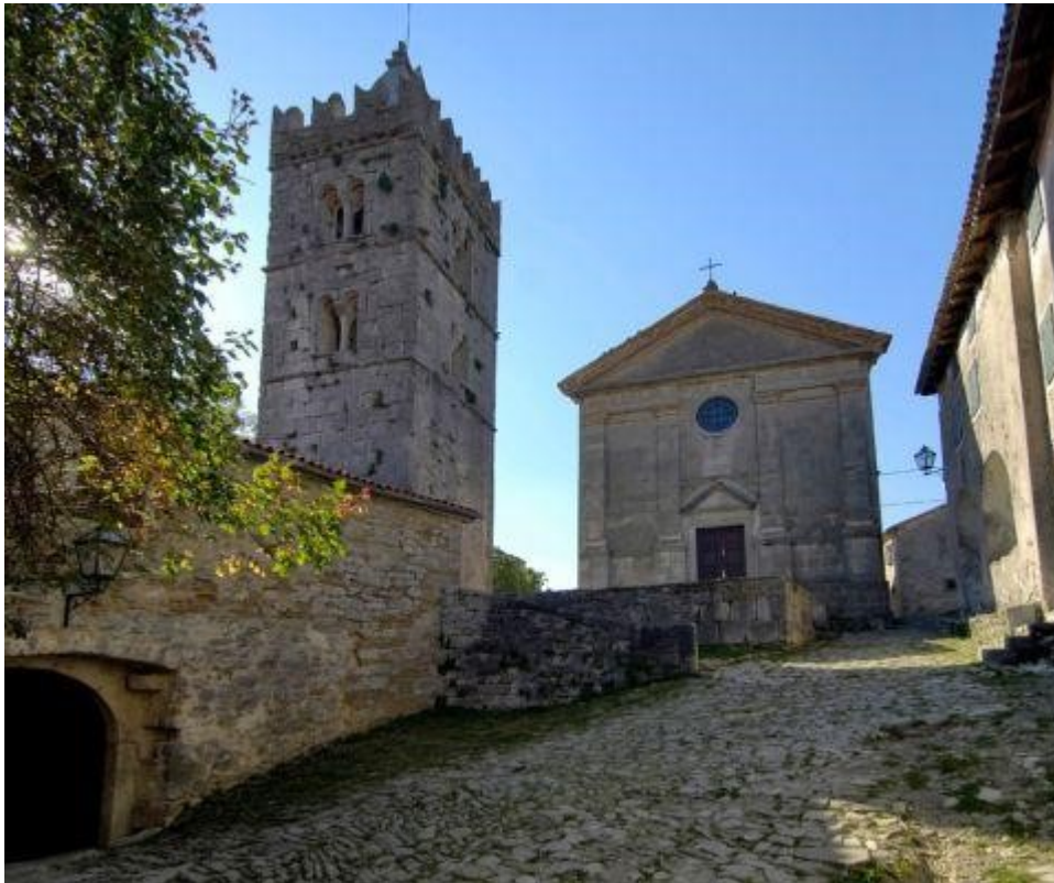
Slika 11. Mjesto nekadašnjeg kaštela u Humu

kamenja su se koristili za izgradnju kuća. Kaštel se prvi put spominje 1102. u darovnici u kojoj grof Ulrich II. Hum daje u feud akvilejskom patrijarhu. Od vremena antike pa do kasnog srednjeg vijeka služio je kao kaštel-branič. Nakon razaranja kaštela, izgubio mu se svaki mogući trag prvotno zbog korištenja kamenja za izgradnju kuća, a potom zbog izgradnje današnje crkve. 36