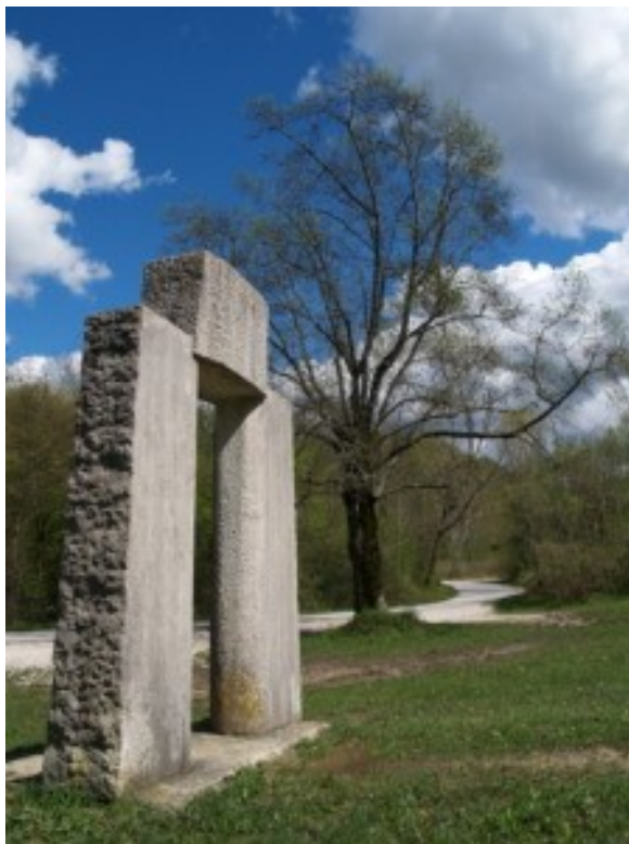
Slika 34. Uspon Istarskog razvoda

Istre. 79 Zanimljiva je činjenica da su na lijevoj strani slova uklesani i nazivi gradova koji su pomogli pri realizaciji projekta, a to su Buzet, Buje, Pazin, Labin, Rovinj, Pula i Poreč, a s druge strane je znak Čakavskog sabora, dakle slovo „S“. Isto tako, kipovi koji ispisuju naziv Istarski razvod također djelomično podsjećaju i na predmete karakteristične za Istru poput seoskih crkava, peći, dimnjaka i slično. 80