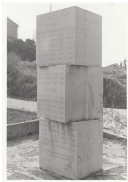
Slika 37. Spomenik otporu i slobodi

zemlje branimo . Spomenik je također prikaz seoskog života u Istri s elementima voza, črtala cvijeta te također i imena poginulih boraca i žrtava fašizma. 84