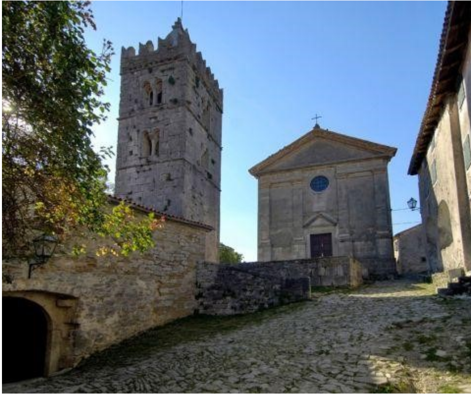
Slika 11. Mjesto nekadašnjeg kaštela u Humu

kamenja su se koristili za izgradnju kuća. Kaštel se prvi put spominje 1102. u darovnici u kojoj grof Ulrich II. Hum daje u feud akvilejskom patrijarhu. Od vremena antike pa do kasnog srednjeg vijeka služio je kao kaštel-branič. Nakon razaranja kaštela, izgubio mu se svaki mogući trag prvotno zbog korištenja kamenja za izgradnju kuća, a potom zbog izgradnje današnje crkve. 36