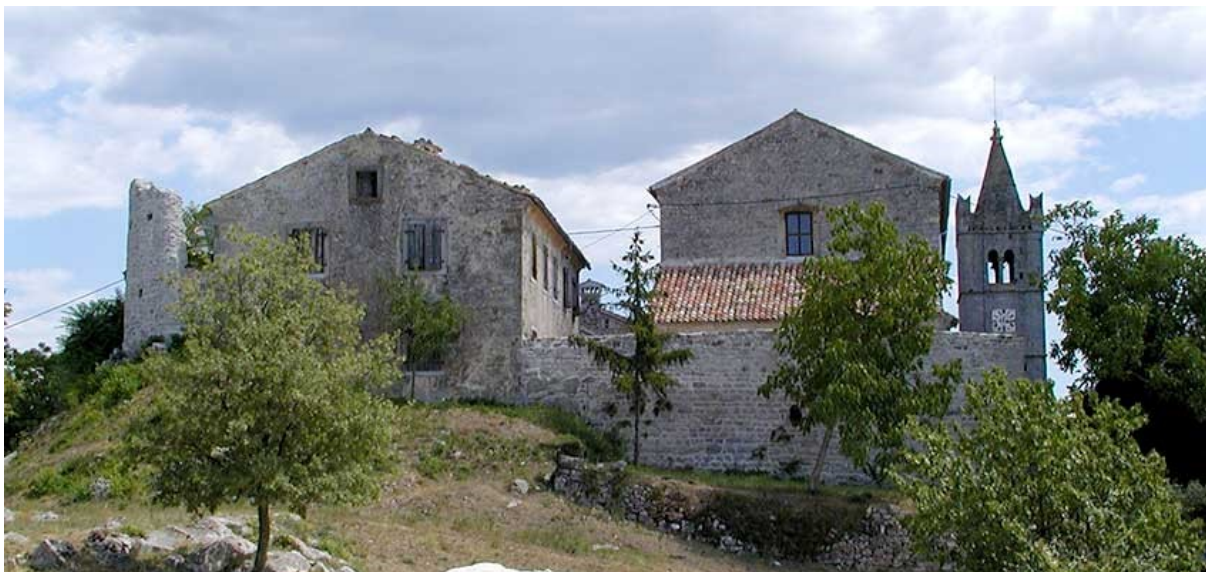
Slika 5. Hum