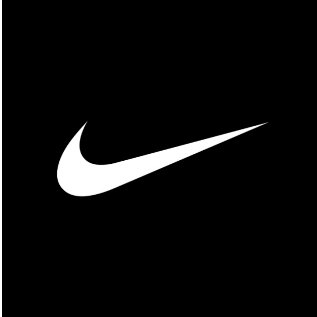
Slika 5. Vizualni elementi Nikea