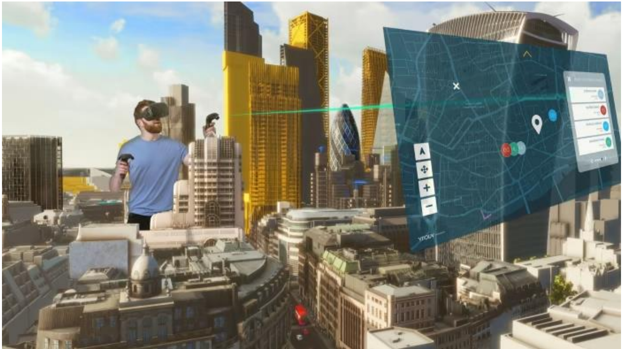
Slika 1. Mapiranje vizualne stvarnosti – primjer Londona