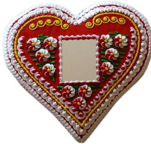
Slika 4.: „Licitarsko srce“