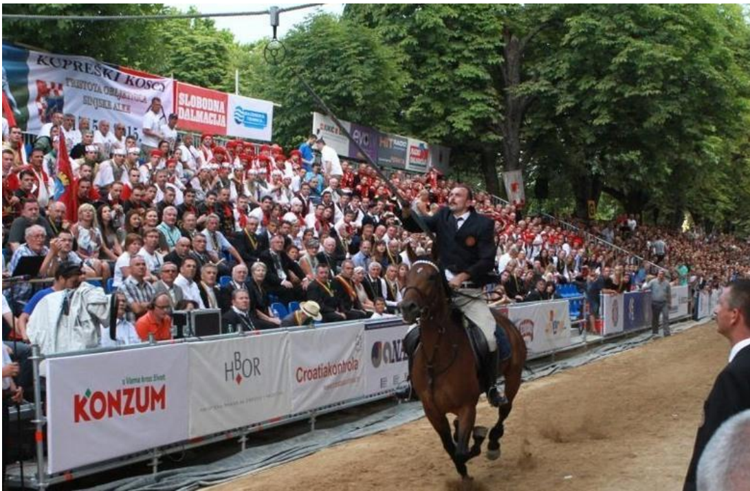
Slika 6.: „Alkar“