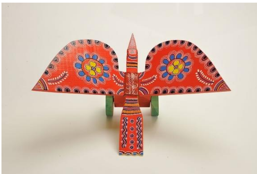
Slika 3. : „Klepetaljka“