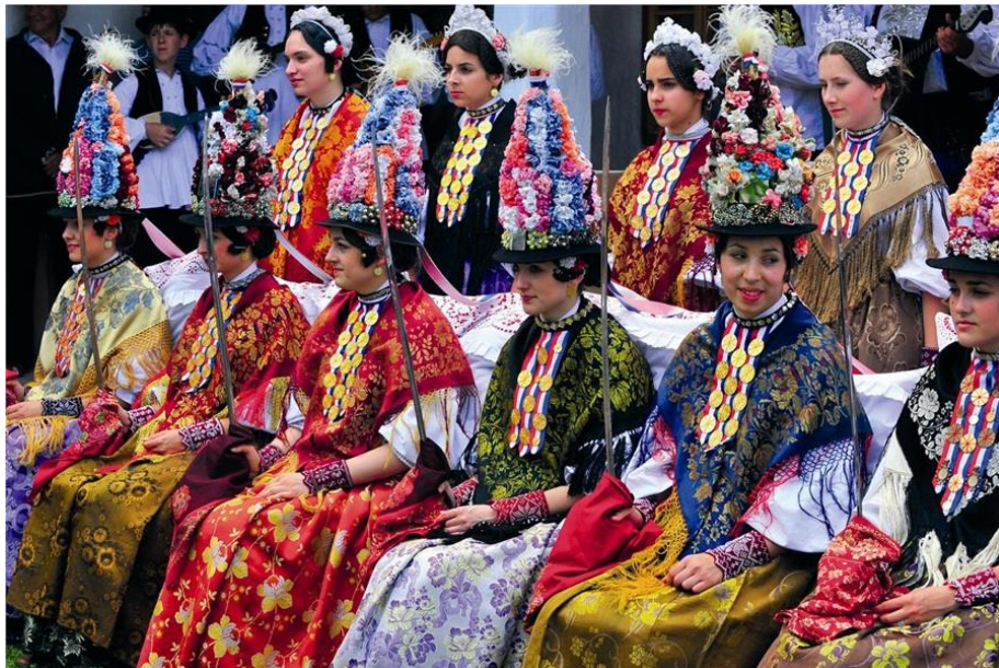
Slika 2.: „Ljelje“