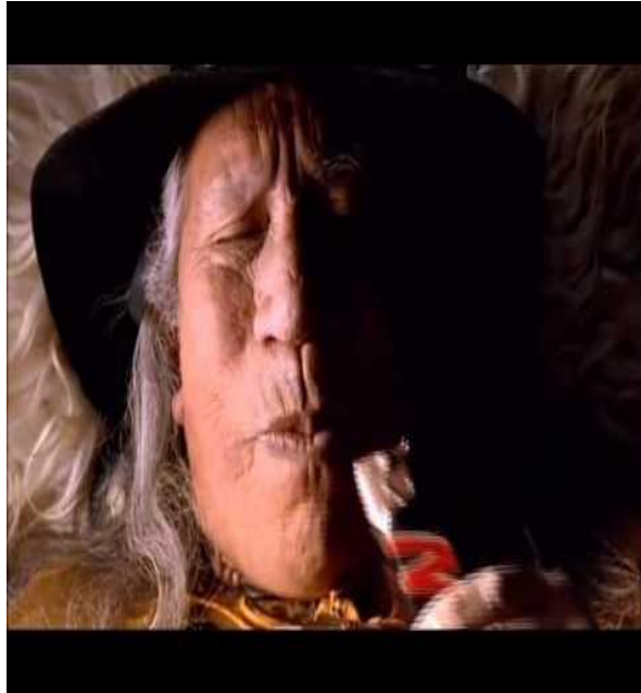
Slika 2. Čokoladica Mars

Slika 2. prikazuje starog Indijanca koji uživa jedući čokoladicu Mars. Ovaj oglas nije toliko privlačan, čak se može reći da je i odbojan.