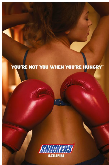
Slika 1. Čokoladica Snickers

Svi već jako dobro znaju da oglasi prodaju proizvod. Slika 1. prikazuje oglas za čokoladicu Snickers. Možemo reći da je oglas dosta aktraktivan i vrlo uočljiv. Prikazuje mladu djevojku koja na sebi nosi samo donje rublje. Oglas šalje poruku "You're not you when you're hungry" (Kad si gladan nisi svoj). Odnosno, u ovom slučaju. Kad si gladan nema seksa.