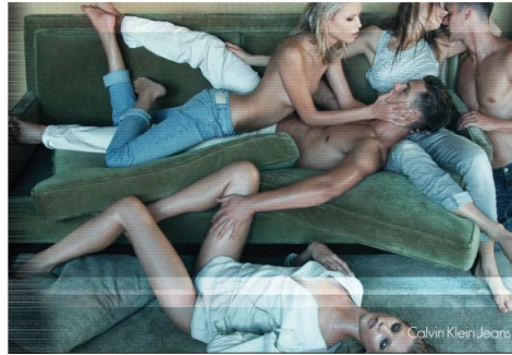
Slika 12. Calvin Klein Jeans