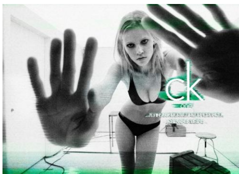
Slika 14. CK One linija