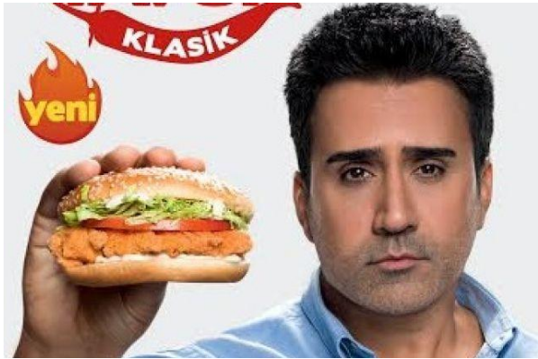
Slika 3. Hamburger McDonald`s