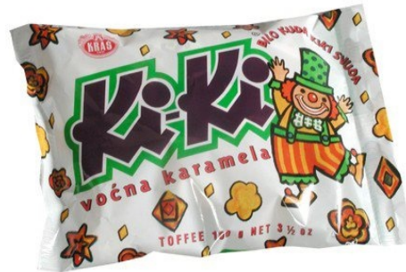
Slika 1: Starije pakiranje Ki-Ki bombona

Primjer pakiranja za djecu su Ki-Ki bomboni koji već generacijama osvajaju najmlađu populaciju svojim izgledom ali i okusom.