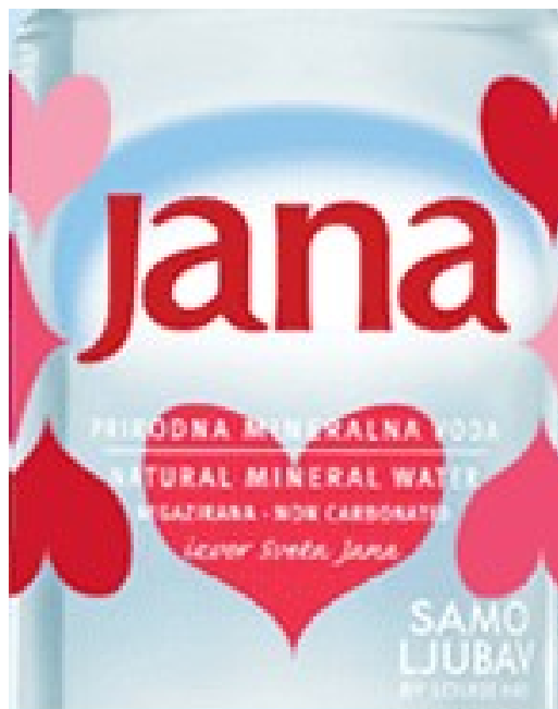
Slika 9: Janina etiketa s prednje strane