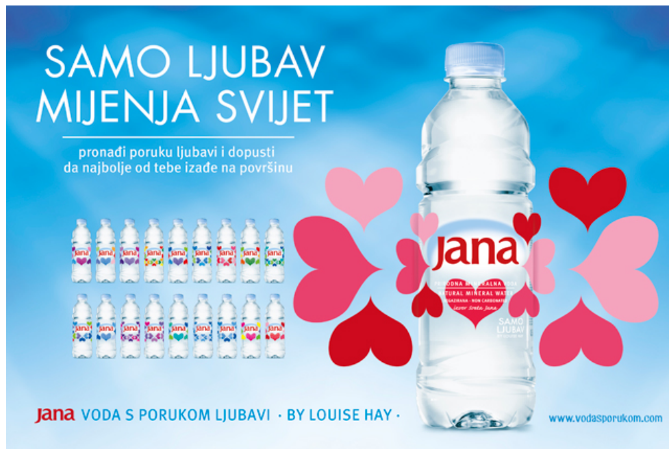
Slika 8: Novi projekt „Jana- voda s porukom ljubavi“

Ovogodišnji projekt „Jana- voda s porukom“ vođen je idejom da samo ljubav može promijeniti svijet, a limitirana edicija Jana- samo ljubav prenosi poruke ljubavi kao najvažnije i najsnažnije ljudske emocije. Poruke koje se prenose potpisuje autorica Louise Hay 39 , osnivačica pokreta samopomoći i začetnica ideje da pozitivnim stavom možemo promijeniti svoju stvarnost.