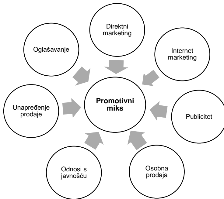
Slika 3. Elementi promotivnog miksa