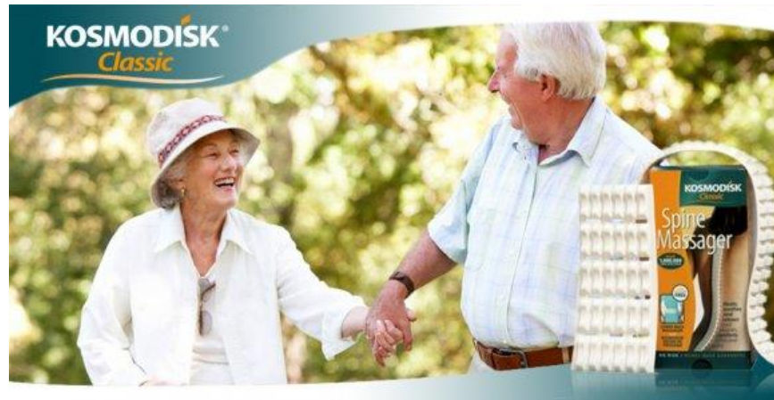
Slika 7: Kosmodisk pomagalo