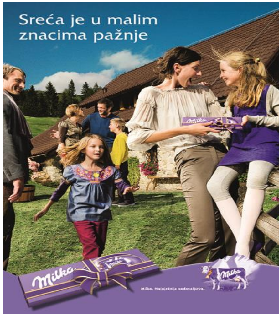
Slika 10: Milka čokolada