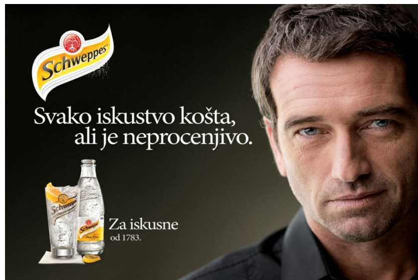
Slika 6: Schweppes osvježavajuće piće

Slika šest prikazuje reklamu za Schweppes osvježavajuće piće koje se odlično miješa i s ostalim napicima. Na slici se nalazi muškarac srednjih godina te atraktivnog izgleda. Obučen je u običnu crnu košulju koja asocira na ozbiljnost i eleganciju, a u prvom je planu njegovo približno lice. Muškarčev izraz lica asocira na muževnost i samouvjerenost. Poruka reklame je “Svako iskustvo košta, ali je neprocjenjivo.” Upravo ta poruka govori da je muškarac prošao kroz mnogo životnih situacija te su ga one dovele do iskustva koje je neprocjenjivo i koje ga čini pravim muškarcem. Slika apelira na isticanje muževnosti, karaktera i elegancije koju muškarci srednjih godina posjeduju.