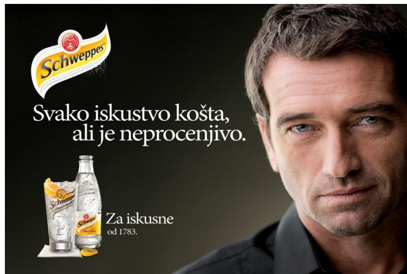
Slika 6: Schweppes osvježavajuće piće

Slika šest prikazuje reklamu za Schweppes osvježavajuće piće koje se odlično miješa i s ostalim napicima. Na slici se nalazi muškarac srednjih godina te atraktivnog izgleda. Obučen je u običnu crnu košulju koja asocira na ozbiljnost i eleganciju, a u prvom je planu njegovo približno lice. Muškarčev izraz lica asocira na muževnost i samouvjerenost. Poruka reklame je "Svako iskustvo košta, ali je neprocjenjivo." Upravo ta poruka govori da je muškarac prošao kroz mnogo životnih situacija te su ga one dovele do iskustva koje je neprocjenjivo i koje ga čini pravim muškarcem. Slika apelira na isticanje muževnosti, karaktera i elegancije koju muškarci srednjih godina posjeduju.