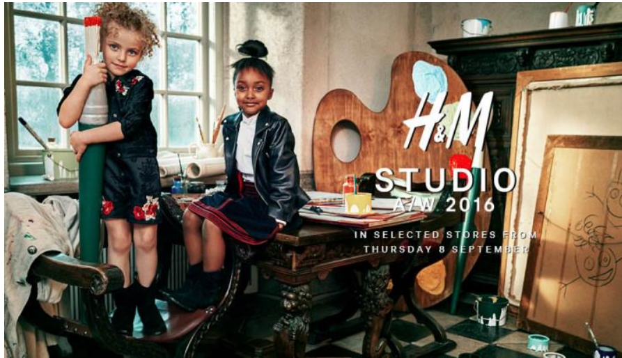
Slika 2: H&M dječja kolekcija odjeće za jesen i zimu 2016.