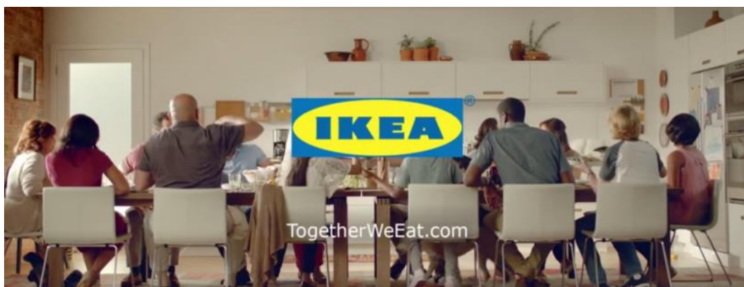
Slika 8: Jedimo zajedno

Slika osam prikazuje Ikeinu kampanju “Together we eat.” Na slici je prikazana kuhinja s velikim stolom i puno stolaca na kojima sjedi mnoštvo ljudi različitih dobnih skupina koji čine obitelj. Lica ljudi nisu prikazana već su u prvom planu njihove reakcije, odnosno različiti pokreti koji pokazuju ugodno druženje i dijeljenje zajedničkih priča. Ovom kampanjom apelira se na važnost obiteljskog druženja i povezivanja članova obitelji kroz različite aktivnosti. U modernim vremenima kada ljudi nemaju vremena zbog svakodnevnih obveza, važno je pronaći načine za zajedničko druženje i održavanje dobrih odnosa u zajednici.