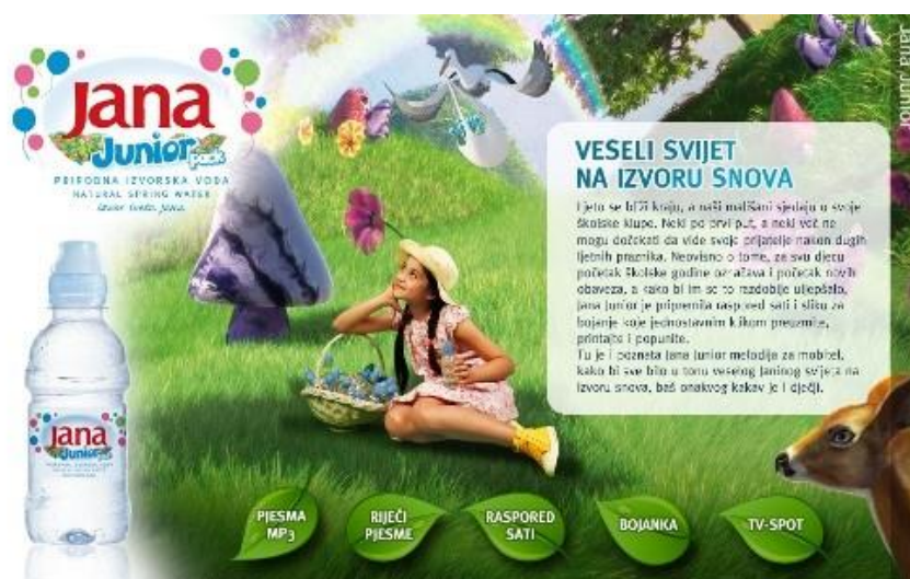
Slika 1: Jana junior