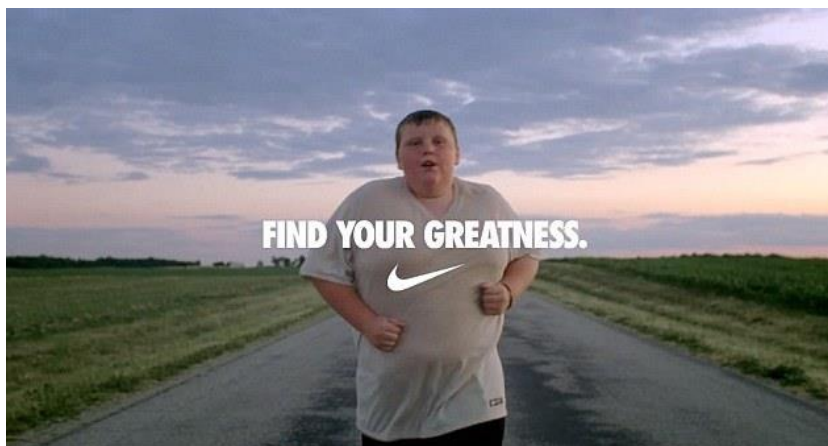
Slika 4: Nađi svoju izvrsnost