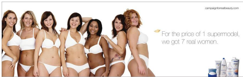
Slika 5: Prava ljepota