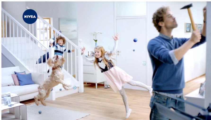
Slika 9: Nivea oglas