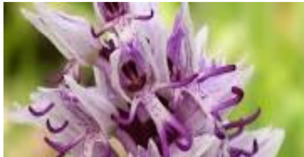
Orhideja na Kamenjaku u Premanturi