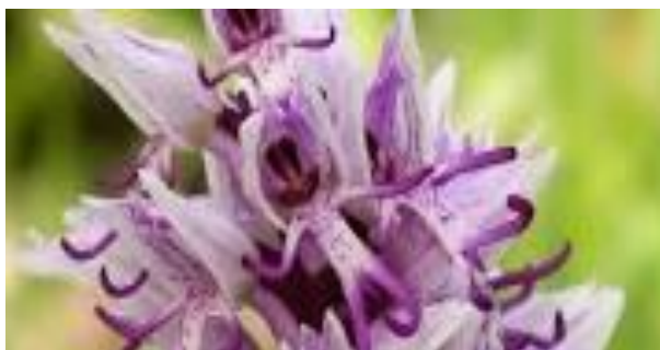
Orhideja na Kamenjaku u Premanturi