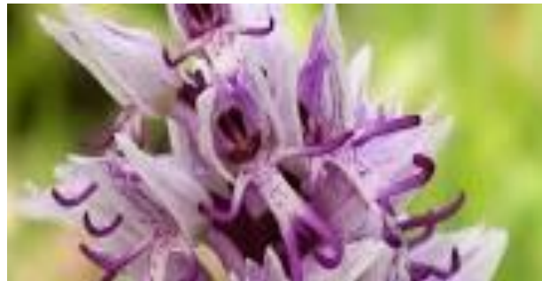
Orhideja na Kamenjaku u Premanturi