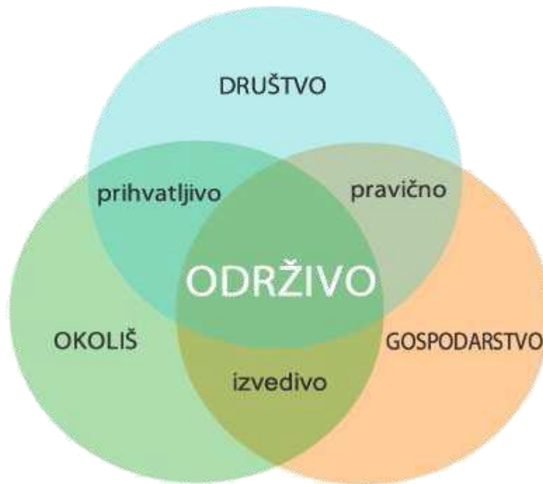
Slika 1: Elementi održivog razvoja