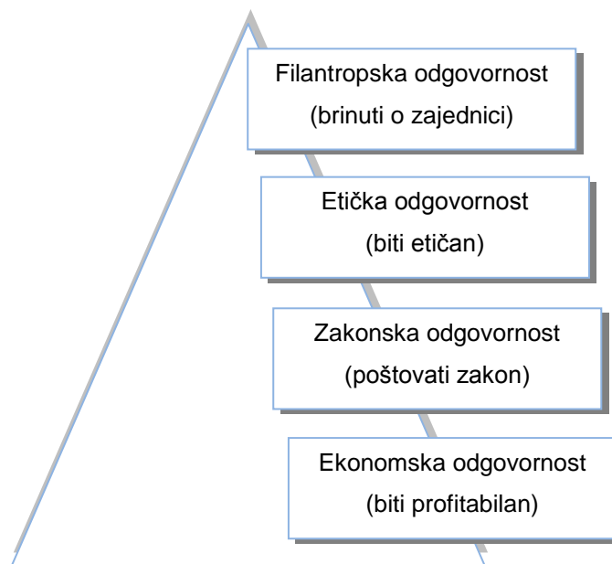
Slika 2: Carollova piramida društvene odgovornosti