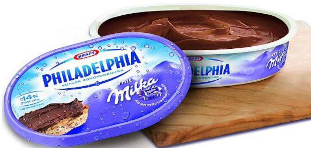
Slika 14. Philadelphia – Milka