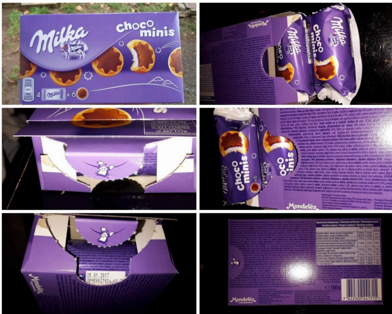
Slika 25. Milka ChocoMinis

To nas dovodi još jednog proizvoda, gdje je „Milka“ iznenadila sa svojim dizajnom pakiranja i njegovom više namjenskom funkcijom, „Milka Choco Minis“: