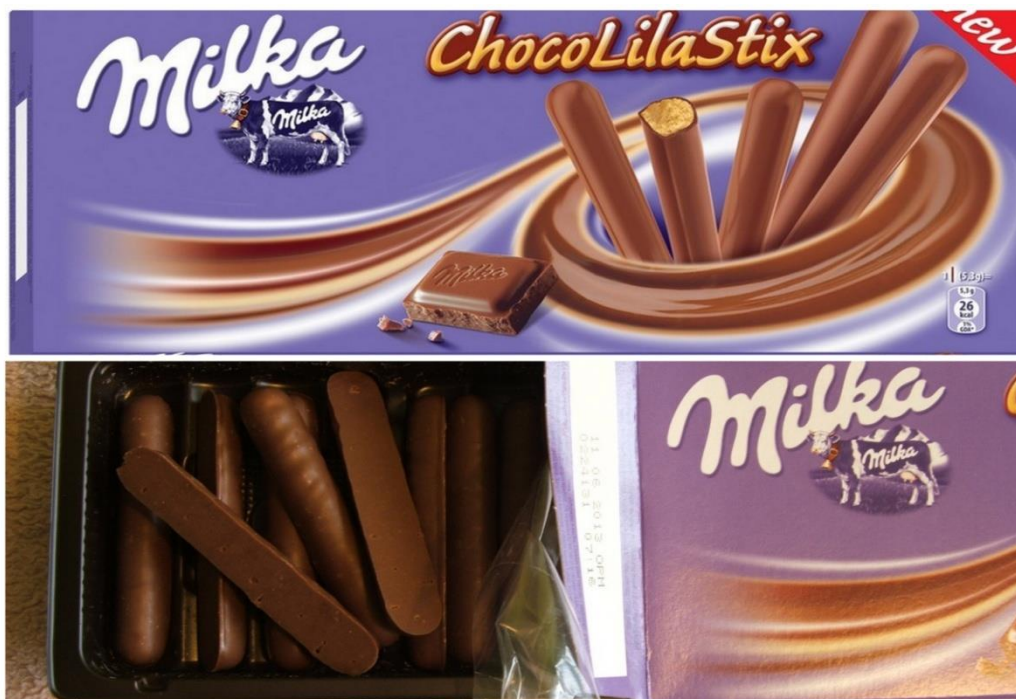
Slika 21.Milka-Choco Lila Stikx