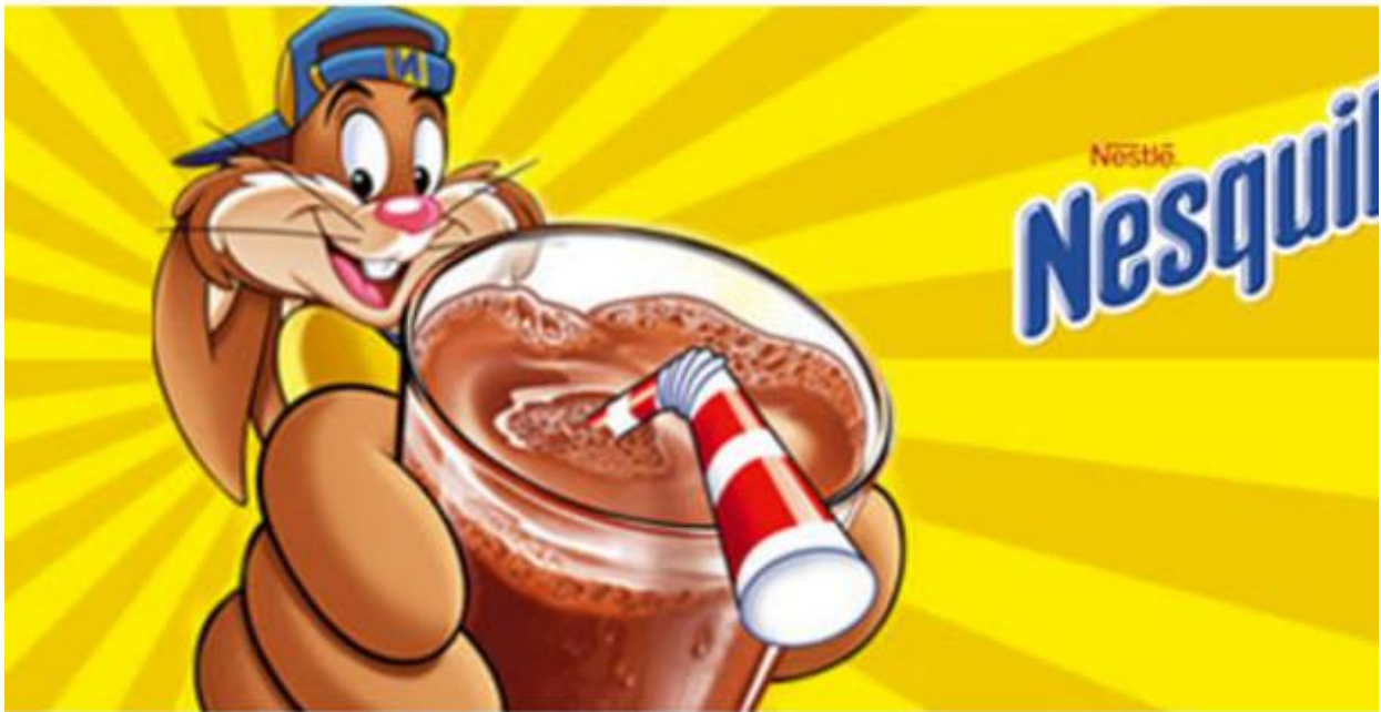
Slika 7. Nestle Nesquik-lik