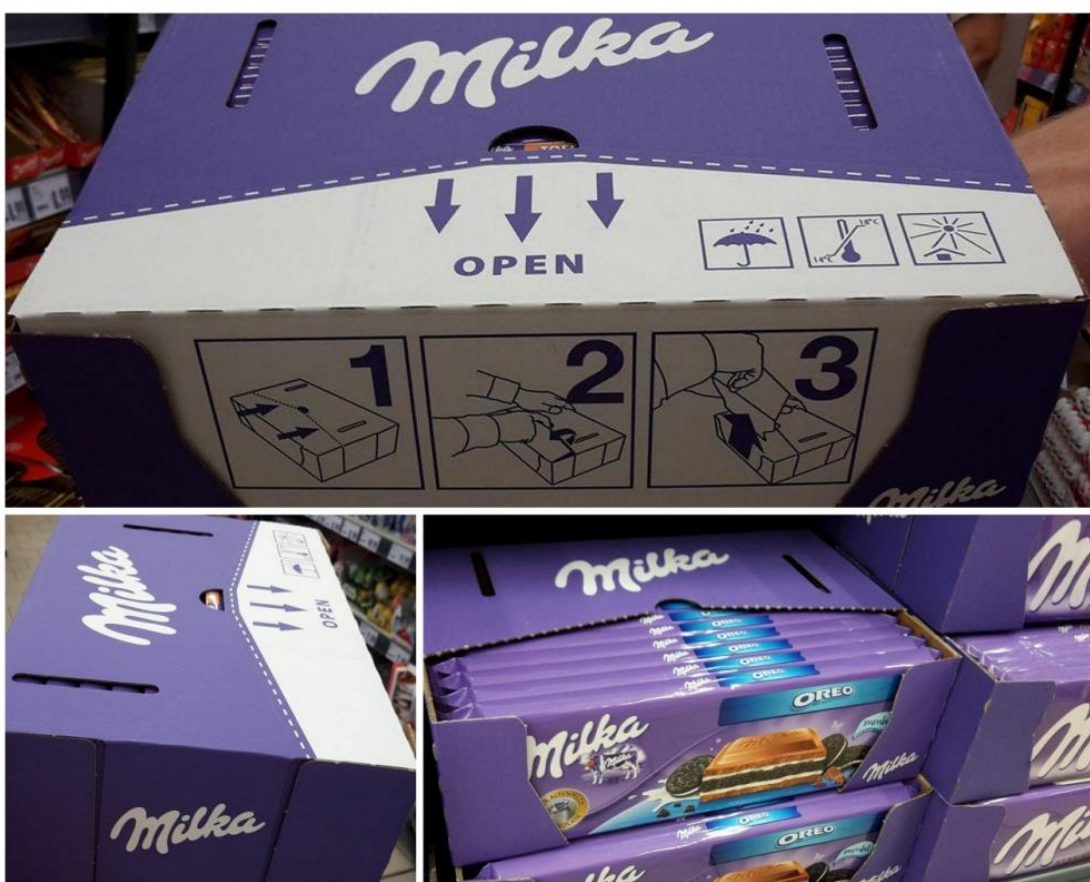
Slika 3. Sekundarno pakiranje