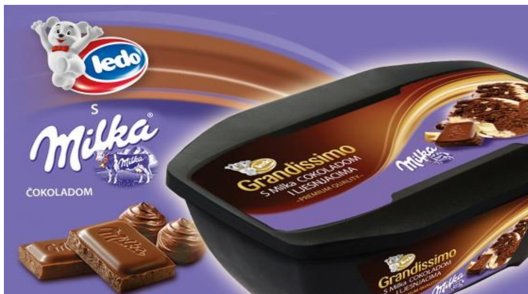
Slika 15. Ledo-Milka