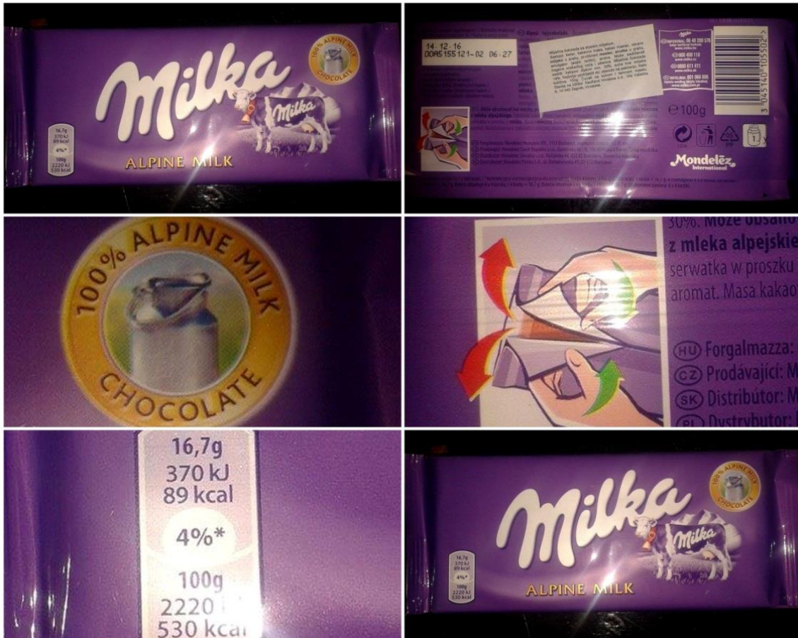
Slika 20. Milka mliječna čokolada 1000g

Od prvoga dana kada se poduzeće opredijelilo za ljubičastu boju i zatražilo pravnu zaštitu, ostala je zaštitni znak svakog proizvoda „Milke“. Možemo primijetiti da je pakiranje prvog proizvoda s kojim je stekla svoji renome i lojalnost kod korisnika istaknut ljubičastom bojom. Pakiranje ispunjava svoju glavnu funkciju zaštite proizvoda i pruža potrebne informacije o proizvodu.