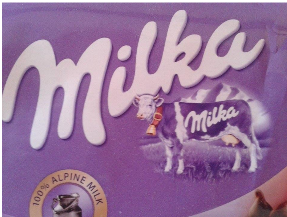
Slika 17. Milka zaštitni znak