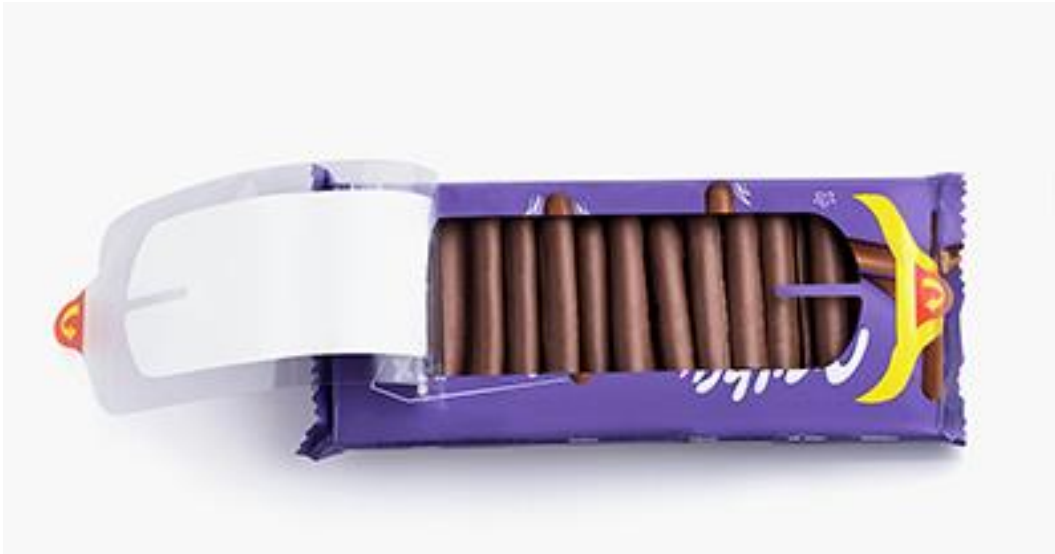
Slika 23. Lila Stix