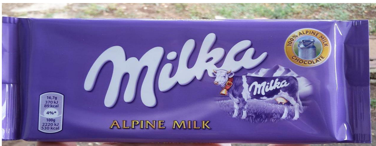
Slika 19. Mliječna čokolada 100g

Milka je razvila proizvodni splet i niz različitih proizvodnih linija kako bi zadržala tržišno vodstvo i visoku razinu lojalnosti svojih korisnika. Njeno prvo isticanje krenulo je proizvodnom linijom „Alpskih mliječnih čokolada“. Analizu pakiranja različitih linija proizvoda započeti ćemo upravo sa osnovnim i prvim proizvodom „Mliječna čokolada pakiranja 100g“, koja se razvila iz početnog proizvoda u preko 200 različitih vrsta čokolada pakiranja 100g i 300g.