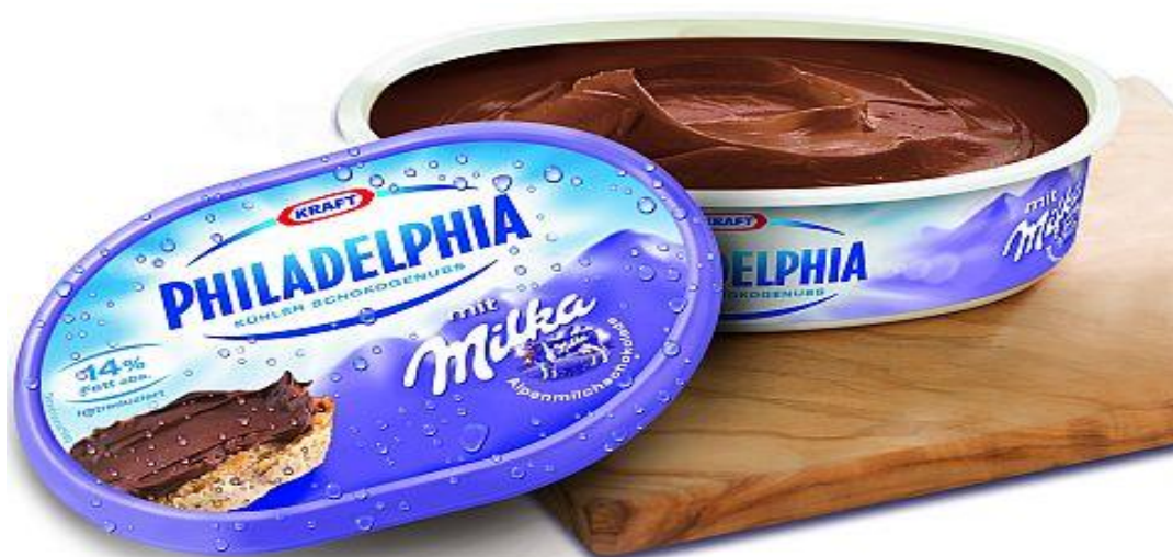
Slika 14. Philadelphia – Milka