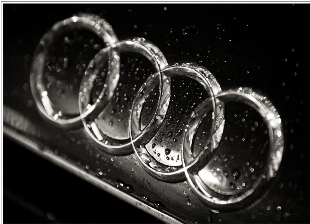
Slika 5. Audi-logo