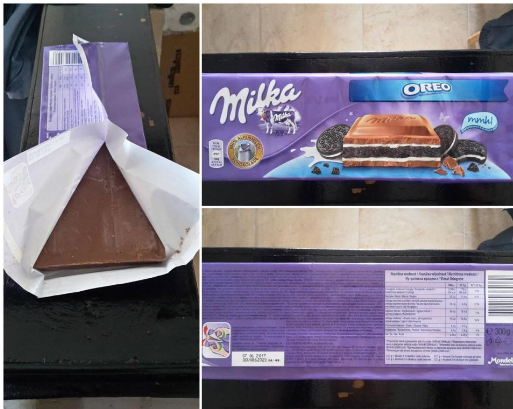
Slika 2. Primarno pakiranje

Izvor: Autor – Primarno pakiranje (Rujan, 2016.)