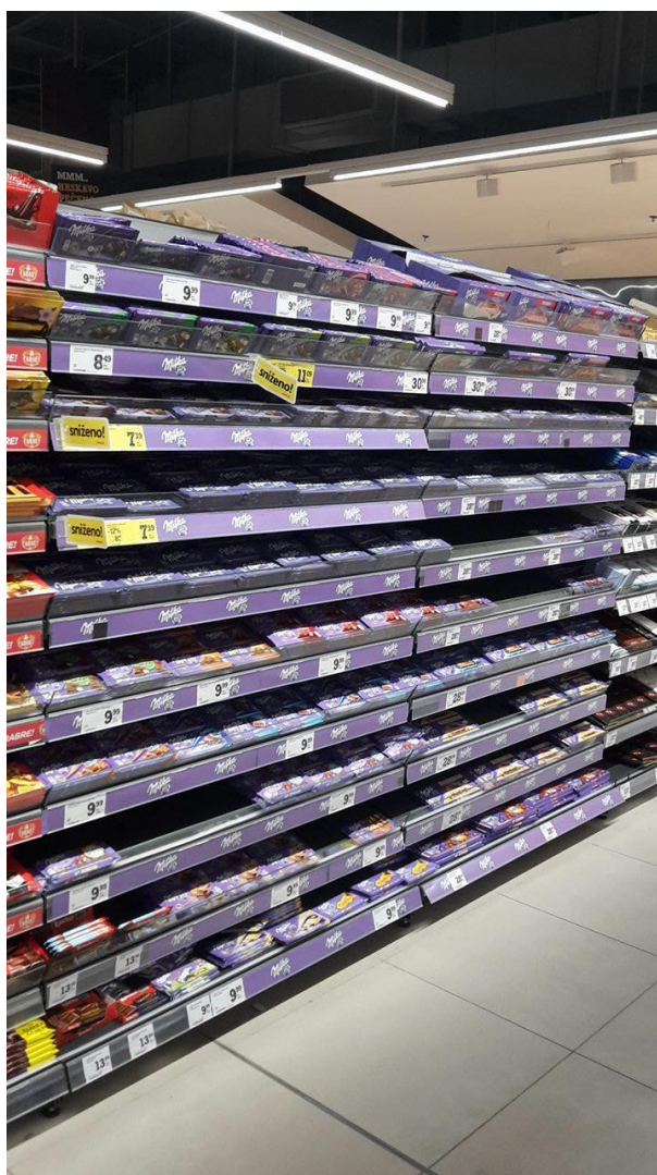
Slika 1. Efekt Jumbo plakata

Kupčeva spremnost da plati veće novčane iznose u zamjenu za praktičnost, izgled, pouzdanost i prestiž poboljšanog pakiranja što nazivamo korist za potrošača. Imidž poduzeća i markegdje pakiranje koristimo za trenutno prepoznavanje poduzeća ili marke, odnosno u samoj trgovini možemo stvoriti efekt Jumbo plakata kao što to čini „Milka“ sa svojom poznatom ljubičastom bojom pakiranja koja se ističe u svakoj trgovini i svi njeni proizvodidolaze do izražaja na policama. Mogućnostinovacija odnosno jedinstvena i inovativna pakiranja mogu pružiti velike koristi potrošačima i profite proizvođačima. 3