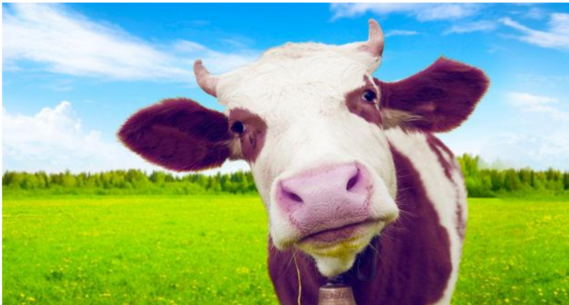
Slika 11. Milka- Lila krava