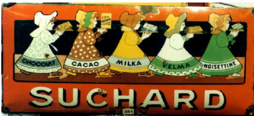
Slika 9. Suchard – Milka