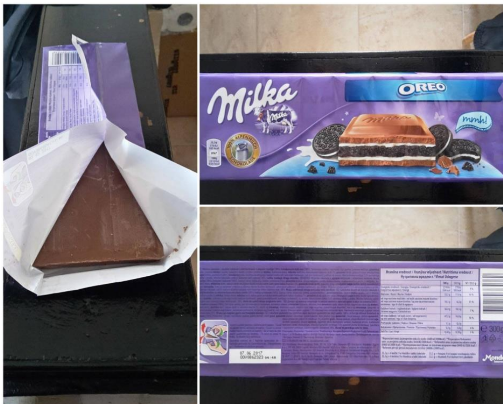
Slika 2. Primarno pakiranje

Izvor: Autor – Primarno pakiranje (Rujan, 2016.)