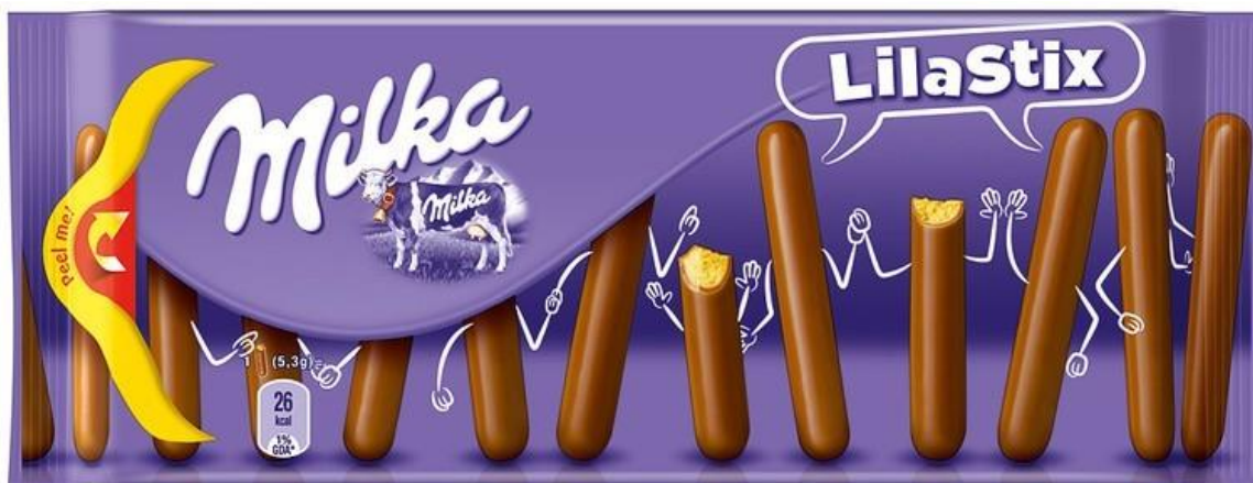
Slika 22. Lila Stix New