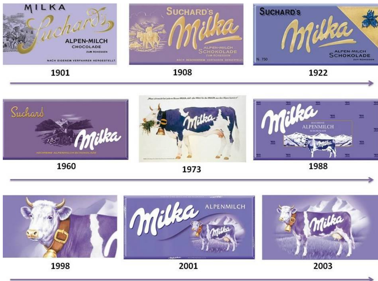
Slika 16. Milka – razvoj marke