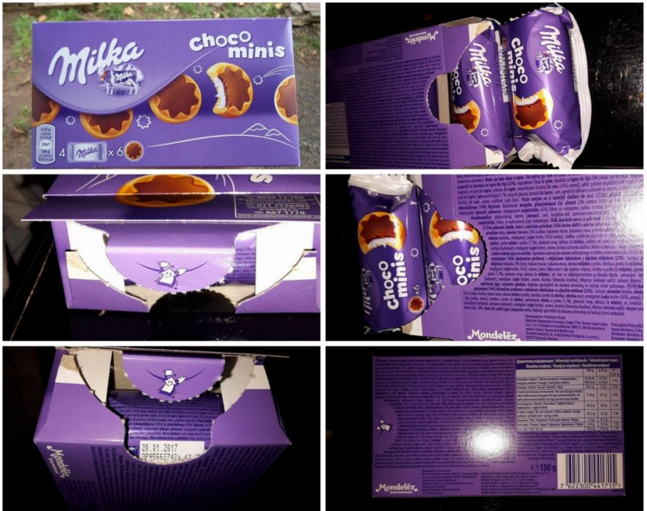
Slika 25. Milka ChocoMinis

To nas dovodi još jednog proizvoda, gdje je „Milka“ iznenadila sa svojim dizajnom pakiranja i njegovom više namjenskom funkcijom, „Milka Choco Minis“: