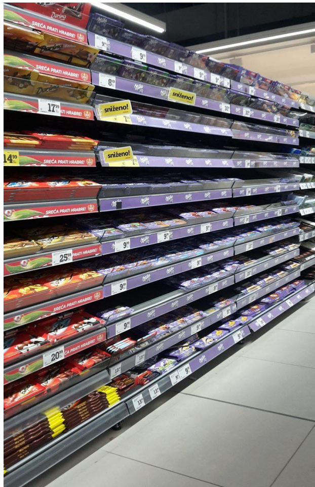
Slika 12. Prikaz efekta Jumbo plakata