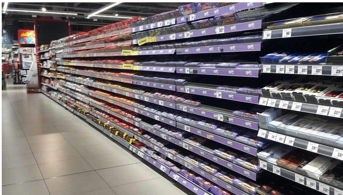
Slika 13. Milka proizvodni splet