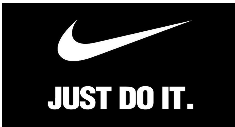
Slika 4. Nike – slogan i logo