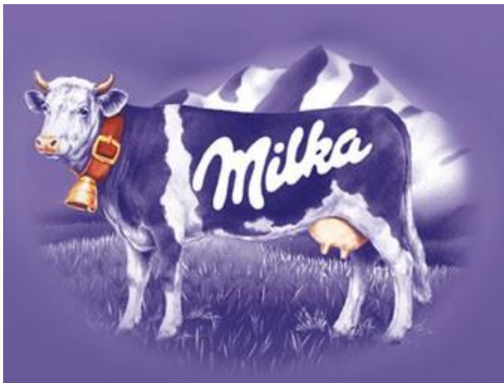
Slika 8. Lik Milka – Ljubičasta kravica