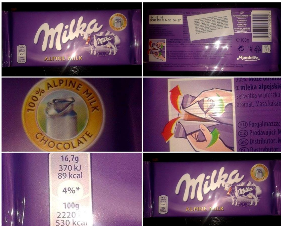
Slika 20. Milka mliječna čokolada 1000g

Od prvoga dana kada se poduzeće opredijelilo za ljubičastu boju i zatražilo pravnu zaštitu, ostala je zaštitni znak svakog proizvoda „Milke“. Možemo primijetiti da je pakiranje prvog proizvoda s kojim je stekla svoji renome i lojalnost kod korisnika istaknut ljubičastom bojom. Pakiranje ispunjava svoju glavnu funkciju zaštite proizvoda i pruža potrebne informacije o proizvodu.