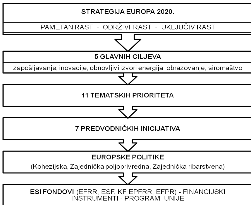
Slika 1: Strategija Europa 2020.