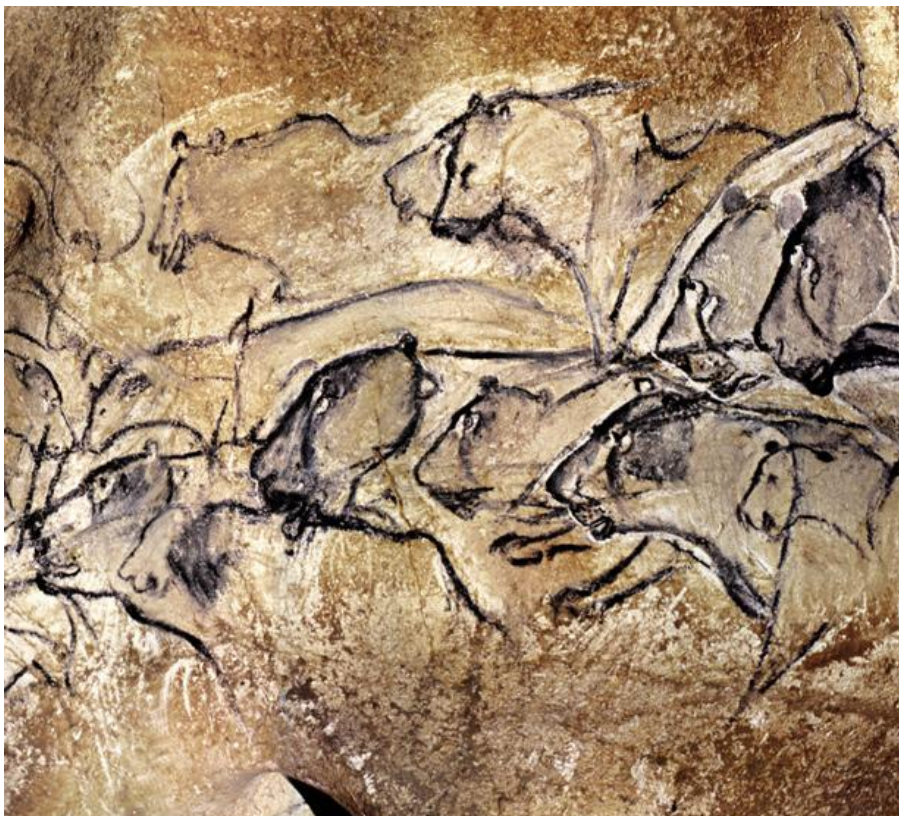
Slika. 5. Prikaz lavova na stijeni, špilja Chauvet, Francuska.

Vrlo karakterističan primjer je figura od bjelokosti mamuta pronađena na njemačkom lokalitetu Hohlenstein-Stadel koja prikazuje ljudsko biće s glavom lava. 41 Nastala je nešto kasnije nego slika u Chauvetu. Stara je oko 32.000 godina. Visina joj je 28,1 cm, a širina 6,3 cm. Pronađena je u nekoliko dijelova, dok djelovi prednjeg dijela tijela nedostaju. Stav i mišićavost čovjeka ukazuju da stoji na vrhu prstiju s rukama na bokovima. Lijeva nadlaktica označava rezove koji bi mogli predstavljati tetovaže ili ožiljke. Glava gleda prema naprijed, dok pogled naglašava snažne linije čeljusti sa uspravnim ušima. Postavlja se pitanje je li to čovjek koji je nosio “lavlju frizuru” ili neko nadnaravno biće. 42