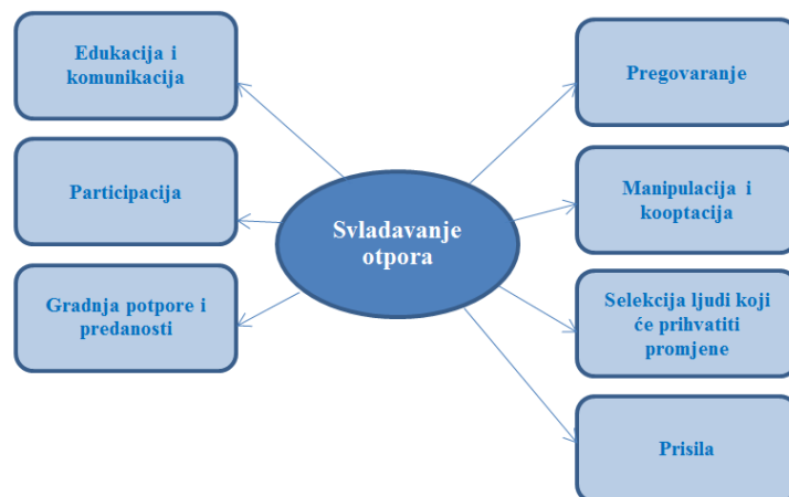
Slika br. 6: Svladavanje otpora