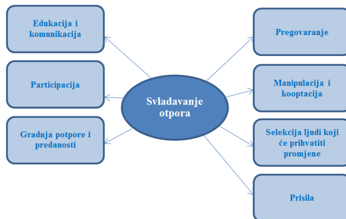
Slika br. 6: Svladavanje otpora