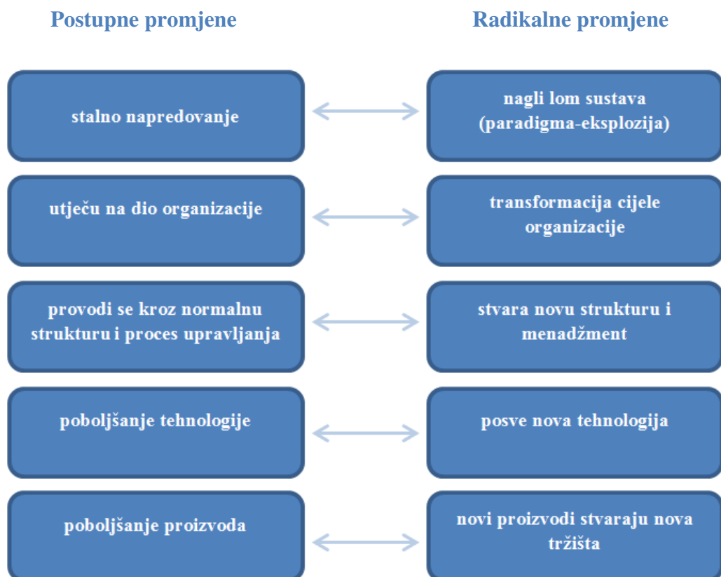
Slika br. 2: Razlika između radikalnih i postupnih promjena

Izvor: Izrada autora prema Sikavica, P. (2011.). Organizacija . Zagreb: Školska knjiga d.d., str. 697