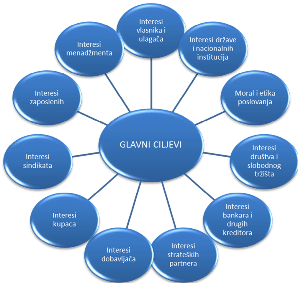
Slika 3: Povezanost interesa interesno-utjecajnih skupina s glavnim ciljevima

Izvor: Tipurić, D.: Korporativno upravljanje , Zagreb, Sinergija nakladništvo, 2008., str. 27.