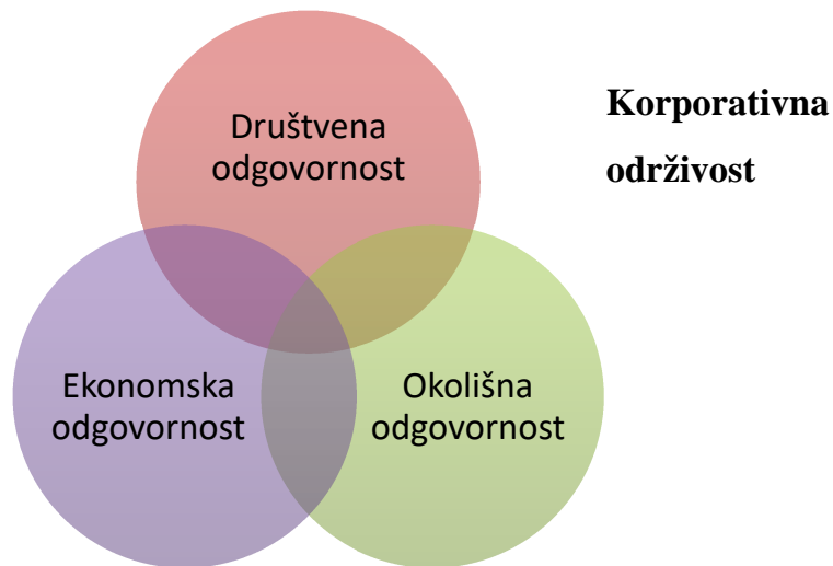
Slika 1: Odnos korporativne održivosti i društveno odgovornog poslovanja