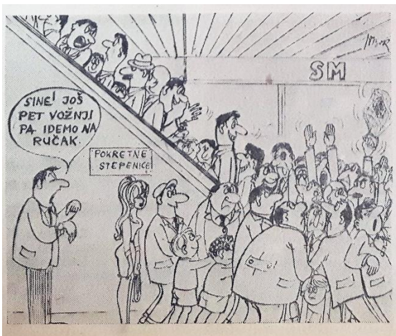
Slika 4: Pokretne stepenice, Supermarket, Glas Slavonije , 1967.

Supermarket je skoro izgorio 1973., no zahvaljujući noćnom čuvaru tragedija je izbjegnuta ovoga puta, no ne i 1982. kada je doista izgorio. 119 Supermarket je privlačio potrošače zbog svoga širokog asortimana, ali i jeftinijih cijena. Cijene su bile najniže u gradu, posebice mesa kao što je to bila svinjetina, junetina i govedina. 120 Usluge i prodavaonice koje su se mogle naći upotpunilo je otvaranje pošte koja je obavljala sve poštanske usluge, osim primopredaje paketa. Pošta nije mogla biti otvorena prilikom otvaranja jer nije bila predviđena planom. Naknadno je uvedena javna govornica i preinake vezane za osiguranje poštanskih pošiljaka. 121