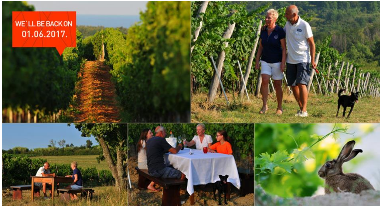
Slika 6. Ponuda „ Back to nature “