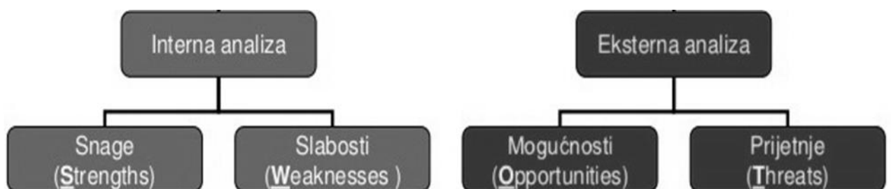
Slika 1. SWOT analiza