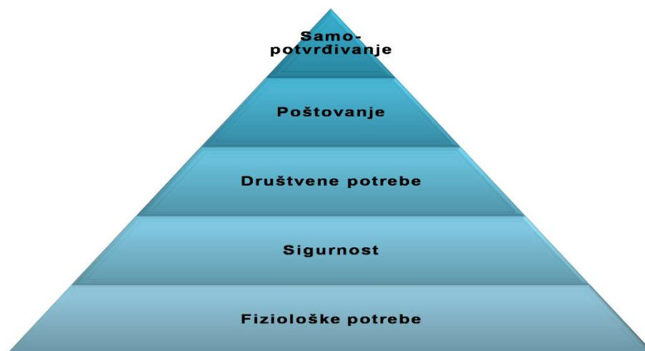
Slika 3: Hijerarhija potreba prema Maslowu