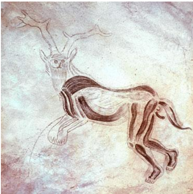
Slika 1.: Čarobnjak – lik prvog maskiranca