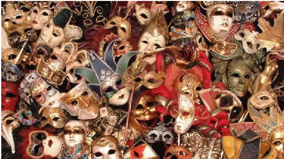
Slika 3.: Venecijanske maske