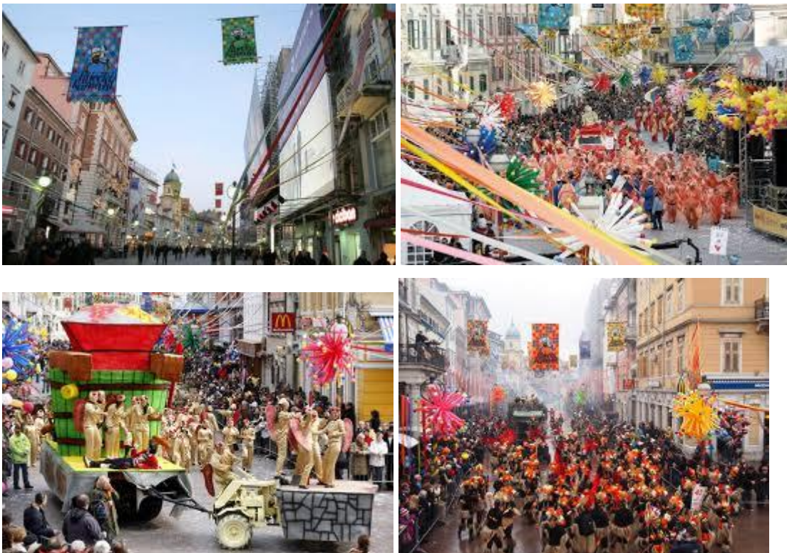
Slika 7.: Živopisno karnevalsko događanje u Rijeci