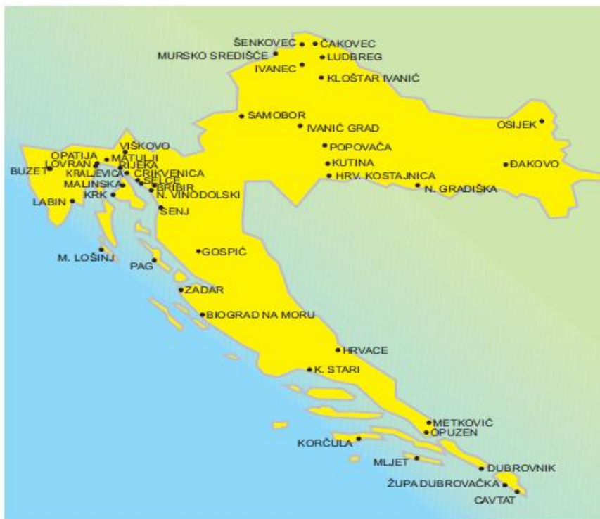
Slika 5.: Hrvatski karnevalski gradovi