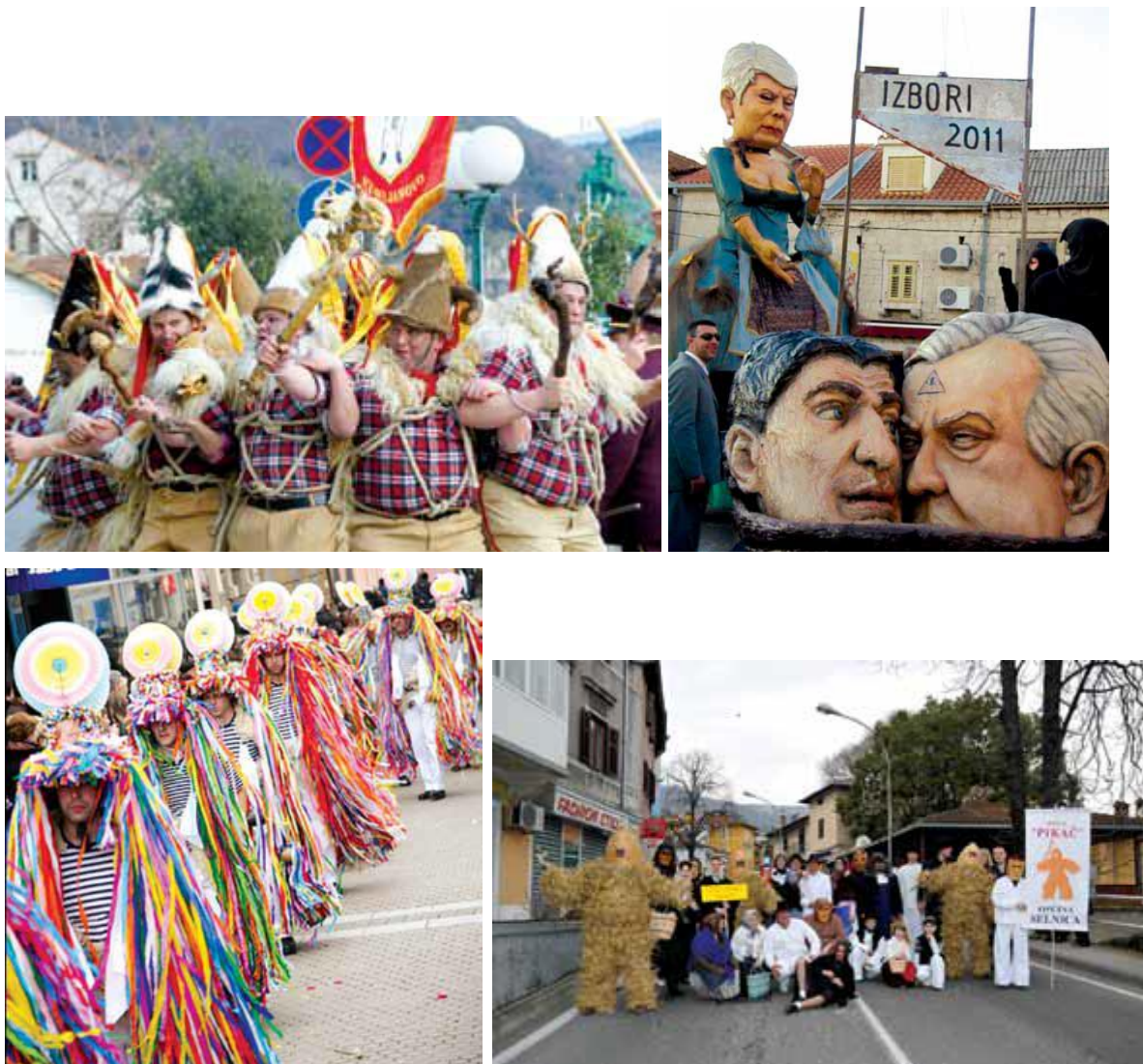
Slika 6.: Nekoliko karnevalskih likova iz različitih hrvatskih gradova