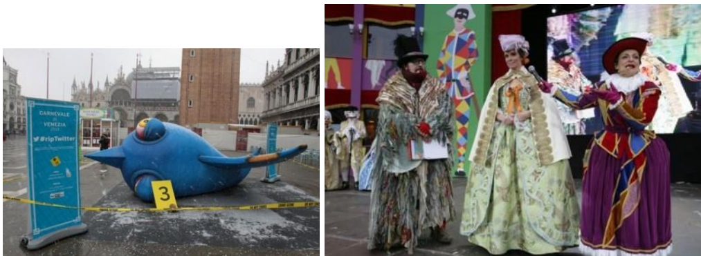
Slika 9.: Karneval u Veneciji

Od 1979. godine svake su godine kostimi bogatiji, a proslave spontanije. Dobro raspoloženje Venecijanki šokantno je za mnoge strance. Venecijanski dar za intrige dolazi na svoje za vrijeme karnevala, slikoviti festival prethodi korizmenom odricanju. Maske i kostimi imaju ključnu ulogu u tom svijetu anonimnosti; društvene podjele su razriješene, sudionici uživaju u psinama, a sve je dopušteno. Priređuju se raskošni balovi, a onaj glavni, veliki bal koji se svake godine događa u drugoj palači naziva se Duždev bal. Njemu mogu pristupiti samo ljudi s prikladnim baroknim kostimom kakav se ne može kupiti za manje od tisuću eura. Zainteresirani za taj bal moraju znati korake qadrille i drugih stoljećima starih plesova te biti spremni izdvojiti 200 eura za ulaznicu. Venecijanci drže da su ti maskirani balovi samo teške hedonističke perverzije. Pravi Venecijanci rijetko idu na takve balove. 58