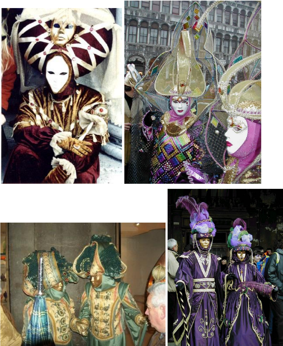
Slika 8.: Maske iz Venecije