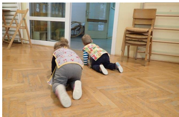
Slika 2. Spontano puzanje po dvorani