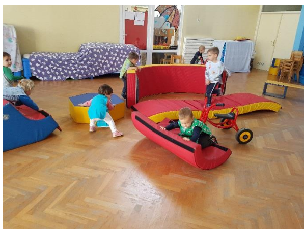
Slika 11. Djeca samostalno slažu poligon

Zapažanje: Primijetila sam da djeca u slobodnoj igri rado i sama slažu poligone od spužvastih elemenata, stolica, obruča, odnosno od svega što im je na raspolaganju.