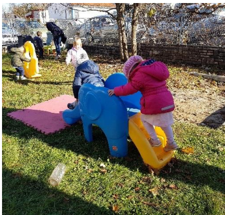
Slika 31. Igralište za djecu rane dobi