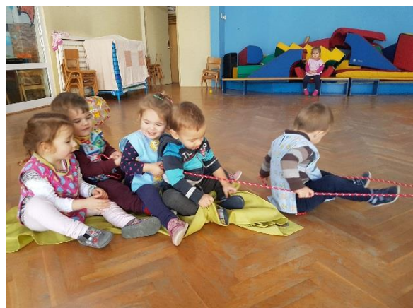
Slika 9. Povlačenje na tkanini konopom