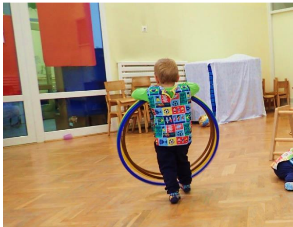
Slika 20 Pospremanje dvorane

Kako bi izbjegli naguravanje i uvježbali izlazak iz dvorane jedan po jedan, odgajatelj bi na vratima „dizao rampu“ i redom propuštao „vagone vlaka“ koji su odlazili na pranje ruku.