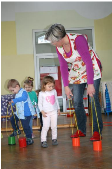
Slika 17. Hodanje na lončićima

Tako npr. glavna aktivnost je bila hodanje po penjalici uz asistenciju odgajatelja, a sekundarne su bile tricikli, lopte i spužvasti elementi za ljuljanje. Djeca koja su bila zainteresirana za glavnu aktivnosti sama bi dolazila i vježbala dokle god je trajao interes, a ostalu djecu bi odgajatelj pozvao jednog po jednog i obično bi se svi odazvali. Ostala djeca bi istraživala i eksperimentirala s ponuđenim sekundarnim sadržajem. Istraživanje i sudjelovanje je bilo kvalitetnije kad bi se odgajatelj uključio u igru.