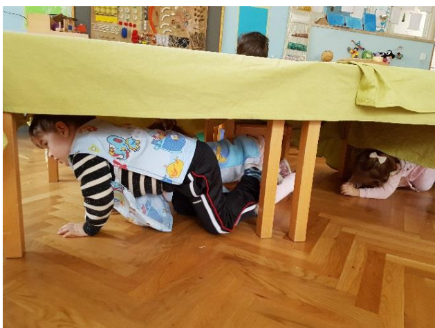
Slika 25. Poligon u sobi