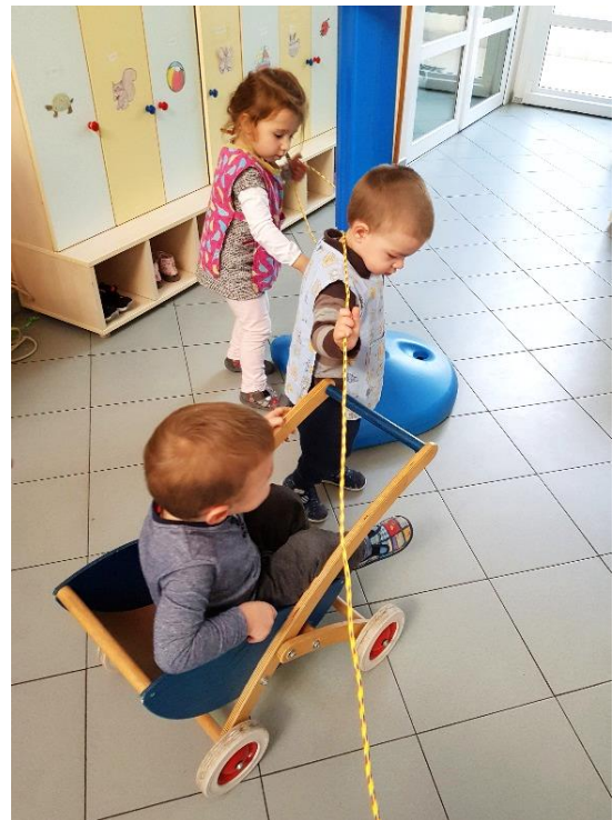
Slika 27. Igre špagom u hodniku

tematsko vježbanje (hodanje po špagi, hodanje s predmetom na glavi, ubacivanje lopte u koš/kutije, trčanje) i spontano vježbanje s obzirom da su se u hodniku nalazili mali tobogan i tuneli.