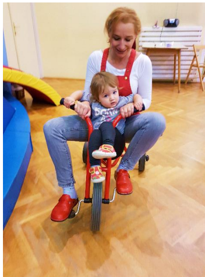
Slika 19. Vožnja na triciklu