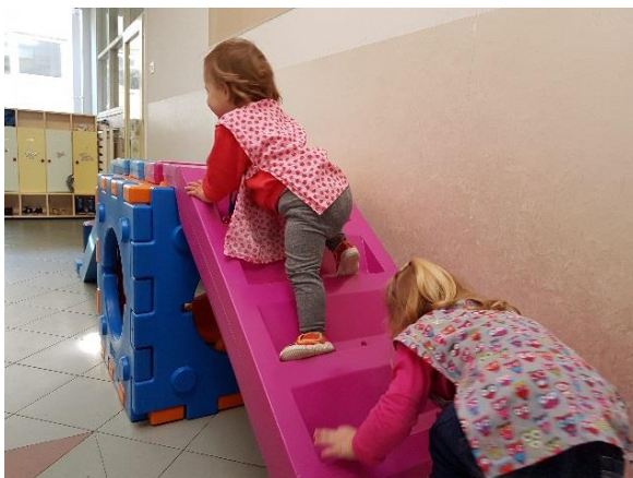
Slika 14. Igra na toboganu u hodniku ustanove

„Spontano vježbanje odnosi se na neplanirane tjelovježbene aktivnosti djece predškolske dobi koje ona provode samoinicijativno bez organizacije voditelja.“ (Neljak, 2009:67). To su jednostavni motorički zadaci (spuštanje po toboganu, skakanje po lokvicama, vrtnja, trčanje) koji se spontano pojavljuju i isto tako nestaju kad se dijete zasiti ili mu pažnju privuče nešto drugo. Osim zabavi služe razvoju motoričkih sposobnosti i znanja. Ovo je najčešći oblik aktivnosti u ranoj dobi i on velikog je značaja za dječji razvoj, jer malo dijete najviše usvaja motoričke vještine tijekom slobodne igre.