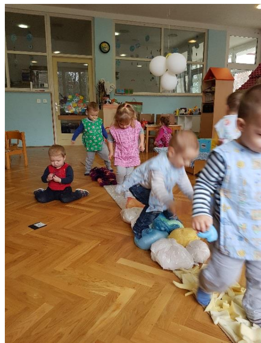
Slika 24. Hodanje po senzornom tepihu

Iako soba nije najbolje rješenje za vježbanje, zbog toga što je prostor ipak ograničen namještajem i igračkama, te kretanje nije tako slobodno, a pažnja zbog raznih poticaja u okolini lakše odluta, to ne znači da u nedostatku adekvatnijeg prostora ne možemo vježbati i u sobi. Često su sobe dnevnog boravka ranog odgoja opremljene malim toboganima, tunelima, spužvastim elementima kao što su valovi, stepenice, kosine, sobna kadica za njihanje i slično. U tako opremljenim sobama djeca u svakom trenutku mogu zadovoljiti svoje potrebe za pokretom. No i u slučaju kad to nemamo ili želimo stvoriti nove poticaje, uz