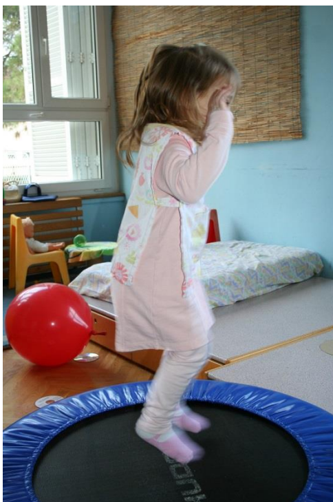
Slika 6. Skokovi na mini trampolinu

Dijete počinje skakati na mjestu u dobi od oko 2 godine. Mlađe dijete neće ni