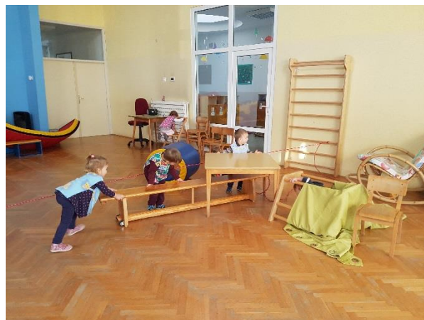
Slika 12. Djeca samostalno slažu poligon