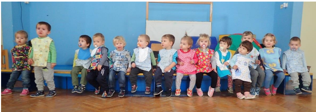
Slika 16. Djeca čekaju na klupici početak sata vježbanja

Sat započinjemo okupljanjem na klupici ili do zida, jer je pojam vrste za njih još pretežak, te je bolje da imaju fiksni orijentir kao što je zid ili klupica. Kako bi učvrstili rutinu, u Pačićima na početku sata recitiramo. „Dobar dan teta dvorana. Jedan, dva, tri, Pačići smo mi!“.