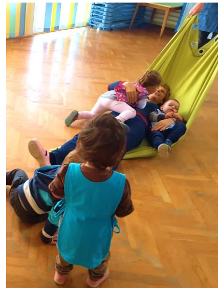
Slika 18. Povlačenje na tkanini