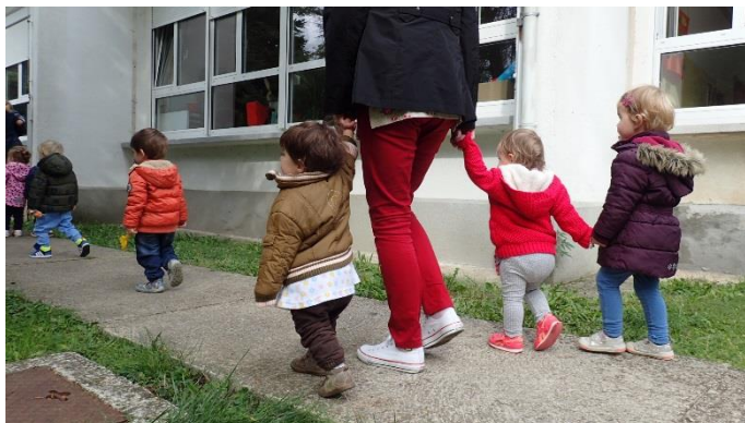
Slika 23. Skupina „Pačići“ u šetnji oko zgrade ustanove