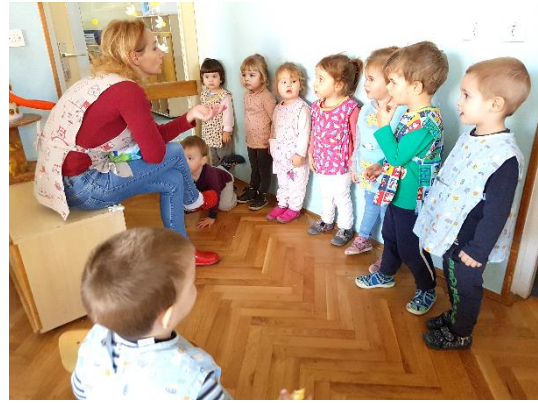
Slika 15. Pripreme za odlazak u dvoranu

Prije uvodnog sata djecu okupljamo u sobi, te ponavljamo pravila ulaska u dvoranu (npr. Sve igračke i tješilice ostaju u sobi. Svi ulazimo polako, bez guranja i sjedamo na klupicu). Što manje pravila postavimo, djeca će ih lakše usvojiti. U praksi treba neko vrijeme da djeca prihvate ovu rutinu, a koliko, ovisiti će o pojedinoj skupini.