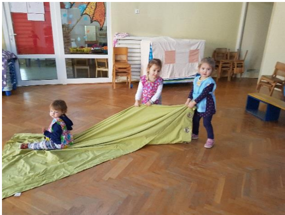
Slika 10. Međusobno povlačenje na tkanini

Ove aktivnosti za djecu predškolske dobi su prilično naporne, te je potreban oprez kod izvođenja. Najbolje je da su ove aktivnosti kratke i pod kontrolom odgajatelja. Djeca mogu vući predmete različite težine i veličine, što se često i spontano događa (razne kutije, kolica, igračke na špagi). Ponekad i djeca ove dobi mogu surađivati i zajedno vući ili gurati predmete. Najbolje je kad se vježbe izvode s obje ruke.