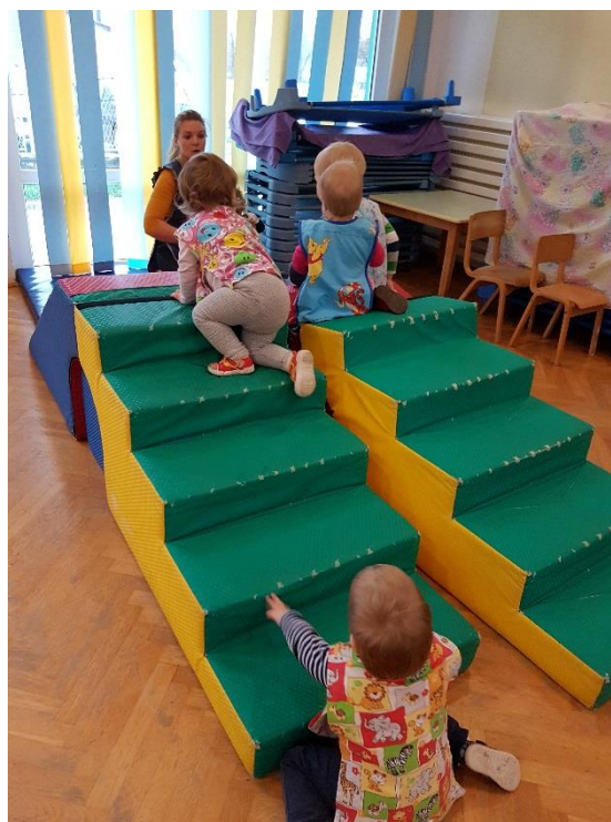
Slika 5. Penjanje po spužvastim stepenicama

Penjanje se smatra oblikom kretanja i važna je točka u tjelesnom razvoju djeteta. Dio je prirodnog zdravog razvoja i dijete će čim prohoda pokazati interes za penjanje. Djeca rane dobi obožavaju penjanje i nagonski su penjači, te obično ga nije potrebno poticati ili podučavati, već samo osigurati sigurno mjesto za penjanje i nadzirati dijete. Ova aktivnost pomaže djetetu da svijet sagleda iz drugog kuta, te ćemo uočiti kako se dijete rane dobi se penje se po svemu – stolicama, stolovima, ormarima i sl. Penjanjem ono jače mišiće trupa, ruku i nogu, te razvija snagu i motoriku šake, što je važno za mnoge životne aktivnosti u koje spada i pisanje. Penjući se dijete pozitivno utječe na razvoj ravnoteže, koordinaciju pokreta i koordinaciju oka i ruke. Sanders smatra da je penjanje u odgojnim ustanovama zanemareno, te da treba ukazati na njegovu važnost (Sanders, 2016). U svojoj knjizi ukazuje na studiju koju je prenio The Guardian, a koja je pokazala kako su desetogodišnjaci testirani 2008. mogli napraviti manje trbušnjaka, te su im bile smanjene sposobnosti penjanja i visa nego njihovim vršnjacima 1998. (Sanders, 2015).