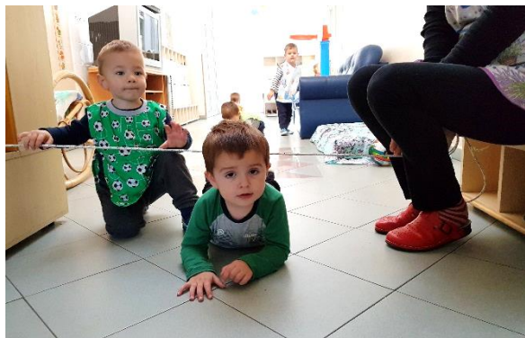
Slika 1. Provlačenje ispod špage

istezanje, npr. pljesnuti iznad glave. Puzati se može u različitim smjerovima po različitim podlogama (klupi, po tlu, po niskoj gredi), mogu se provlačiti ispod/kroz različitim prirodnih i umjetnih prepreka, ali moramo paziti da higijenski uvjeti budu odgovarajući (čisto tlo, strunjača, suh travnjak). (Findak i Delija, 2001). Puzati još možemo i uz kosinu, niz kosinu, oko prepreka, gurajući predmet ispred sebe i sl.