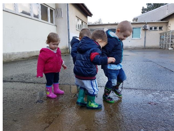
Slika 13. Skakanje po lokvicama u šetnji

Aktivnosti koje dijete samoinicijativno započinje i provodi nazivamo još nestrukturirane aktivnosti, dok aktivnosti inicirane ili usmjeravane od strane odrasle osobe nazivamo strukturiranim. U ranoj dobi strukturirane i nestrukturirane aktivnosti se stalno isprepliću. Tako na primjer dijete koje se u jednom trenutku slobodno penjalo po