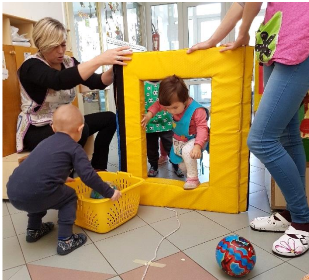
Slika 28. Provlačenje u hodniku

Tijekom prakse u Pačićima često smo koristili hodnik za tjelovježbu, posebno za