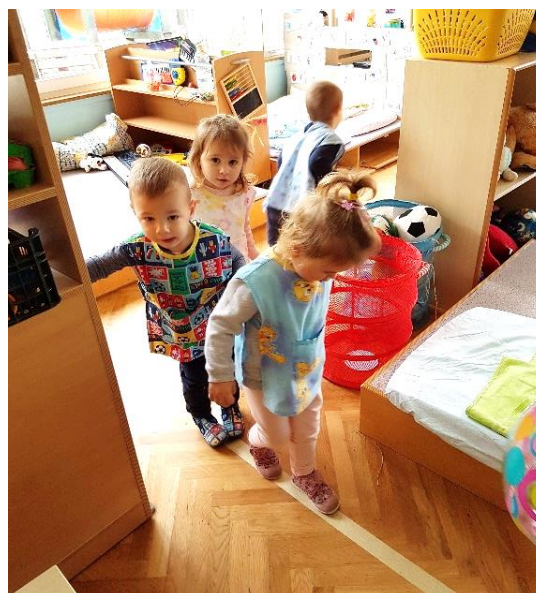
Slika 26 Poligon u sobi

Soba dnevnog boravka obično ograničava trčanje, te je odlično je mjesto za uvježbavanje različitih načina hodanja (hodanje u koloni, hodanje s promjenom smjera, hodanje po ravnoj ili cik cak liniji, hodanje u čučnju, hodanje uz udaranje ritma i sl.), provlačenja, za pjesmice uz pokret koje ne zahtijevaju mnogo prostora, igre kao što su Dan-noć, kuglanje, gađanje u metu ili ubacivanje i sl. Tijekom praktičnog rada u sobi s djecom sam provodila i senzomotoričke vježbe hodanja bosih nogu po različitim površinama.