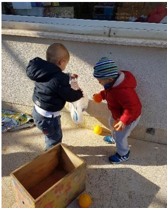
Slika 30. Igra na otvorenom

Strastvenim penjačima kakva su mala djeca na dvorištu treba osigurati i prostor za penjanje. U podnožju penjalica treba biti mekana površina, a uz širok niski tobogan dobro bi bilo imati i kratki tunel. Na otvorenom se djeca rado voze različitim guralicama, igračkama vozilima, triciklima, biciklima bez pedala. Ako postoji staza za vožnju, bolje je da ide ukруг nego da je ravna. Ljuljačka treba biti smještena dalje od prostora za šetnju, staze za vozila i ograde igrališta. Sjedala ljuļačke trebaju biti mekana sa sigurnosnim remenom, a tijekom ljuļjanja potreban je nadzor odraslih. Bilo bi dobro da igralište još sadrži pješćanik i prostor za igre s vodom i raznim materijalima.