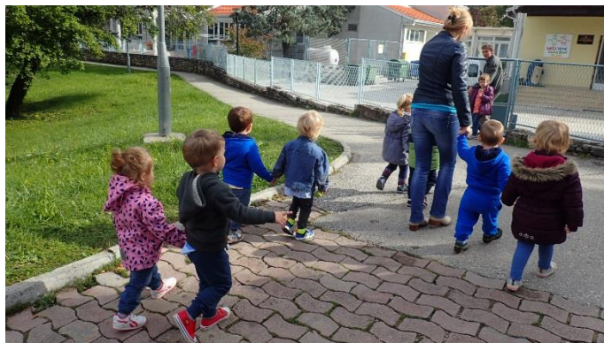
Slika 22. Skupina „Pačići“ u šetnji izvan kruga ustanove

Hodanje u parovima djecu umara, pa je stoga za mlađu skupinu predviđeno vrijeme 10 do 15 minuta (za skupinu ranog odgoja nije pronađen podatak).