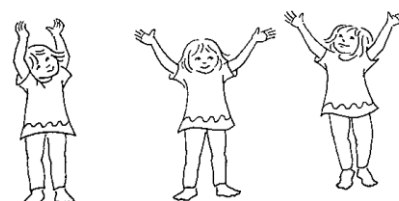
Slika 32 – Djeca u različitim položajima istezanja (Pica, 2014,