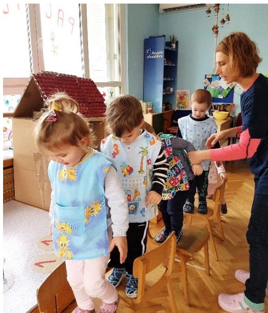
Slika 25. Poligon u sobi

pomoć stolica, stolova, špage, kartonskih kutija, ljepljive trake i ostalih materijala na raspolaganju, soba se vrlo lako pretvara u poligon za vježbanje.