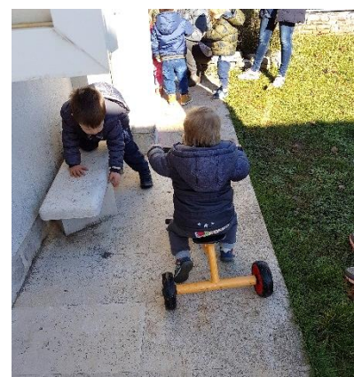
Slika 29. Dijete vozi guralicu

Da bi se izbjegle nezgode i ozljede potrebno je da sama izvedba i uređenje igrališta zadovoljavaju kriterije sigurnosti. Zato igralište za djecu rane dobi treba biti odvojeno od dijela namijenjenog starijoj, motorički spretnijoj djeci. Potrebno je redovito pregledavati prostor i ukloniti sve potencijalno opasne materijale i predmete. Igralište treba biti ograđeno i prekriveno materijalom koji će ublažiti posljedice pada (Nenadić, 2002). Na igralištu za djecu rane dobi mogu se provoditi organizirani i spontani oblici vježbanja.