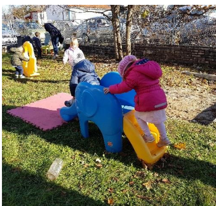
Slika 31. Igralište za djecu rane dobi