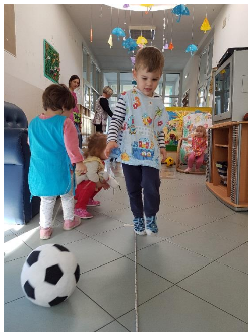
Slika 3. Hodanje po špagi

Stupanje je dobar način za razvoj ravnoteže i koordinacije, te osjećaja za ritam. Odgajatelj stupanje uvodi u tri koraka. Prvo pokazuje djeci kako visoko dizati koljena za vrijeme hoda, nakon toga uvodi glazbu s izraženim ritmom i na kraju uvodi pljeskanje ili udaranje štapićima u ritmu. Igra koja se može koristiti kod istraživanja različitih načina hodanja je