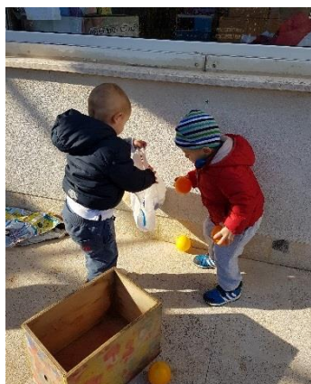
Slika 30. Igra na otvorenom

Strastvenim penjačima kakva su mala djeca na dvorištu treba osigurati i prostor za penjanje. U podnožju penjalica treba biti mekana površina, a uz širok niski tobogan dobro bi bilo imati i kratki tunel. Na otvorenom se djeca rado voze različitim guralicama, igračkama vozilima, triciklima, biciklima bez pedala. Ako postoji staza za vožnju, bolje je da ide ukруг nego da je ravna. Ljuljačka treba biti smještena dalje od prostora za šetnju, staze za vozila i ograde igrališta. Sjedala ljujačke trebaju biti mekana sa sigurnosnim remenom, a tijekom ljuljanja potreban je nadzor odraslih. Bilo bi dobro da igralište još sadrži pješčanik i prostor za igre s vodom i raznim materijalima.