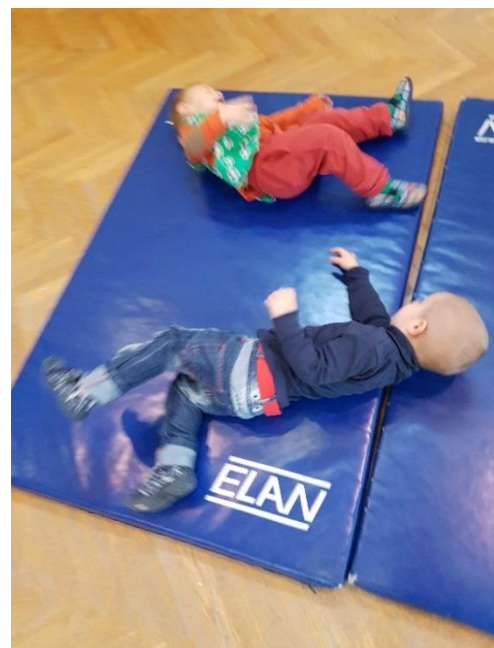
Slika 8. Vježba "palačinka"

Kolutanje je zahtjevnija motorička aktivnost u odnosu na kotrljanje. Može se prvo izvoditi na kosini (najprije na većoj, pa sve manjoj), a zatim na ravnoj podlozi. Prilikom provedbe vježbi kolutanja, obavezno je osigurati pomoć.