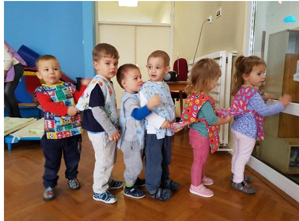
Slika 21. "Vlakić" je spreman za polazak

Zapažanja i izazovi: Vježbanje u dvorani najbolje je organizirati za vrijeme preklapanja radnog vremena odgajatelja. Često se događa da neko dijete treba odvesti do toaleta ili ga treba presvući, neko dijete treba spustiti sa švedskih ljestvi kako ne bi palo, treba riješiti poneki sukob, a ako glavna aktivnost zahtjeva asistenciju odgajatelj će se naći u problemu što prije riješiti. Isto tako, postavljanje dvorane za vježbu u većini slučajeva nije moguće prije sata. Kada je odgajatelj sam s djecom, ukoliko sprave i rekvizite uzima iz spremišta djeca ostaju sama (što nije dopušteno), a postavljanje može oduzeti dragocjeno vrijeme i raspršiti i onako nestabilnu pažnju djece.