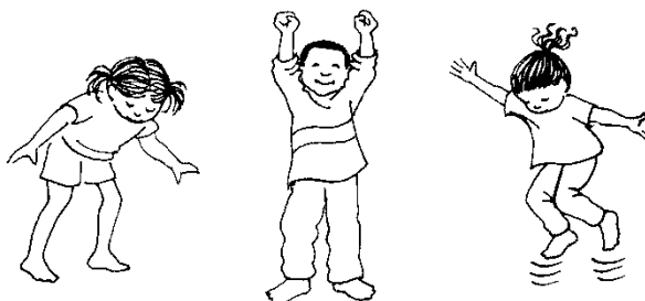
Slika 33 – djeca istražuju GORE i DOLJE