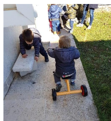
Slika 29. Dijete vozi guralicu

Da bi se izbjegle nezgode i ozljede potrebno je da sama izvedba i uređenje igrališta zadovoljavaju kriterije sigurnosti. Zato igralište za djecu rane dobi treba biti odvojeno od dijela namijenjenog starijoj, motorički spretnijoj djeci. Potrebno je redovito pregledavati prostor i ukloniti sve potencijalno opasne materijale i predmete. Igralište treba biti ograđeno i prekriveno materijalom koji će ublažiti posljedice pada (Nenadić, 2002). Na igralištu za djecu rane dobi mogu se provoditi organizirani i spontani oblici vježbanja.