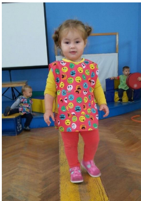
Slika 4. Hodanje po klupici

„Prati vođu“ kad odgajatelj mijenja tempo i smjer hodanja, a djeca ga prate (Sanders, 2015).