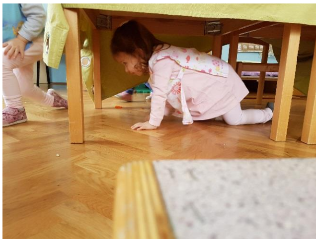
Slika 26. Poligon u sobi