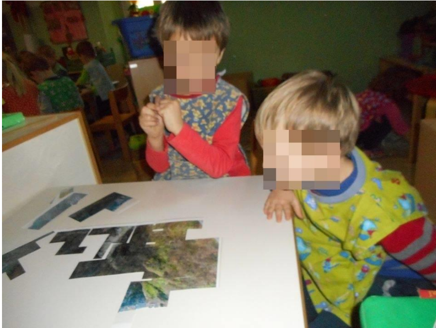
Slika 6: Izrezane slike „Pazinska jama“

Izvor: Autorica rada, (Datum: 14. veljače 2017.)