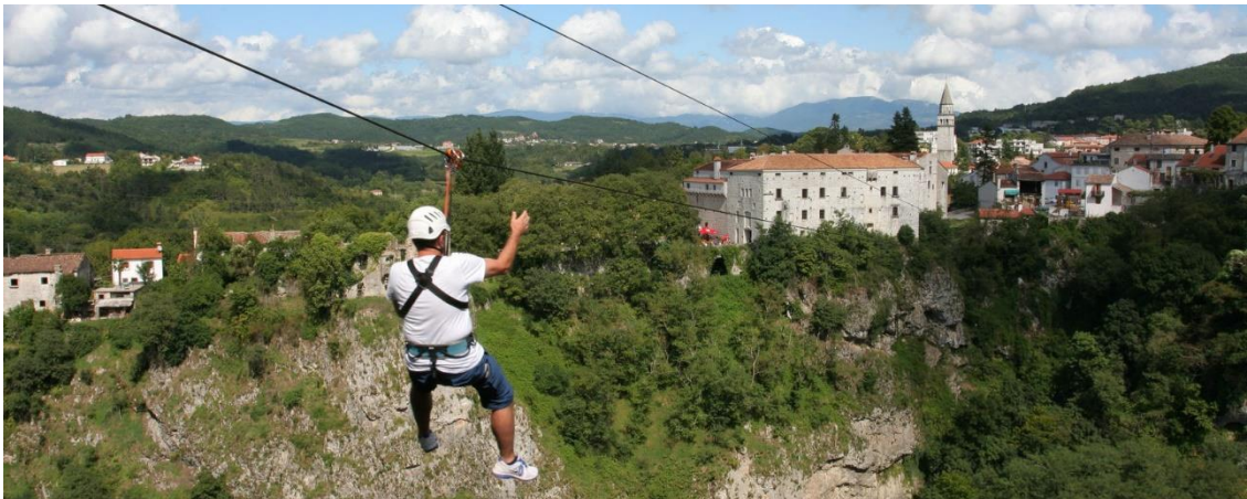
Slika 5: Zip line u Pazinu