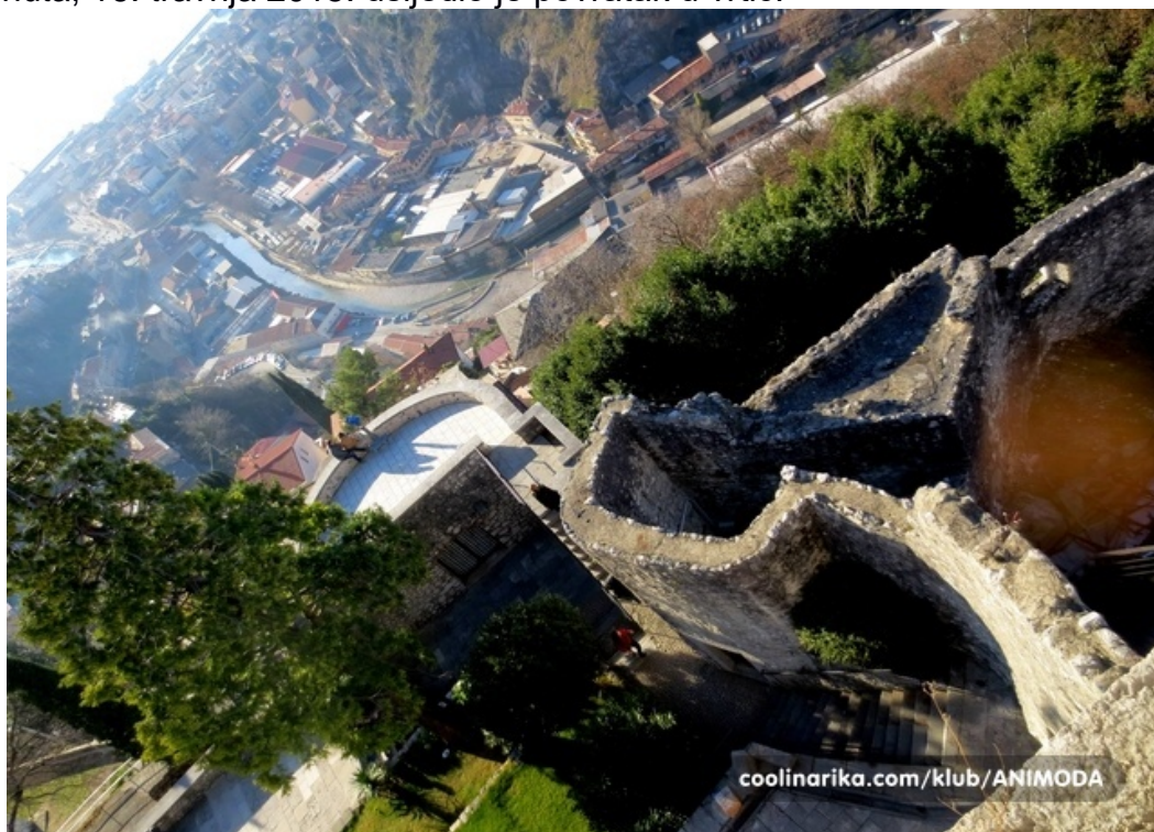
Slika 7. Trsat iz zraka, kako su djeca rekla „bilo bi lijepo vidjeti Trsat očima zmaja“

Po odlasku iz kazališta, u kojem su djeca imala priliku vidjeti zanimljivu priču o spašavanju grada na Riječini, sljedeća postaja bio je Trsat. Djeca su s nestrpljenjem željela vidjeti „spasitelja“ kako su nazivali Trsatskog zmaja. Nakon što su ga ugledali, djeca su ga dodirivala i pitala se hoće li oživjeti, dok su se neki pitali da li taj zmaj može rigati vatru. Nakon razgledavanja kule, zmaja i prelijepog pogleda s vrha kule gdje se vidjela cijela Rijeka, krenulo se u kratku šetnju po Trsatu i oko kule gdje se nalaze razne znamenitosti poput crkve i parka. Nakon obilaska Trsata oko 13 sati i 30 minuta, 16. travnja 2015. uslijedio je povratak u vrtić.