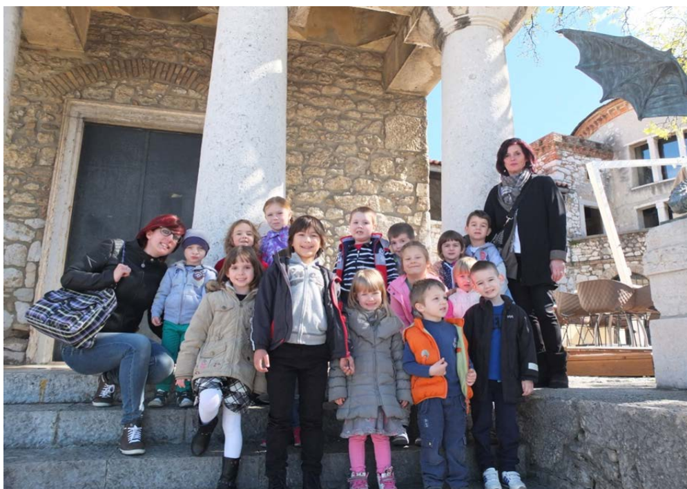
Slika 6.: Reprodukcija izletnika iz dječje grupe „Morčić“ sa Rastočina 16. travnja 2015. godine

U planu izleta, predstava je bila prva aktivnost. Prema planu, izletnici su stigli u Gradsko kazalište lutaka – Rijeka. Predstava „Trsatski zmaj“ odigrana je i nakon nje djeca su ispitana o svom dojmu o pogledanom. Sva su se djeca aktivno uključila u ispitivanje te raspravu.