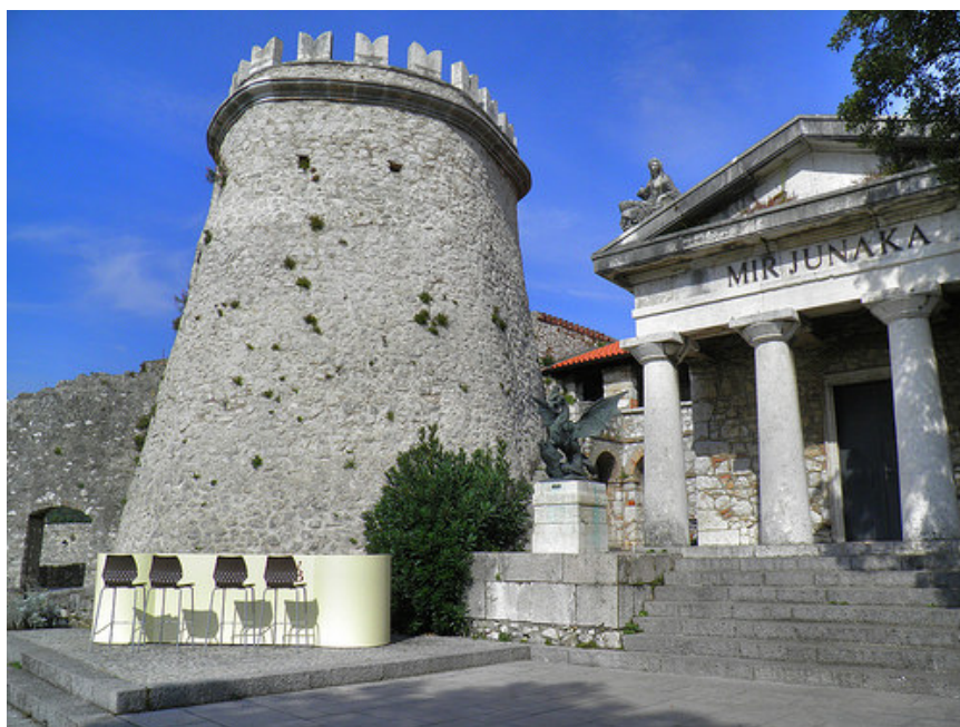
Slika 1: Fotografija Trsatske kule

„Stanovništvo prastaroga grada Tarsatike povuklo se na istočnu obalu Rječine i sagradilo utvrdu na brdu Trsat, na koji su prenijeli ime svojega nedalekog napuštenog grada Tarsatica. Utvrda na Trsatu čuvala je ubuduće novu hrvatsku granicu na Rječini. Razrušena Tarsatica prestala je postojati kao grad i u njoj su se nastanile tek poneke ribarske, stočarske i poljodjelačke obitelji.“ (Margetić, 2000)