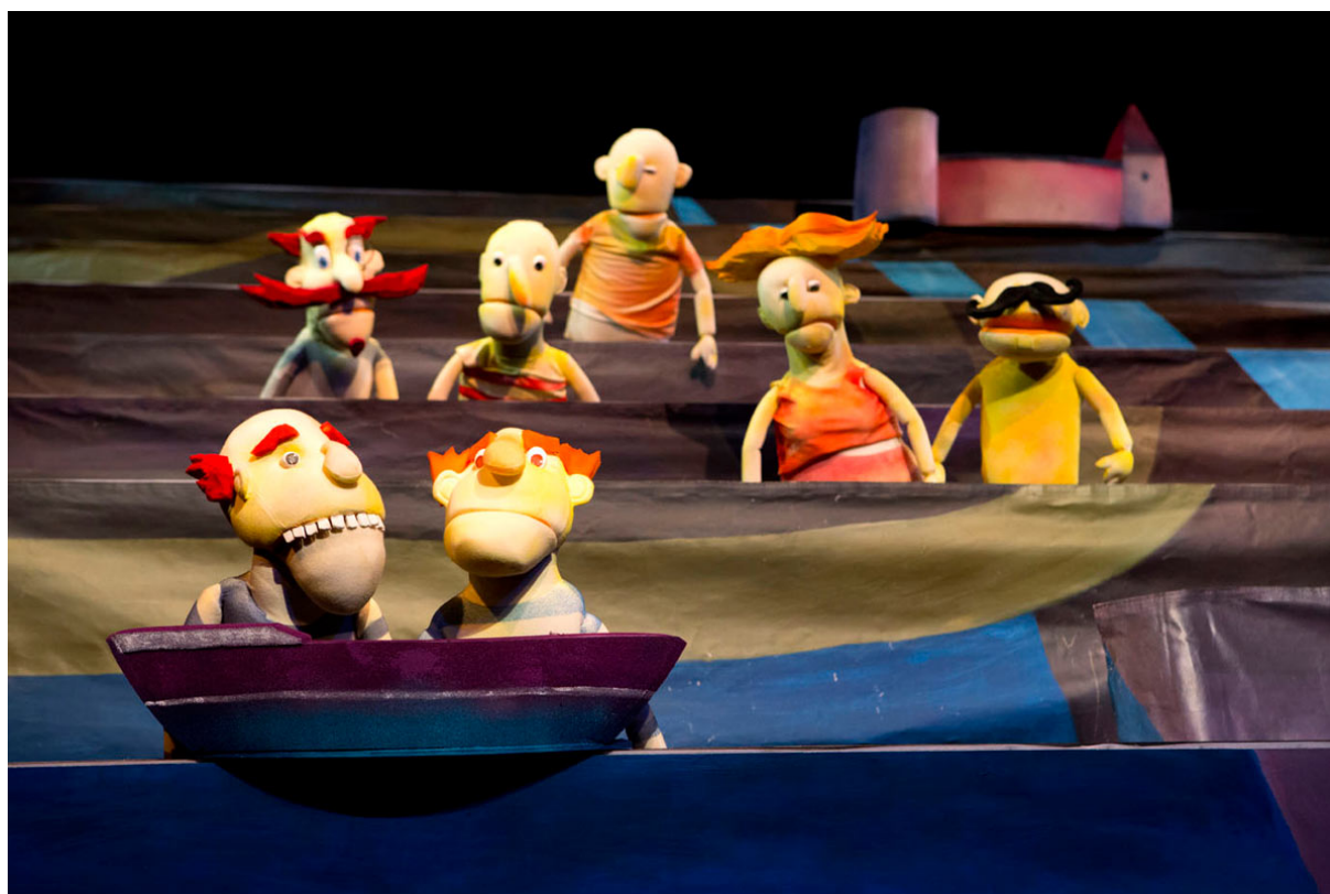
Slika 4: Prizor iz lutkarske predstave „Trsatski zmaj“, (Gradsko kazalište lutaka – Rijeka, n.d.)

Primjere ovoga što govori Špindel možemo vidjeti na narednih nekoliko fotografija preuzetih s mrežne poveznice riječkog Gradskog kazališta lutaka: