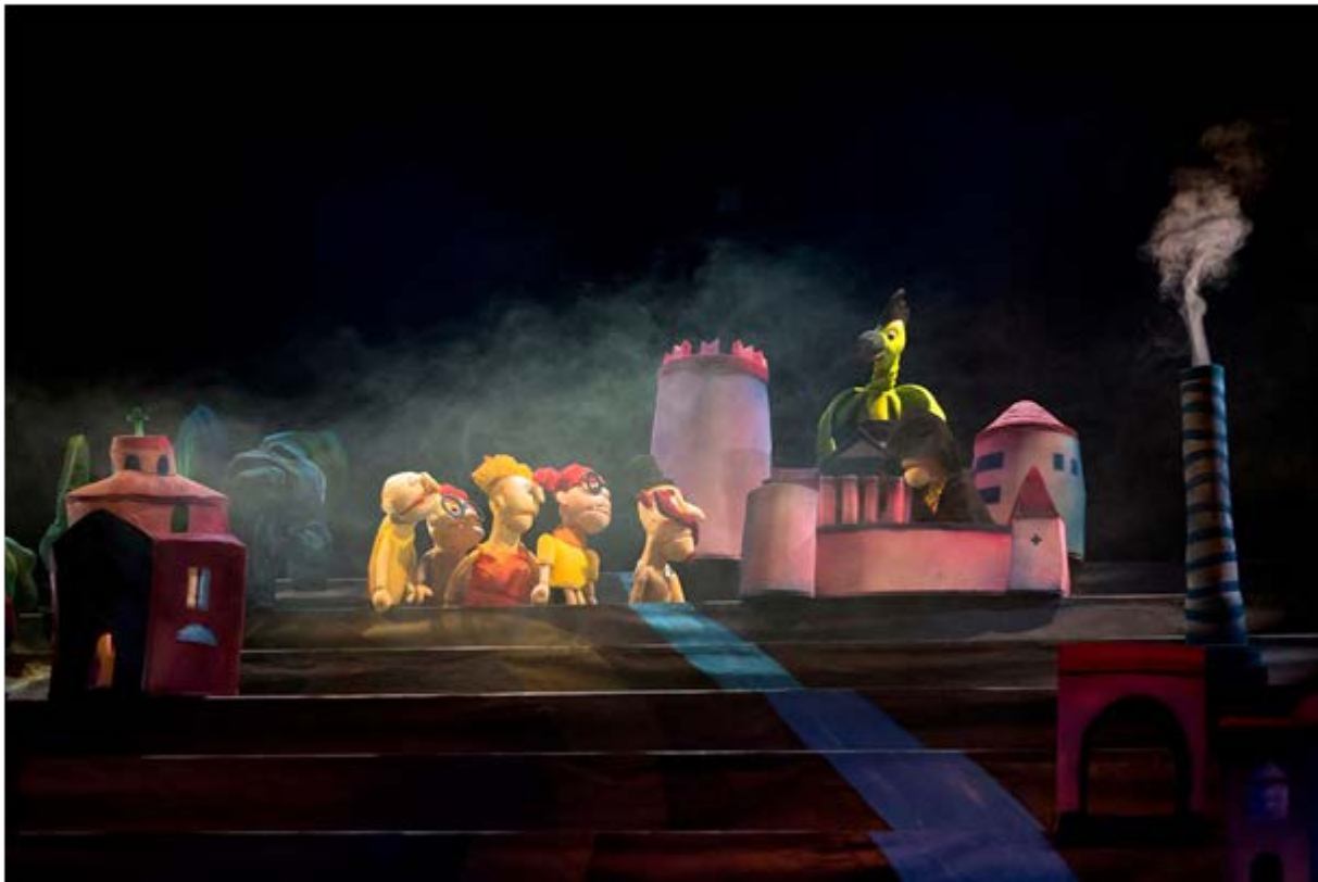
Slika 5: Prizor 2 iz lutkarske predstave „Trsatski zmaj“ (Gradsko kazalište lutaka – Rijeka, n.d.)

Iz slika 4. i 5. vidljivo je upravo ono što govori Špindel (Špindel, 2016: 10) o inspiraciji u smislu vizualnog identiteta lutaka. Jim Henson, genije lutkarstva kojem je „Muppet Show“ samo najpoznatije djelo, osmislio je lutke koje izgledaju vrlo slično dizajnu lutaka u predstavi „Trsatski zmaj“, ali ako pronalazimo mjesto gdje je ova predstava posebno značajna u vizualnom smislu, onda je to svakako spajanje scenografije i kostimografije. Upravo su iz tog razloga za prikaz u ovom radu odabrane slike 4. i 5. Ako pažljivije promotrimo fotografije i usporedimo scenografiju s kostimografijom, shvatit ćemo da se tu pojavljuju dva različita utjecaja. Osim Hensona, onaj drugi bi nam također trebao biti poznat.