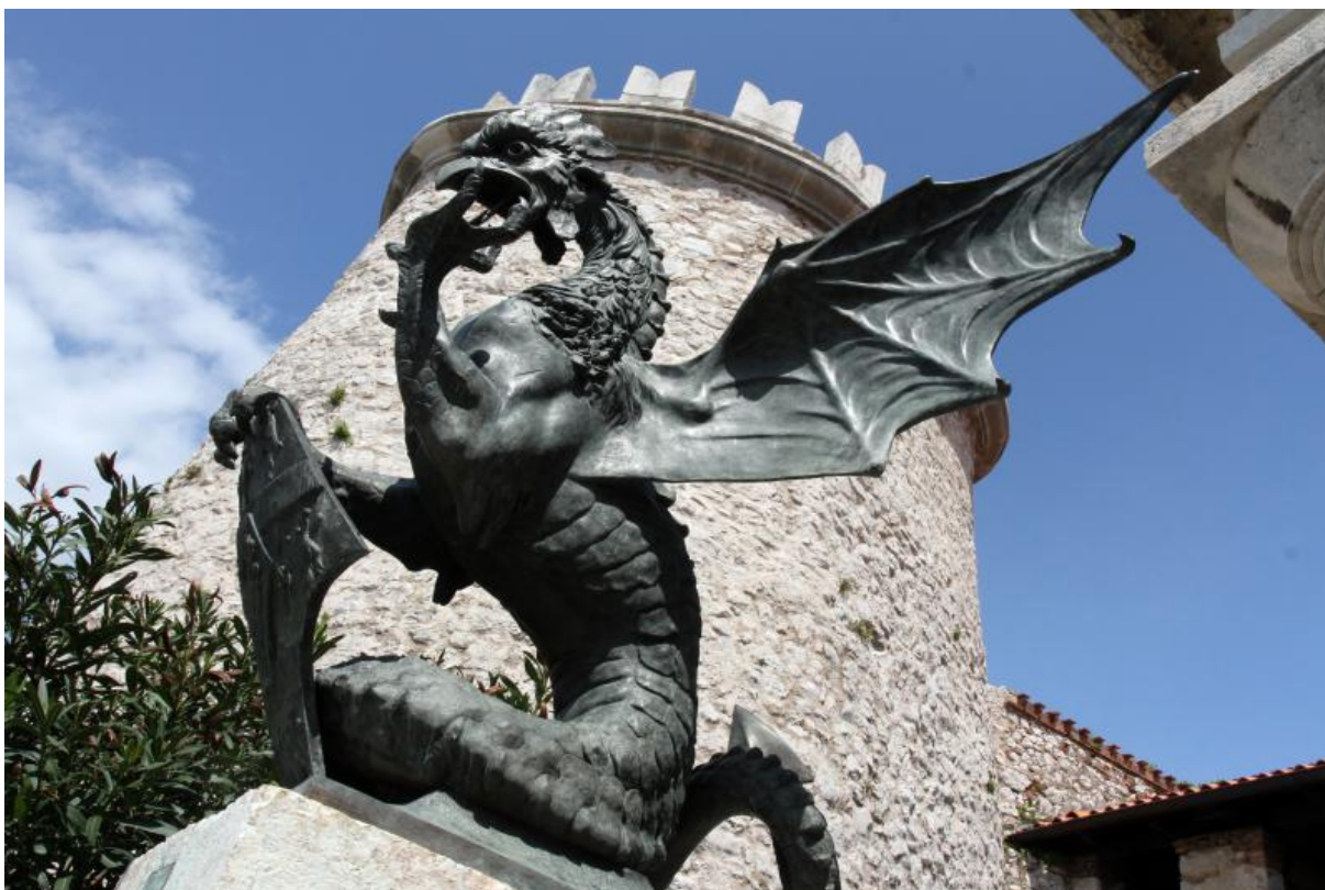
Slika 2: Kip trsatskog zmaja, autor Goran Kovačić, PIXELL, preuzeto s Večernji list (Opačak-Klobučar, 2013)

Svetište na Trsatu se po tradiciji veže za legende. Legenda o kućici sv. Obitelji najpoznatija je od svih. O povezanosti svetišta u Loretu i svetišta na Trsatu (Margetić, 2002) najpoznatiji je izvor analiza Luje Margetića „Loreto i Trsat“ koja se zasniva baš na toj legendi. Zbog toga, nije nikakvo čudo da je legenda o Trsatskom zmaju, jednako kao i ona o Juri Grandu, naišla na plodno tlo. Tradicija zmaja koji štiti kulu u potpunosti odgovara tradiciji same kule, ali i kraja u kojem se nalazi. Isto tako, ne treba zanemariti niti tradiciju pojavljivanja zmaja u fantastičnoj literaturi kroz povijest na koju je sjajno nadograđen rad na slikovnici i predstavi o trsatskom zmaju.