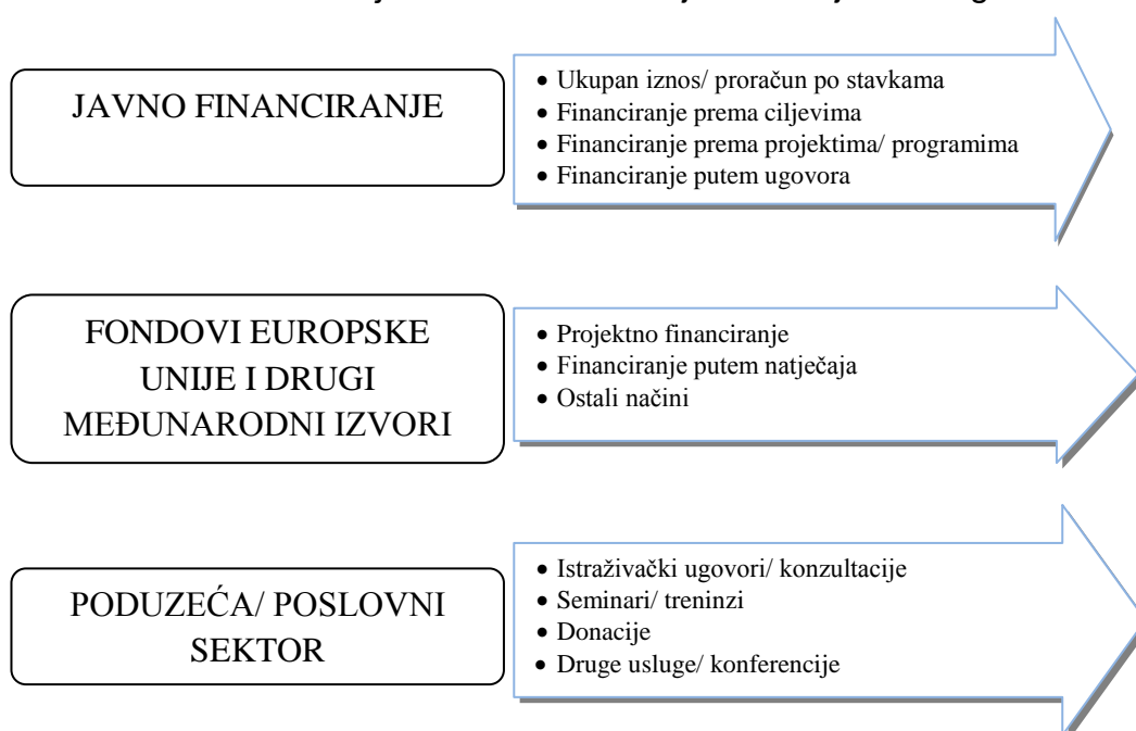
Slika 1. Izvori financiranja i načini financiranja institucija visokog obrazovanja

Prisutnost različitih izvora financiranja i raznolikosti u njihovoj zastupljenosti između europskih zemalja je velika. Sistematizacija izvora financiranja prepoznaje dvije osnovne kategorije: javno financiranje i financiranje iz drugih izvora. Javno financiranje orijentirano je na državne i lokalne proračune (ovisno o teritorijalnom ustroju i fiskalnom sustavu), a financiranje iz drugih izvora podrazumijeva: školarine, financiranje kroz pružanje usluga (savjetovanja, knjižnice, prihodi od imovine i sl.), financiranje iz ugovora s privatnim sektorom, financiranje iz donacija, financiranje iz investicijskih aktivnosti te financiranje iz fondova Europske unije.