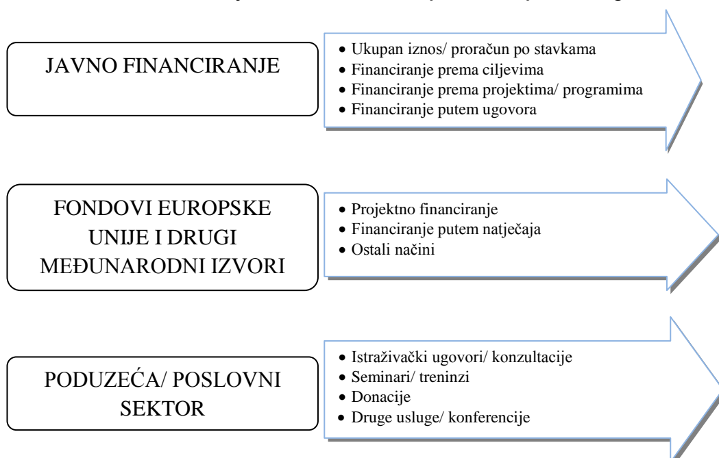
Slika 1. Izvori financiranja i načini financiranja institucija visokog obrazovanja

Prisutnost različitih izvora financiranja i raznolikosti u njihovoj zastupljenosti između europskih zemalja je velika. Sistematizacija izvora financiranja prepoznaje dvije osnovne kategorije: javno financiranje i financiranje iz drugih izvora. Javno financiranje orijentirano je na državne i lokalne proračune (ovisno o teritorijalnom ustroju i fiskalnom sustavu), a financiranje iz drugih izvora podrazumijeva: školarine, financiranje kroz pružanje usluga (savjetovanja, knjižnice, prihodi od imovine i sl.), financiranje iz ugovora s privatnim sektorom, financiranje iz donacija, financiranje iz investicijskih aktivnosti te financiranje iz fondova Europske unije.