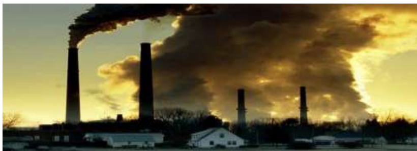
Slika 5. Utjecaj industrije na onečišćenje zraka

Izvor: Ekotrade (2014.): Opasnost u zraku, http://ekotrade.hr/clanci/opasnost-u-zraku/ (14. svibnja 2015.)