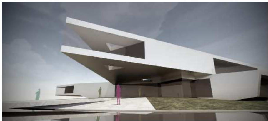
Slika 3. Vizualizacija prezentacijskog centra

područje. Atraktivnom i suvremenom arhitekturom centar će biti prilagođen ukusima globalnog tržišta te će nedvojbeno moći parirati brojnim sličnim inozemnim građevinama. Prezentacijski centar će biti u obliku slova „Ž“, laganog nagiba od 4 % gdje će posjetitelj kroz jednu povezanu cjelinu i šetnju proživljavati priču o proizvodu te u konačnici doći do ostakljenog vidikovca u sklopu restorana gdje će moći uživati u pogledu na nepregledna i plodna slavonska polja.