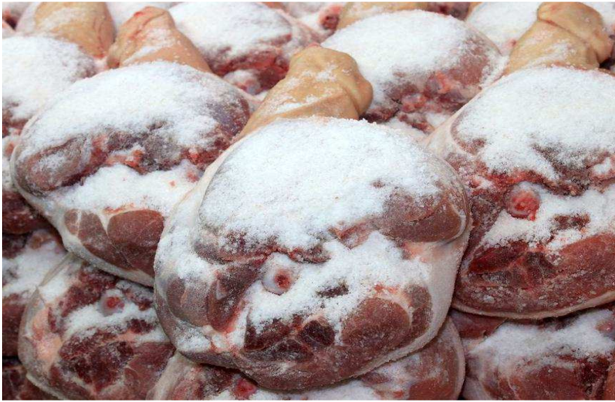
Slika 2. Nasoljeni pršut