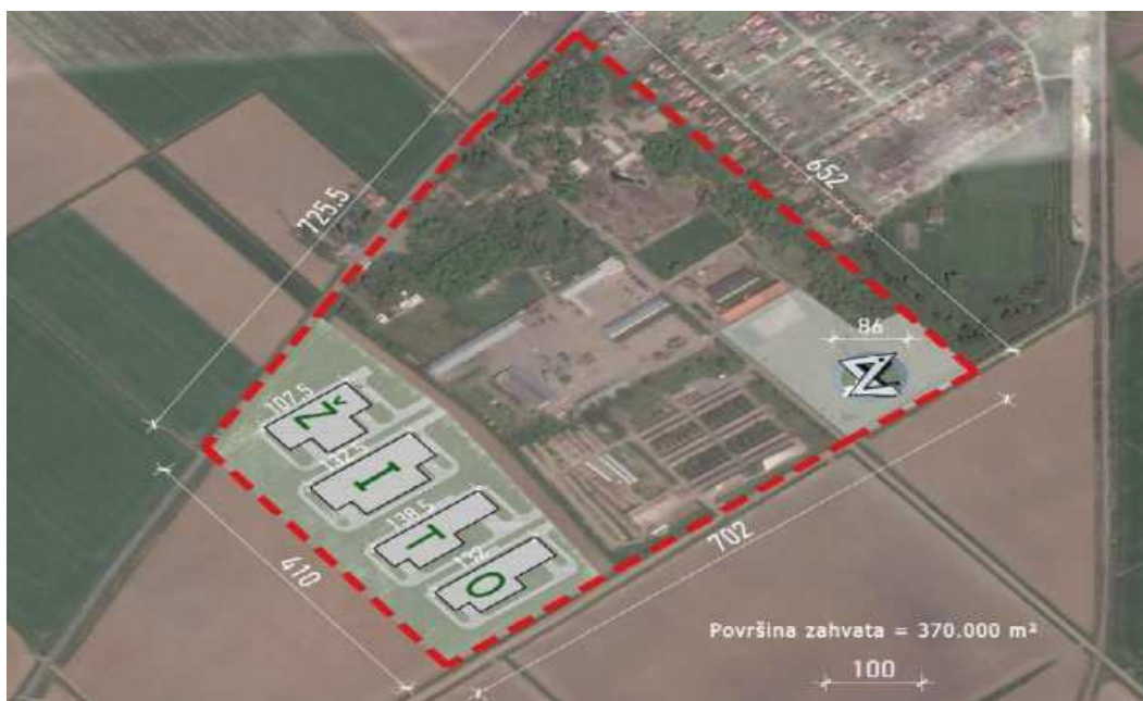
Slika 4. Panoramski prikaz lokacije proizvodnih pogona i prezentacijskog centra