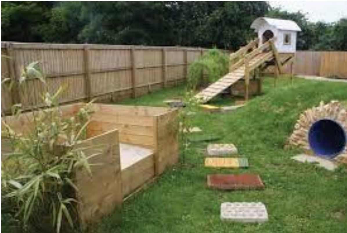
Slika 6. Izgled uređenog zemljišta