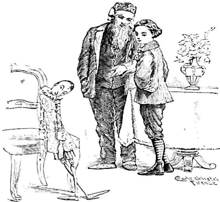
Slika 8. Dječak imenom Pinocchio