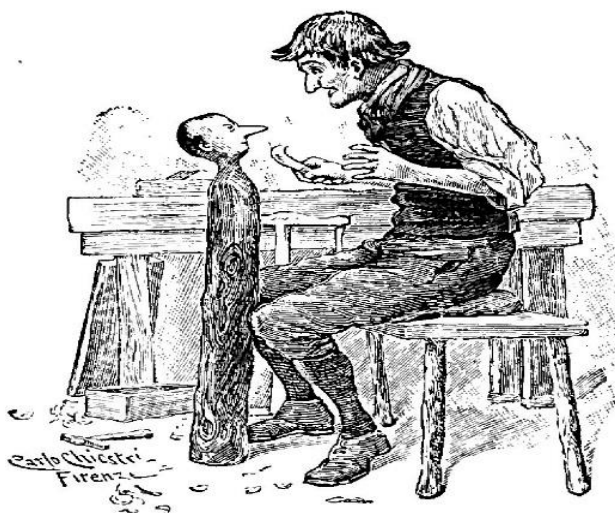
Slika 6. Komad drva koji govori i skače

Čitateljsko očekivanje bajke nestaje uvođenjem sasvim običnog predmeta kao što je komad drveta, umjesto standardnog (očekivanog) junaka bajke, a nadalje i samim smještanjem radnje u drvodjeljsku radionicu umjesto u daleko kraljevstvo (slika 6.). Na taj način pripovjedač želi što očitije pokazati svoju namjeru, a to je – realistički ispričovijedati priču. Ipak, realizam prestaje već prvim fantastičnim događajem, oživljavanjem komada drveta, a ponovo se uspostavlja na samome kraju, kada Pinocchio postaje dječak.