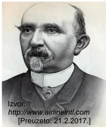
Slika 1. Portret Carla Collodija