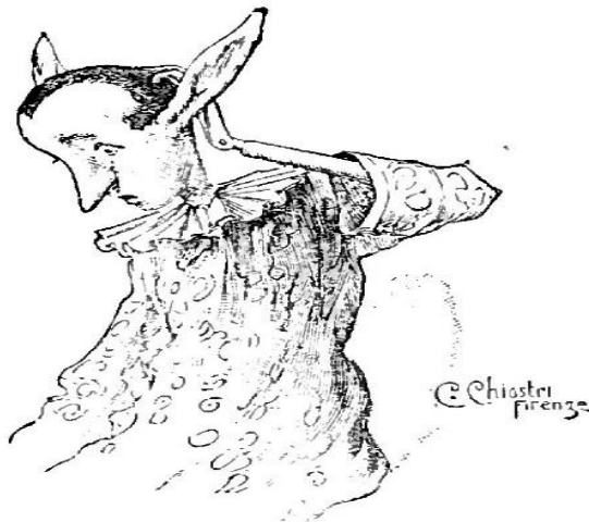
Slika 3. Lutak ili pas?