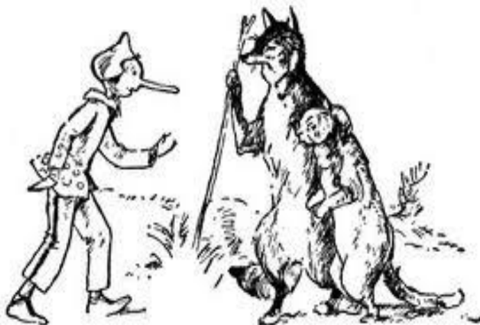
Slika 4. Mačak i Lisica