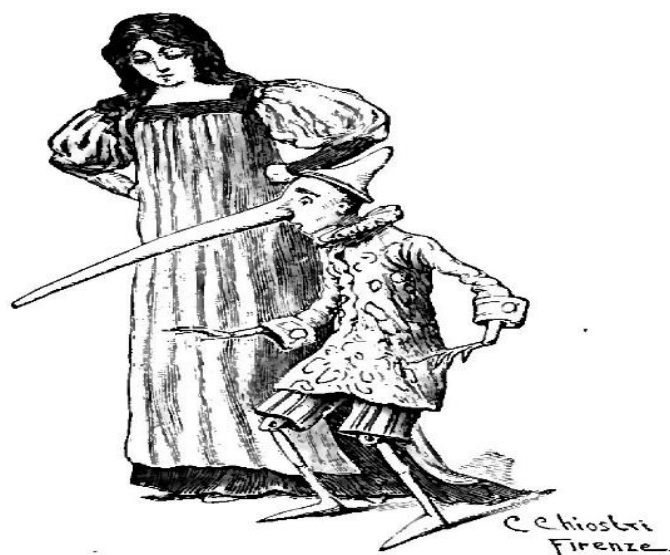
Slika 5. Dug nos