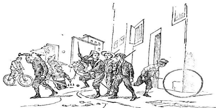
Slika 2. Ići u školu ili slušati frule?