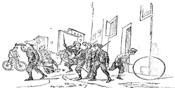
Slika 2. Ići u školu ili slušati frule?