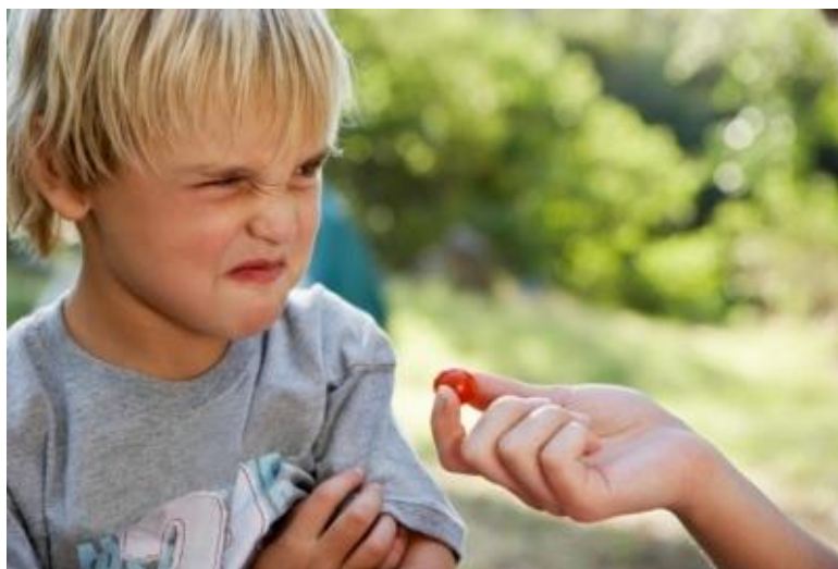
Fig.2 – Espressione di disgusto, ( http://www.foodandnutrition.org/images/cache/cache_a/cache_f/cache_f/picky_vs_spd-84038ffa.jpeg?ver=1469758488&aspectratio=1.5 , consultato il: 3 aprile 2016)

L'espressione di disgusto (Figura 2) invece, appare con il naso arricciato, il labbro superiore sollevato, palpebre superiori e sopracciglia abbassate e aggrottate.