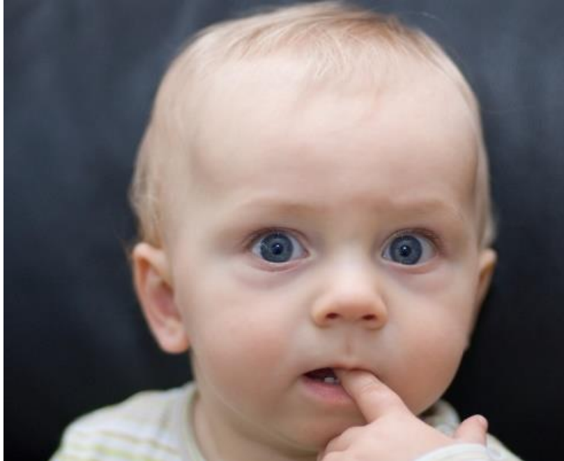
Fig.9 – Occhi sporgenti, ( http://www.swimmingly.com/wp-content/uploads/sites/6/2014/04/anxious-baby.jpg , consultato il: 4 aprile 2016)