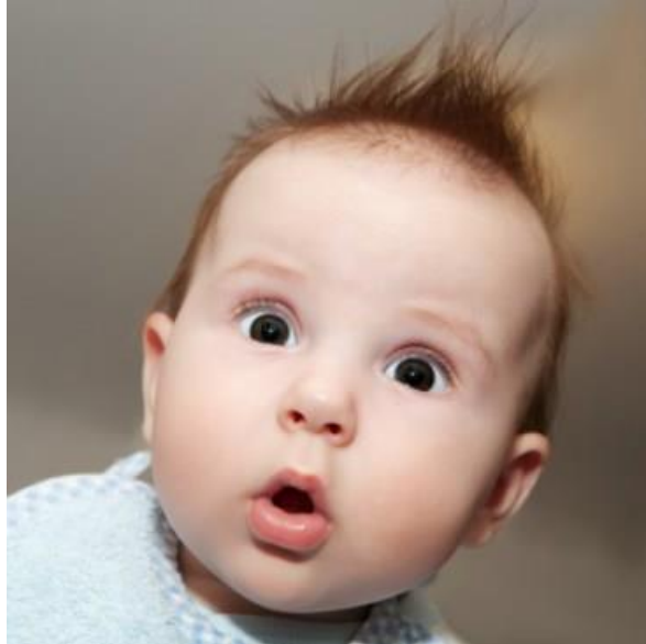
Fig.1 – Espressione di sorpresa, ( https://us.123rf.com/450wm/AnaBGD/AnaBGD1309/AnaBGD130900330/22123012-carino-4-mesi-di-et-bambino-che-fa-un-fronte-divertente-sorpresa.jpg?ver=6 , consultato il: 3 aprile 2016)

La sorpresa (Figura 1) di solito si esprime con le sopracciglia sollevate che fanno comparire rughe orizzontali sulla fronte, gli occhi sono sgranati e la bocca è aperta.