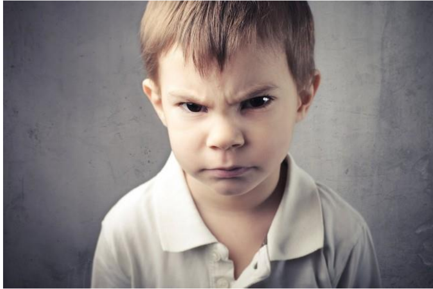
Fig.3 – Espressione di collera, ( https://ifloridibach.com/wp-content/uploads/2015/07/rabbia-nel-bambino1.jpg , consultato il: 3 aprile 2016)

Le pieghe verticali , invece, possono apparire in casi di concentrazione su attività faticose e difficili ma pure in situazioni di collera, rabbia, malumore.