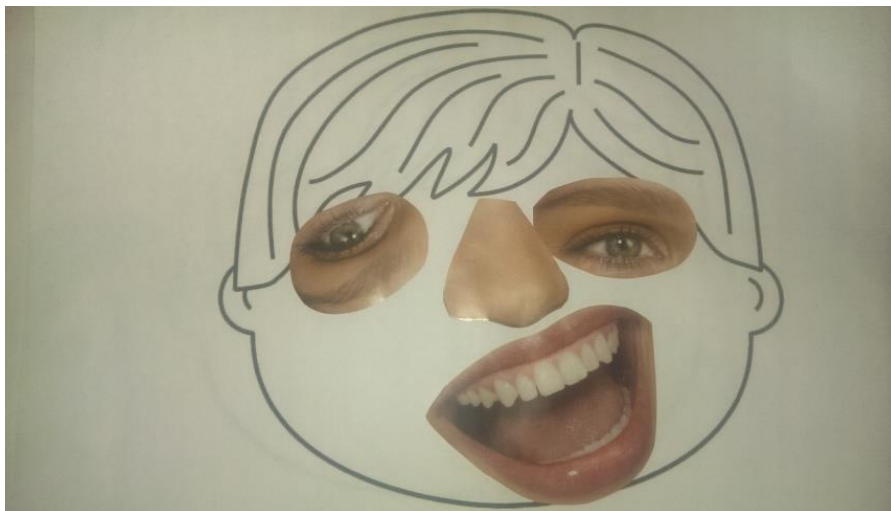
Fig.16 – Il faccione

Mezzi: ritagli (di vari giornali) rappresentanti nasi, occhi e bocche; colla; contorno di un volto stampato su un foglio