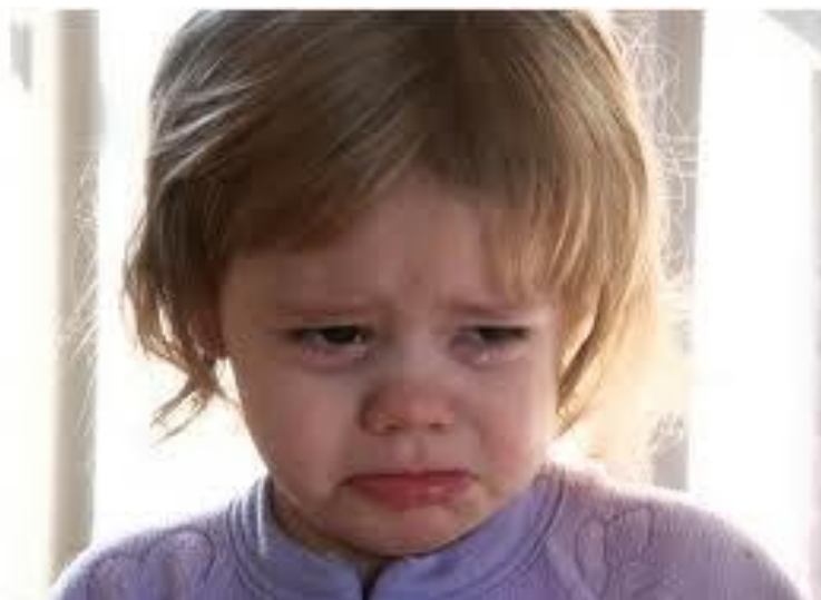
Fig.12 – Angoli della bocca abbassati, (da http://4.bp.blogspot.com/-xRWIMIsbPZ8/UzsVz9AuOwI/AAAAAAAAABE/FhqH6ayO-4U/s1600/crying_girl_child_sad.jpg , consultato il: 6 aprile 2016])

Una bocca stretta con gli angoli abbassati (Figura 12) indica delusione e infelicità.