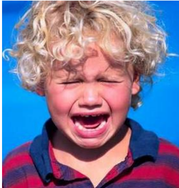
Fig.5 – Movimento della tristezza, ( http://static.pourfemme.it/pfmamma/fotogallery/1200X0/1065/bambino-che-piange.jpg , consultato il: 4 aprile 2016)