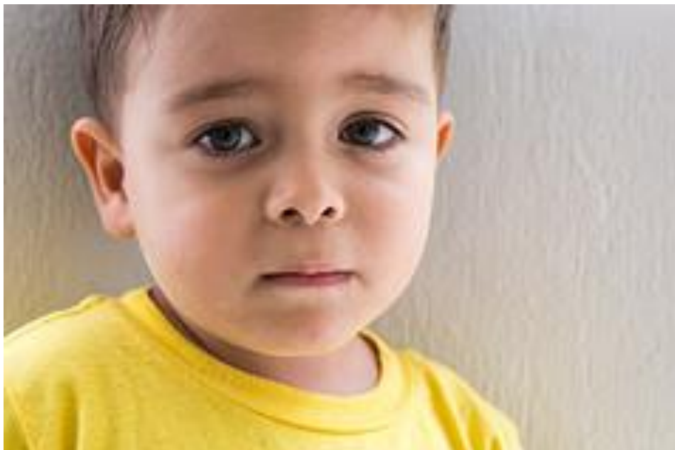
Fig.10 – Occhi incassati, ( https://favim.com/image/3828915/ , consultato il: 4 aprile 2016)