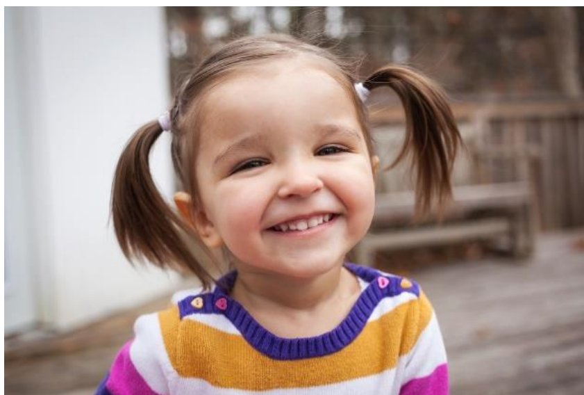
Fig.13 – Il sorriso, ( https://c1.staticflickr.com/9/8350/8259192909_baf07fb306_b.jpg , consultato il: 6 aprile 2016)

Il sorriso (Figura 13), invece, indica gioia e benessere del bambino.