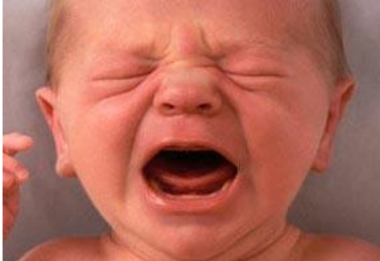
Fig.7 – Movimento di aggrottamento, ( http://bravibimbi.riccardoporta.netdna-cdn.com/wp-content/uploads-09/2010/02/bambino-piange.jpg , consultato il: 4 aprile 2016)

La regione mediana comprende la zona degli occhi e delle guance.