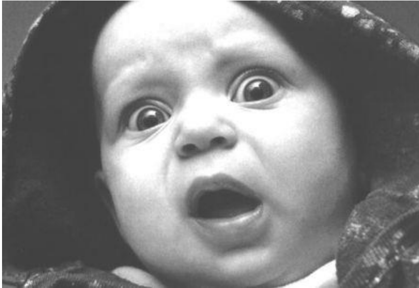
Fig.11 – Bocca aperta, ( http://r.fod4.com/s=h550,pd1/o=80/http://p.fod4.com/p/media/5b36de3f5a/ai8L4XoxQUC5Ud5yhbaR_1399176230942.jpg , consultato il: 6 aprile 2016)

Una bocca aperta può, certe volte, indicare spavento (Figura 11).