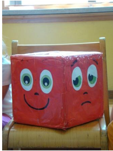
Fig.14 – Il dado dei sentimenti