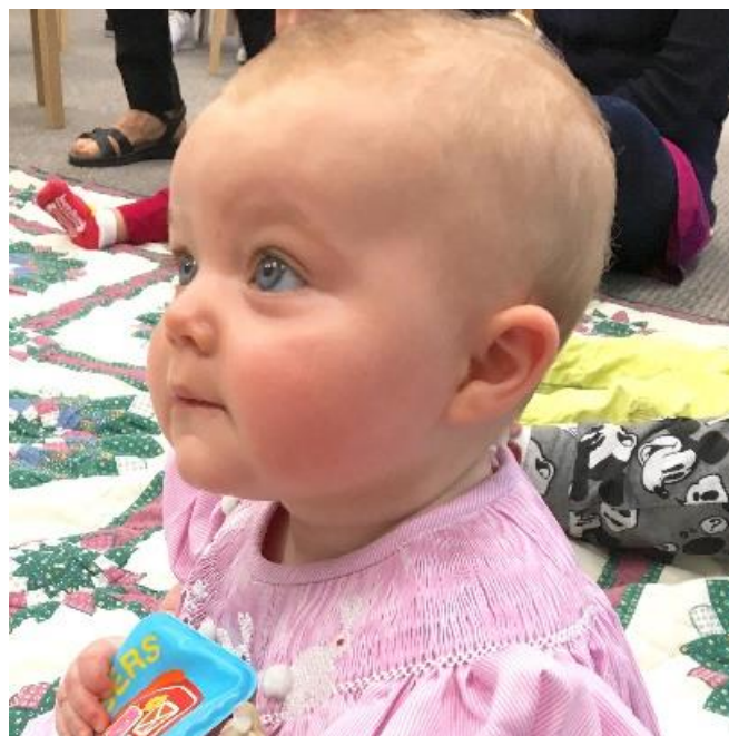
Fig.4 – Movimento dell'attenzione