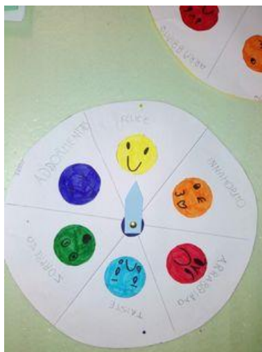
Fig.15 – Ruota delle emozioni

Svolgimento: I bambini a turno si avvicinano alla ruota delle emozioni, fanno girare la freccia fissata al centro del disco e uno alla volta devono riferire un episodio in cui gli è capitato di provare l'emozione rappresentata sul disco.