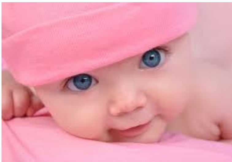
Fig.8 – Occhi grandi e tondi, ( http://static.robadaadonne.it.s3.amazonaws.com/wp-content/uploads/sites/3/2014/10/come-prevedere-il-colore-degli-occhi-nei-neonati2.png , consultato il: 4 aprile 2016)