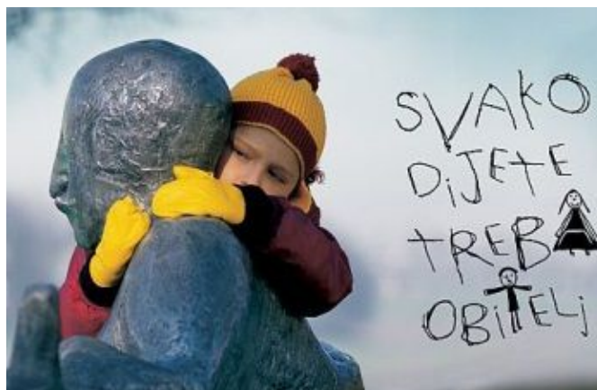
Slika 2. Svako dijete treba obitelj