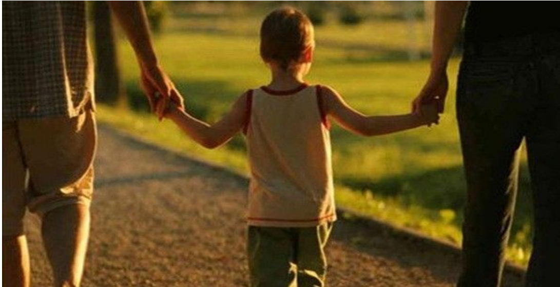
Slika 3. Potrebna je ljubav