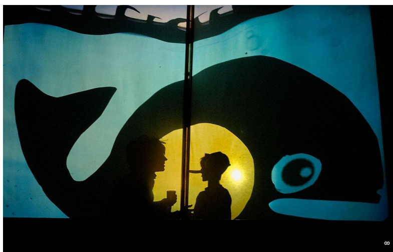
Slika 6. Pinocchio, Teatar Naranča

koje će dočarati pojedine scene i likove. Postoje mnoge aktivnosti kojima će se izvoditi sjene, a jedna od zanimljivijih djeci i odraslima je crtanje s pijeskom. Pritom se mogu koristiti i razne mrežice pomoću kojih će se postići bolji efekt. Lutke se mogu izrađivati pomoću platna, papira, plastike, drva i mnogih drugih materijala koji se mogu jednostavno nabaviti. Djeca predškolske dobi mogu samostalno izrađivati sredstva potrebna za izvođenje predstave u kazalištu sjena. Važno je omogućiti djeci raznovrsne aktivnosti u kojima će, uz pomoć odrasle osobe, stvoriti svoje kreativne radove. "Teatar Naranča" iz Pule potiče djecu i odrasle na sudjelovanje u predstavama. Sve su njihove predstave radovi akademskih glumaca, redatelja, slikara, glazbenika te polaznika dramskog studija koji se uključuju kako bi stekli nova iskustva i znanja. Jedan od glavnih ciljeva je poticanje djece na sudjelovanje u predstavama kako bi ona mogla samostalno izrađivati predmete od raznovrsnog materijala. Predstave „Pinocchio“ i „Snježna kraljica“ su karakteristične po tome što se u njima javljaju elementi kazališta sjena. Gledatelji su se prilikom izvođenja mogli u potpunosti uživjeti u sadržaj predstave zbog različitih pokreta ruku i modela lutaka koje su bili izrađene od raznovrsnog materijala. U predstavi „Snježna kraljica“ koristili su se različiti efekti kao što je primjerice dočarano padanje snijega i korištenje svjetla u raznim bojama.