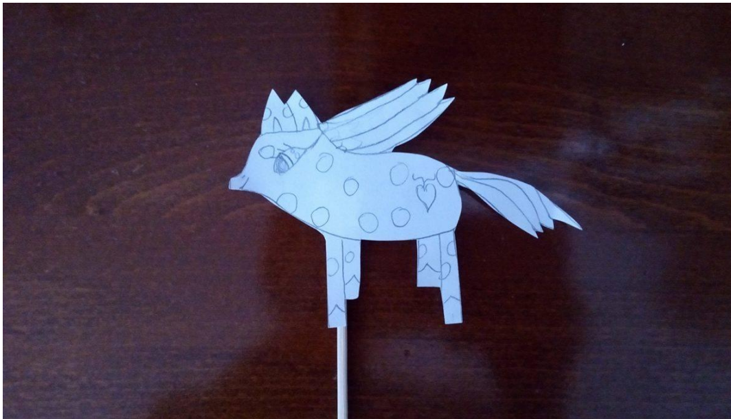
Slika 11. Lutka djevojčice A. J. (6 godina i 4 mjeseca)

Nakon što su djeca završila s izradom lutaka na štapu svako sam dijete zamolila da mi kaže ime svoje životinje i zašto je baš odabrao životinju koju je nacrtao. U nastavku donosim analizu pet odabranih radova.