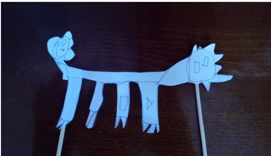
Slika 15. Lutka dječaka L. B. (4 godine 3 mjeseca)