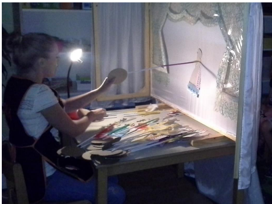
Slika 11: Djeca glume lutkama iz odgledane predstave