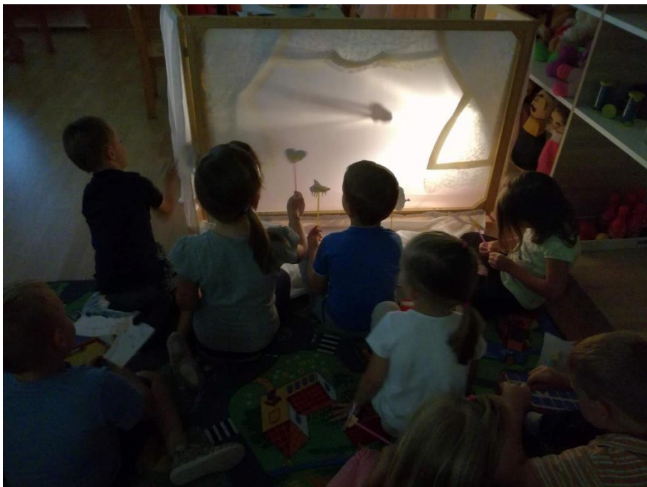
Slika 16: Igra vlastitom sjenom