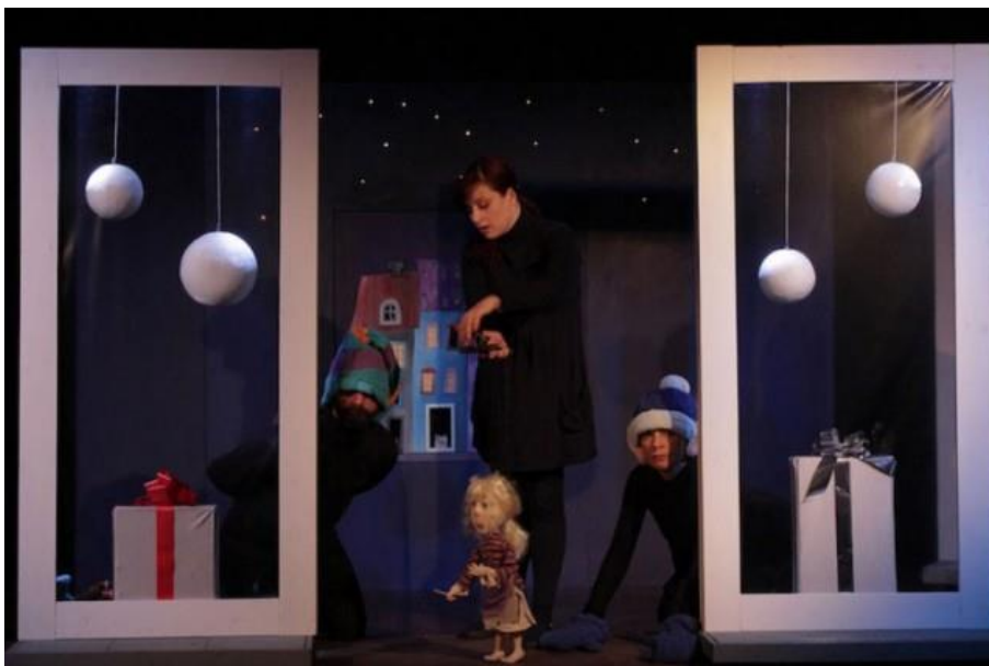
Slika 2 : Scena lutkarskog kazališta

Scena i lutka su međusobno povezane, one se upotpunjuju i ako je potrebno neki dijelovi scene se mogu pomicati. Iako u vrtiću nemamo uvjete kao u lutkarskom kazalištu, uvijek možemo iskoristiti raspoloživa sredstva kao što su stolovi, stolice i igračke. Prije nego što počnemo izrađivati scenografiju, možemo zamoliti djecu da nacrtaju prostor u kojem zamišljaju da će lutke razgovarati i živjeti, također prije nego što izradimo lutke mogu i njih nacrtati. Kako bi se bi mogli bolje predočiti izgled scene možemo napraviti maketu unutar kartonske kutije.