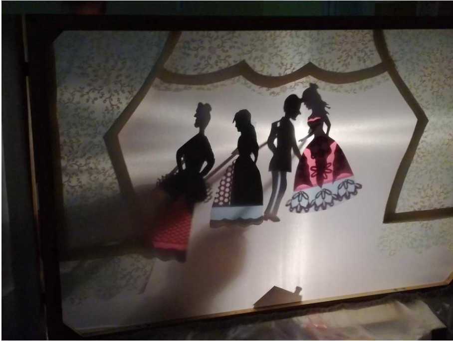
Slika 13: Igra sjenom i svjetlosti