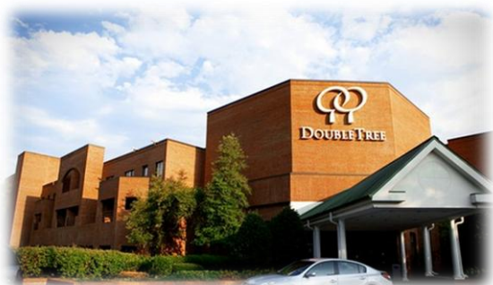
Slika 5. Double Tree Hotel by Hilton