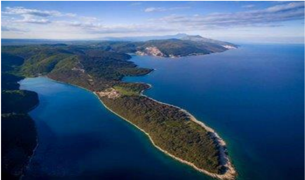
Slika 7. Prklog

Izvor: http://www.labin.hr/obavijest-o-izradi-urbanistickog-plana-uredenja-turisticko-razvojnog-podrucja-prtlog-1-i-prtlog-2