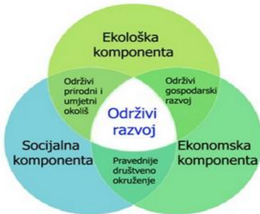
Slika 3. Temeljne sastavnice održivog razvoja društva