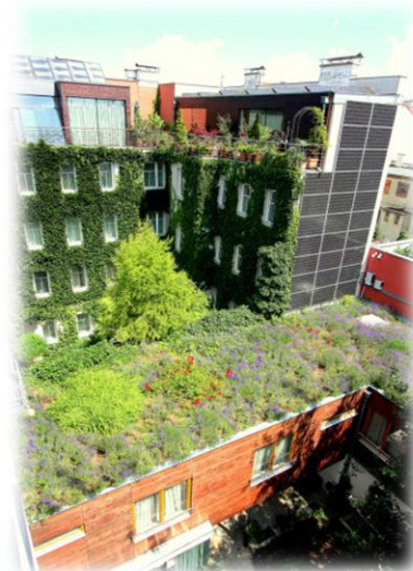
Slika 6. Boutique Hotel Stadthalle Beč