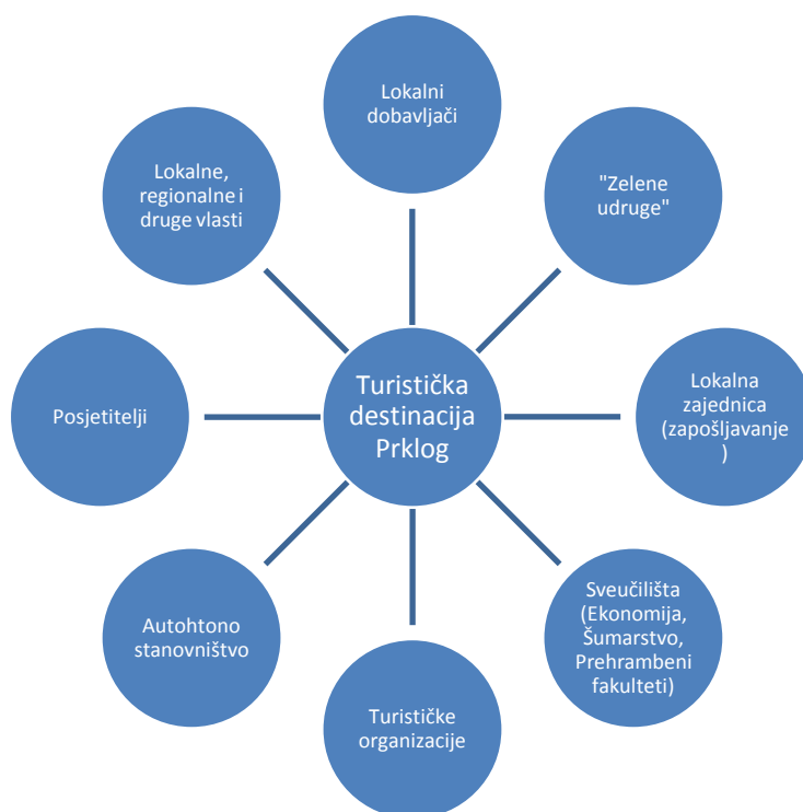
Slika 8. Utjecajno-interesne skupine destinacije Prklog