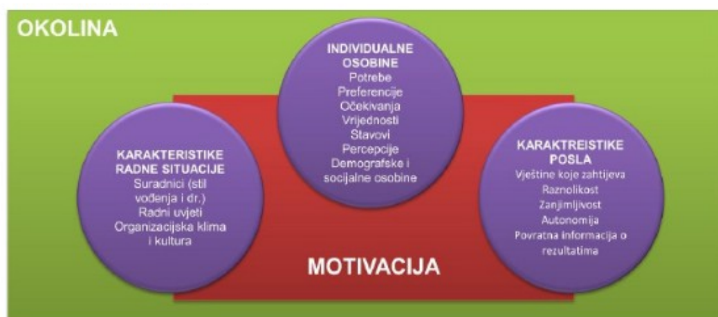
Slika 1. Čimbenici koji utječu na individualnu motivaciju u organizacijskim uvjetima