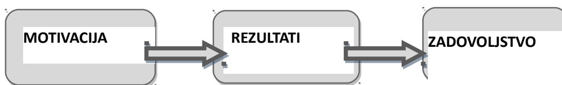
Slika 2. Shematski prikaz odnosa motivacije i zadovoljstva